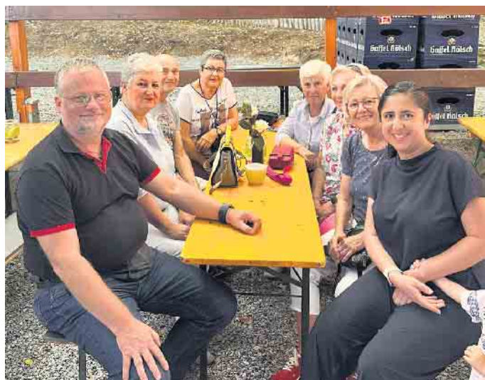
SPD Eitorf auf dem Waldfest aktiv dabei