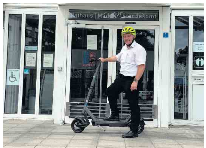
Bürgermeister Rainer Viehof