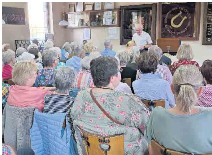
Bis auf den letzten Platz besetzt ging es musikalisch in den Abend.

Neue Stimmen sind willkommen: Chorprobe ist montags um 18 Uhr, Parkstrae 12, Eitorf. Gemeinsam singen heit, gemeinsam fhlen. Den ganzen Artikel und weitere Fotos auf www.eitorfer-gesangverein.de , Facebook und Instagram.