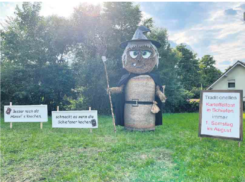
Sichtbares Zeichen unserer Vorbereitungen

Liebe Gäste, beachtet bitte, dass Am Erlenbach sowie Am Wollsbach absolutes Halteverbot besteht. Feiert mit uns gemeinsam und genießt ein paar schöne Stunden in Schiefen. Weitere Informationen zu unseren Veranstaltungen: www.dgschiefen.de oder www.eitorf.de/veranstaltungen Der Vorstand