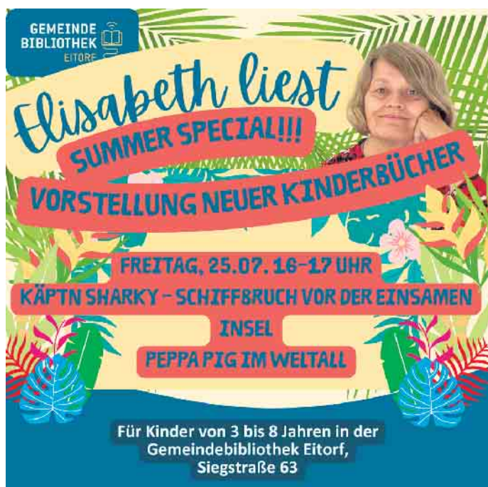
Elisabeth liest... Sommer Special

Bis dahin wünschen wir Ihnen eine erholsame und sonnige Sommerzeit!