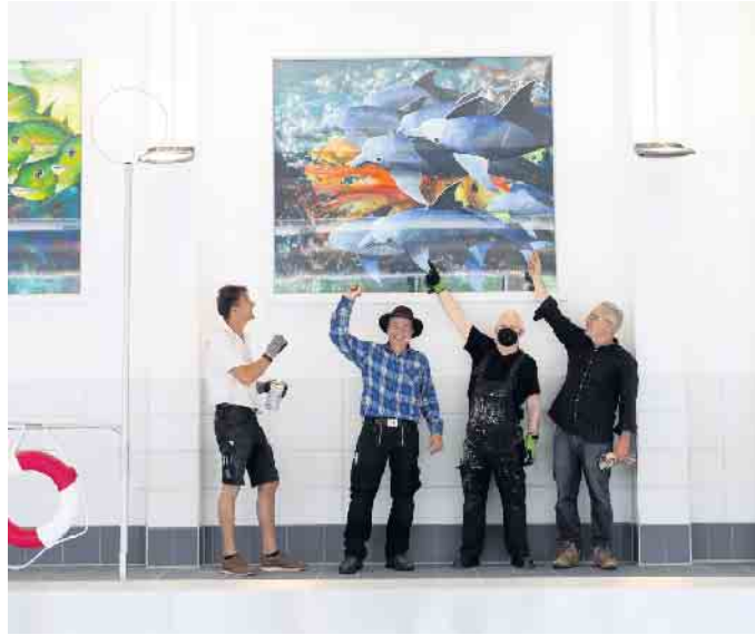
Kunstprojekt MeerLeben im Hermann-Weber-Bad

Im aktuellen Kunstwerk taucht eine Gruppe von Delfinen eleg- ant durch das Bild. Im Tempo ihres Spiels entstehen Wirbel aus unzähligen Luftblasen. Der dyna- mische Clan der blauen Meeres- säugetiere korrespondiert mit den vorangegangenen Motiven, wie den stromlinienförmigen