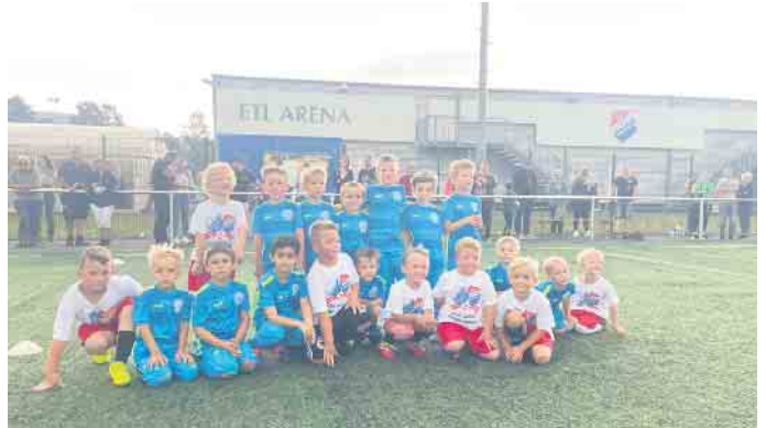
Die Akteure beider Vereine

Wann und wie es für die Jugendmannschaften nach den Ferien weitergeht berichten wir an dieser Stelle.