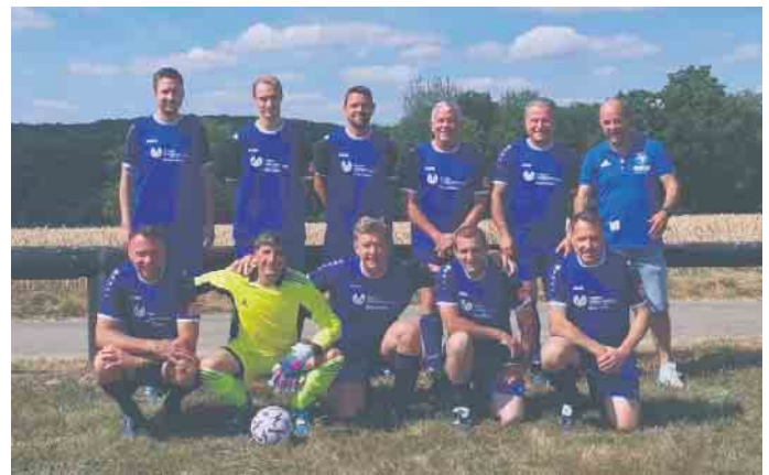
„Alte-Herren“ belegen bei den Sportfreunden Bohlscheid den zweiten Platz