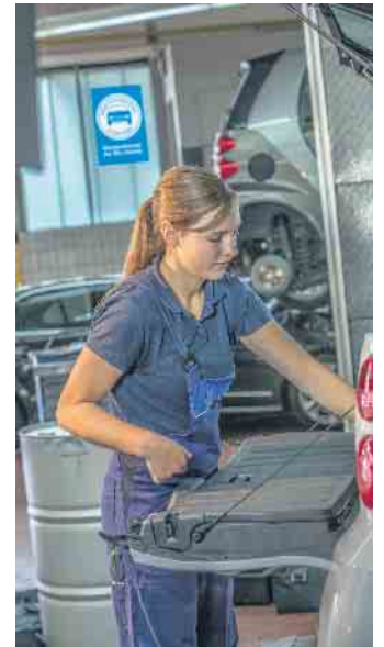
Berufe in der Kfz-Branche leisten einen wichtigen Beitrag zur Mobilität der Gesellschaft.

Dazu werden die Perspektiven aufgezeigt, die sich für die Berufseinsteiger nach dem erfolgreichen Ausbildungsabschluss eröffnen. So bringt bereits eine zweijährige Weiterbildung Spezialisierungen innerhalb des gewählten Ausbildungsberufs hervor, etwa den geprüften Kfz-Servicetechniker, geprüften Automobil-Verkäufer oder -Serviceberater sowie weitere Kfz-spezifische Qualifizierungen. Darüber hinaus steht auch der Weg zu Führungspositionen oder zur Selbstständigkeit offen. Der klassische Meister etwa kann zum Werkstattmanager oder Betriebsleiter aufsteigen, einen Betrieb übernehmen oder selbst einen gründen. Auch akademische Abschlüsse bis zum Bachelor oder Master of Business Administration in technischen und kaufmännischen Studiengängen liegen in Reichweite. (djd)