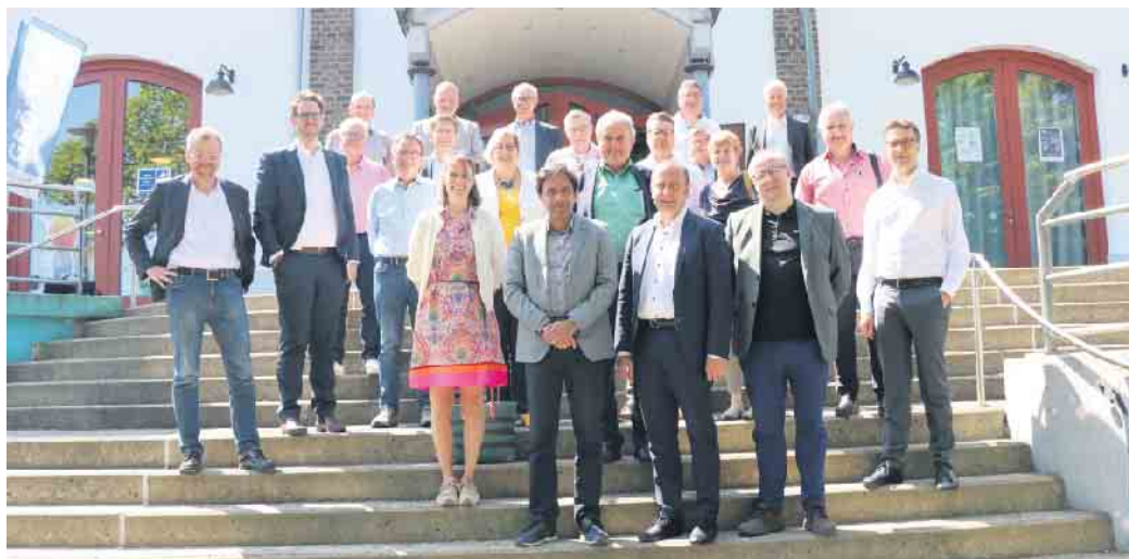
Energieagentur Rhein-Sieg: Anfang Juni trafen sich die Mitgliedskommunen der Energieagentur zur jährlichen Mitgliederversammlung in der Hennefer Meys Fabrik.

Wie könnte es anders sein - auch der Alltag der Energieagentur Rhein-Sieg wurde im Jahr 2022