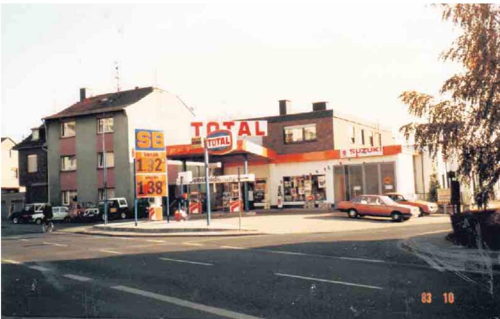
Die Tankstelle im Jahr 1984.