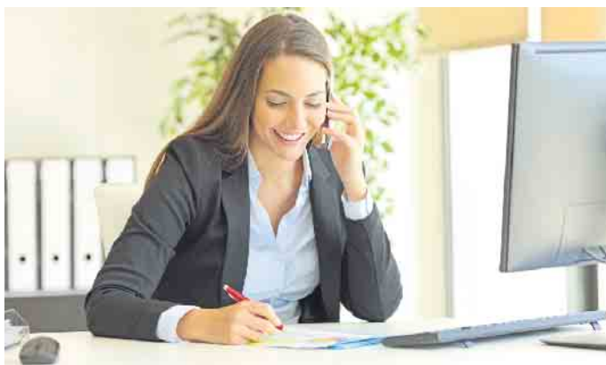
Neu an der Ausbildungsordnung für Bankkaufleute ist, dass jetzt auch kommunikative Fähigkeiten wie die Beratungskompetenz verstärkt in den Mittelpunkt rücken.