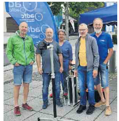
Das Team vom Reparaturstand in Dattenfeld

Insgesamt hatten wir den Eindruck, dass es auf den Straßen sehr voll war und dass der Pedelec-Boom ungebrochen ist - mindestens jedes 2. Rad hatte einen E-Motor. Beindruckend, welche Chancen sich daraus auch für die Alltagsmobilität ergeben, wenn sie denn genutzt werden. Insgesamt war es wieder ein erfolgreicher und interessanter Ein-