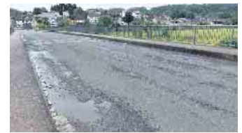
Die sanierungsbedürftige Fahrbahn auf der Bouraueler Siegbrücke