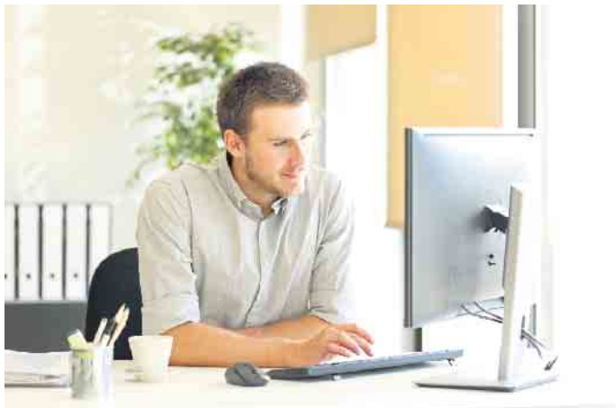
Die fortschreitende Digitalisierung verändert die Anforderungen an die Beschäftigten im Bankwesen rasant.