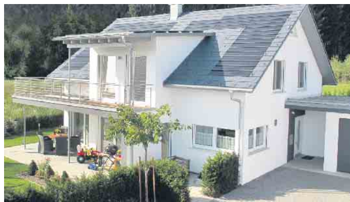
Gut für den Klimaschutz und für die Haushaltskasse: Mit steigenden Energiepreisen amortisiert sich die Photovoltaiktechnik noch schneller.

Die richtigen Ansprechpartner für eine individuelle Beratung sind Dachhandwerker vor Ort. Die Solarsysteme speichern den selbst erzeugten grünen Strom, sodass er später nach Einbruch der Dunkelheit zur Verfügung steht. Eine möglichst hohe Quote der Eigennutzung macht die Solaranlage besonders effizient. Gleichzeitig werden die Hauseigentümer somit deutlich unabhängiger von den öffentlichen Energienetzen. (djd)