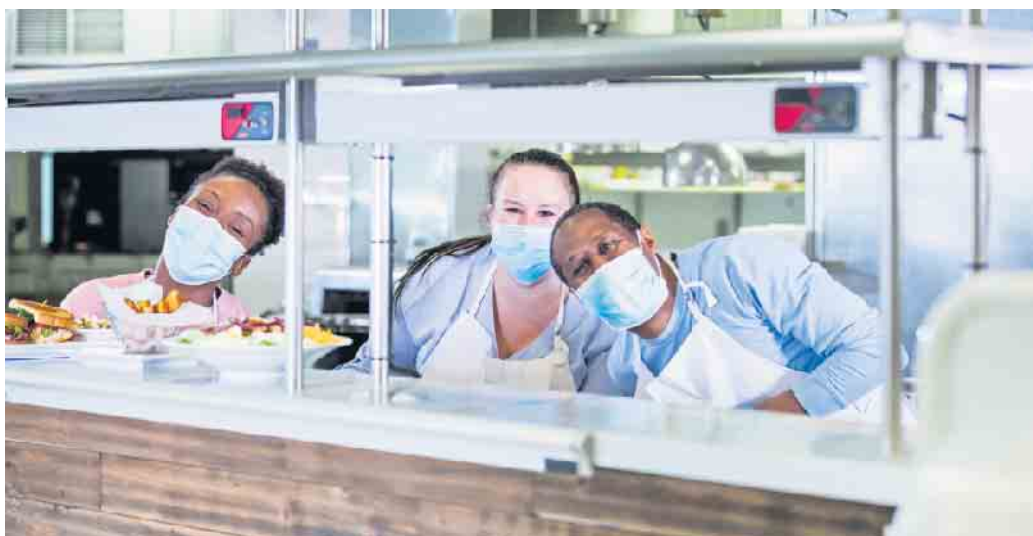
In der Systemgastronomie in Deutschland arbeiten Menschen aus rund 120 Nationen.