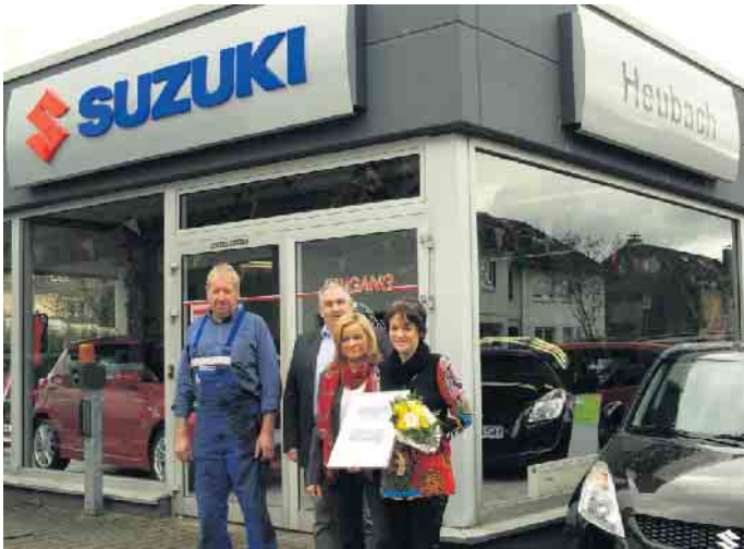
Auszeichnung von Suzuki im Jahr 2013.