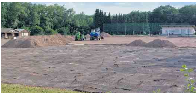
Neuer Aschenbelag für den Sportplatz in Altenherfen.

Alles Weitere rund um den SV Höhe zu finden unter www.svhoehe.de .