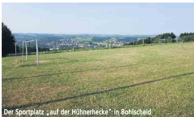
Der Sportplatz „auf der Hühnerhecke“ in Bohlscheid

ten ab Samstagmittag den Turniersieger in einer Endrunde ausgespielt haben gehen anschließend die Alt-Herren-Mannschaften ab 15.30 Uhr an den Start. Mit dabei sind „Genial Daneben“, „SV 09 Eitorf“, „Croatia Eitorf“ und „Flieger Herchen“. Zum Abschluss erwartet uns ab 19 Uhr ein Open-Air Konzert der Eitorfer Coverband „Clockwork“! Und das alles bei tollem Wetter, hervorragender Aussicht und natürlich freiem Eintritt! Wir freuen uns auf Sie bei kühlen Getränken und leckeren Speisen! Sportfreunde Bohlscheid.