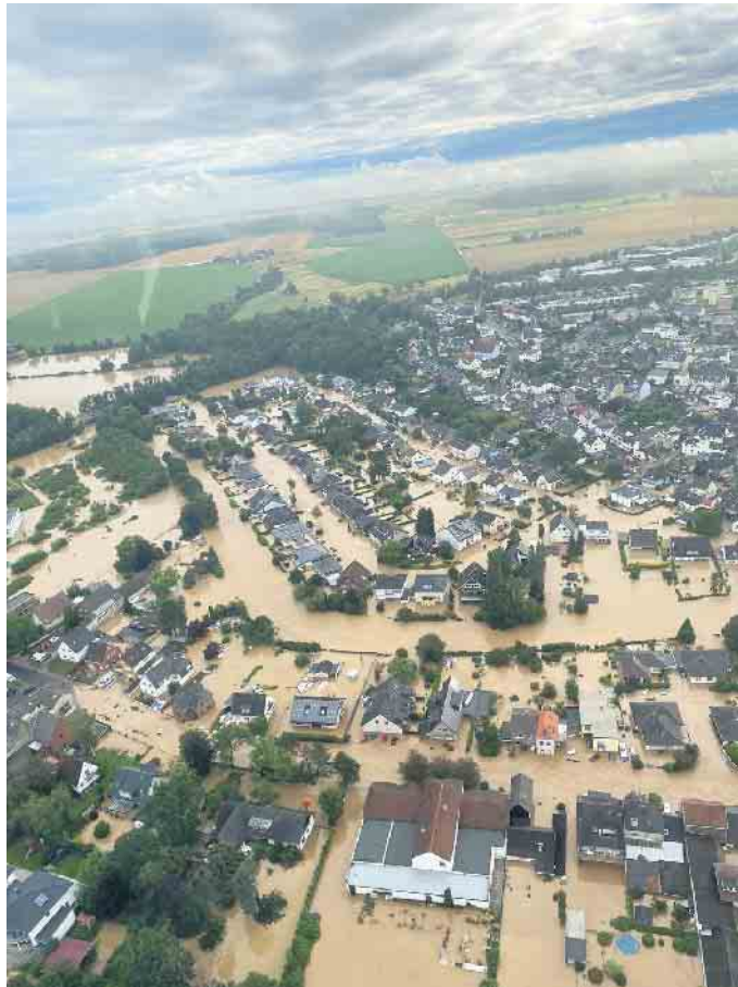
Flutgebiet in Swisttal-Heimerzheim.

„Jetzt gilt es, den Hochwasserschutz weiter voran zu treiben,