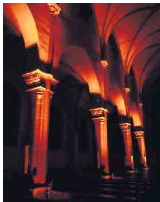
St. Patricius Evensong