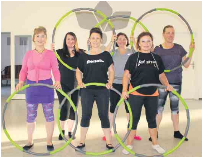
im Studio „TanzFit“

Nach den Sommerferien (ab 15. August) starten neue Kurse im Orientalischen Tanz sowie mehrere Tanzfitnesskurse. Orientalischer Tanz für Fortgeschrittene wird gewöhnlich dienstags um 19.45 Uhr angeboten, für Mittelstufe - donnerstags um 18.30 Uhr. Interessierte, die über entsprechende Tanzkenntnisse verfügen, sind in jeder Gruppe willkommen und können sich zur Probestunde anmelden. Für Anfängerinnen gibt es die Möglichkeit den Orientalischen Tanz entweder montags um 10.45 Uhr oder dienstags um 18.30 Uhr auszuprobieren. Hier ist die erste Stunde ebenso unverbindlich. Tanzfitness findet montags um 18.30 Uhr (für Frauen 60 Plus) und um 19.45 Uhr sowie don-