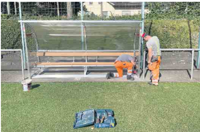
Mitarbeiter des Bauhof Eitorf bei der Montage der Spielerunterstände.

schuss bereits beschlossene Projekt, zu finden. Verlass war bei der Umsetzung auf das Team des Bauhofs Eitorf. Unter Berücksichtigung des Spielbetriebs auf der Sportanlage wurden die Fundamente erstellt und nach Anlieferung der Spielerunterstände zeitnah die Endmontage vor Ort vorgenommen. Jetzt steht sowohl in Eitorf, als auch in Mühleip kein Ersatzspieler mehr schutzlos im Regen. GSB Eitorf (Sto)