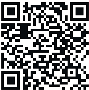
QR-Code Informationen zum Tagesordnungspunkt L 333 vom 01.07.2024

Die Räte der Stadt Hennef sowie der Gemeinden Eitorf und Windeck richten daher mit dieser Resolution den eindringlichen Appell