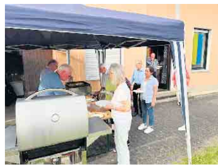
Am Grill führte vor dem Singen kein Weg vorbei.