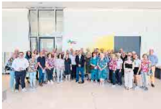
Fahrt nach Berlin