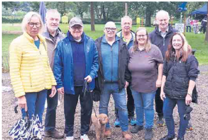
Die Delegation der Eitorfer CDU auf dem Gemeindesporttag 2024.