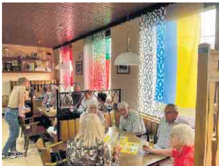
Das im EM-Style dekorierte Sängenheim mit seinen Gästen.