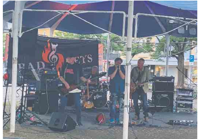
Die „Bad Keys“ rockten den Marktplatz

wir bedanken uns bei allen, die gekommen sind, bei der Band „Bad Keys“ für ihren grandiosen Auftritt und natürlich bei allen ehrenamtlichen Helferinnen und Helfer! Herzliche Grüße vom Förderverein der Feuerwehr