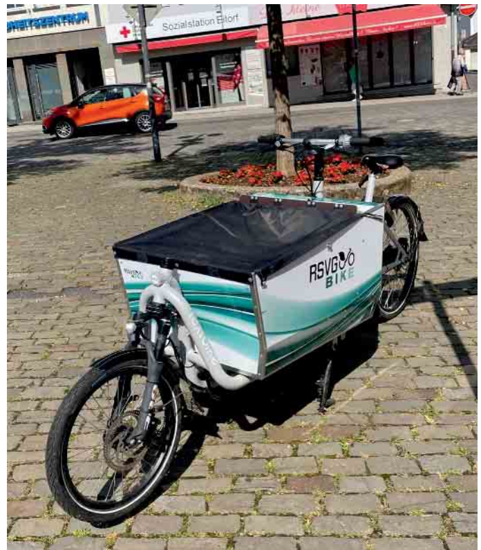
Das RSVG E-Lastenrad auf dem eitorfer Marktplatz.

Die ausführlichen Teilnahmebedingungen finden Sie auf unserer Internetseite unter www.eitorf.de/aktuelles/fotowettbewerb-e-lastenrad .