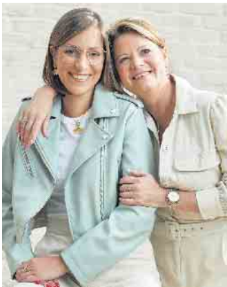
Als Schmuckstylistin sollte man gut mit Menschen umgehen kön-nen und Freude am Verkauf haben.

Rechnung. Für jedes verkaufte Schmuckstück erhält man daher eine Provision. Unter www.victoria-schmuck.de ist eine Infobroschüre zum kostenlosen Download bereitgestellt. Es ist möglich, eine Freiberuflichkeit in Vollzeit auszuüben oder auch als Nebenerwerb, als Zusatz zur bis-herigen Haupttätigkeit. Wichtig ist, dass man einem zukünftigen Auftraggeber niemals selbst Geld zahlt, um für ihn arbeiten zu dür-fen. Seriöse Unternehmen stat-ten ihre Stylistinnen mit allem aus, was sie für die Ausführung ihres Jobs benötigen. Zudem soll-te er eine gründliche Einarbei-tung garantieren. (DJD)