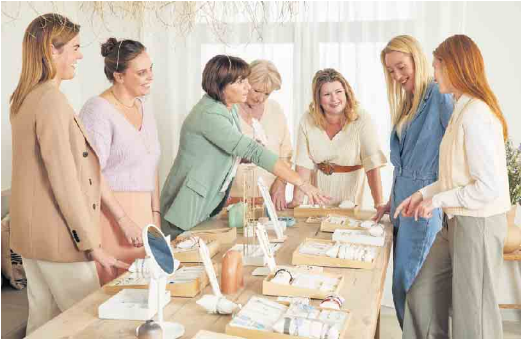
Gemeinsam mit Bekannten Schmuck auszuwählen und alles genau zu begutachten, macht Spaß und kann einen guten Verdienst einbringen.

Schmuckstylistinnen machen ihr Hobby zum Beruf