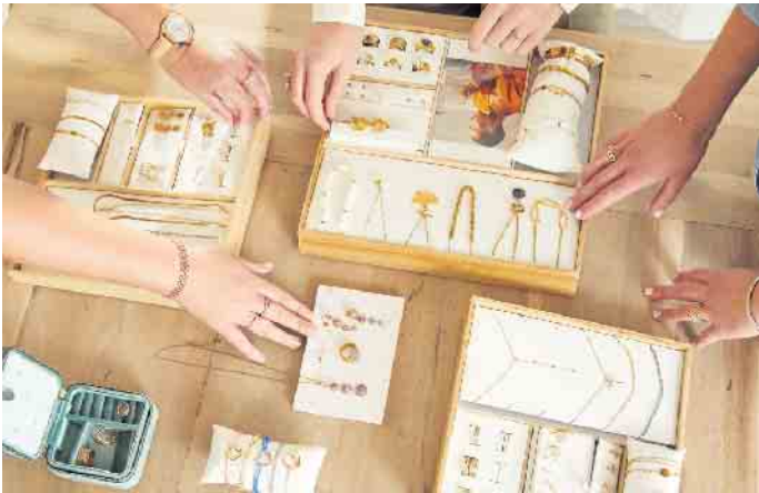
Die komplette Schmuckkollektion wird der Stylistin vom Auftraggeber kostenlos zur Verfügung gestellt.

Wir freuen uns auf Dich! Bitte Bewerbung telefonisch unter 02241 260-122 oder per E-Mail an: TEAM.VERSAND | i.rose@rautenberg.media Stichwort: TEAM VERSAND & PRODUKTION