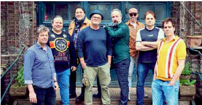
Die Musiker von Big Billa

Lässige funky Live-Musik, die über dem Zeitgeist steht! Tickets zum VVK-Preis von 16,- EUR gibt es im Kulturbüro der Gemeinde Eitorf, Markt 1, Rathaus und zum Preis von 18,- EUR an der Abendkasse. Tickets können auch per E-Mail ( thomas.feldkamp@eitorf.de ) oder telefonisch (02243/89-185) zum VVK-Preis vorbestellt und dann an der Abendkasse abgeholt und bezahlt werden.