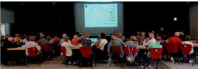
Zahlreiche Bürgerinnen und Bürger waren ins Leonardo gekommen