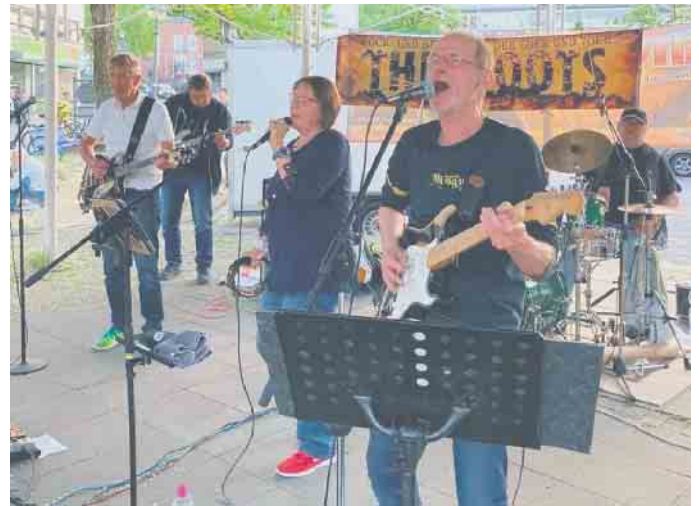
The Roots unter'm Pavillon am Markt

Aufgrund des Großbrandes am vergangenen Sonntag in Sankt Augustin, bei dem zwei Feuerwehrleute ums Leben gekommen und weitere verletzt worden sind,