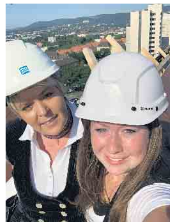
Klimaschutz, keine reine Männersache; es gibt auch Frauen im Dachdeckerhandwerk.

Beispiel lassen sich durch Kredite bei der KfW oder der Nutzung von Steuerermäßigungen für energetische Sanierungen auch im privaten Wohnungsbau deutliche Einspareffekte erzielen. „Dachdecker sind daher ganz wichtige Akteure, wenn es um das Erreichen der Klimaschutzziele geht, denn sie sind Spezialisten, die die notwendigen Sanierungsmaßnahmen im Gebäudebestand planen und durchführen“, erläutert Claudia Büttner, Pres-