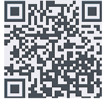
QR-Code Klimaschutzkonzept Eitorf

passiert. Natürlich soll es auch um die inhaltlichen Eckpunkte gehen, die Eitorf auf den Pfad der Klimaneutralität 2045 bringen sollen. Weiterhin besprechen wir, wo kommunale Handlungsspielräume liegen bzw. wo nur die Bürger selber aktiv werden können. Die Veranstaltung endet voraussichtlich um 20 Uhr. Wenn Sie teilnehmen möchten, können Sie den hier abgebildeten QR-Code scannen und gelangen direkt zum Meeting. Alternativ finden Sie den Link zum Meeting im Veranstaltungskalender der Gemeinde oder auf die-