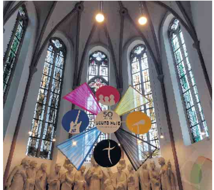
Dekoration in St. Patricius anl. 50 Jahre Young Hope