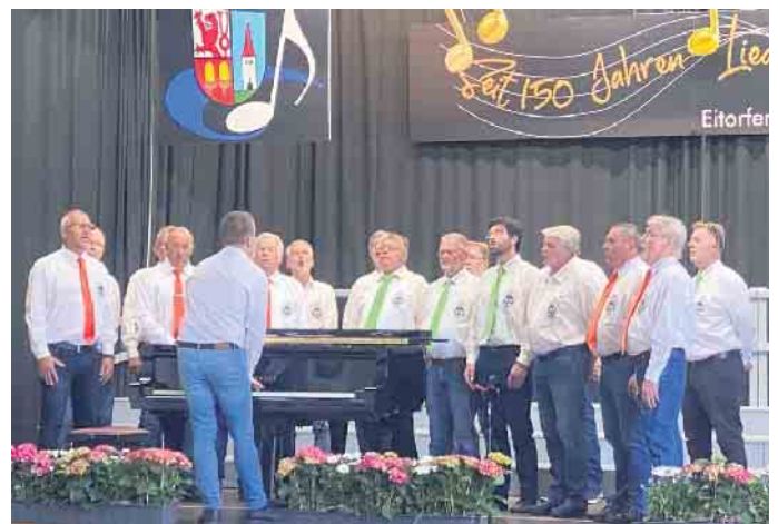
MGV Merten/Sieg e.V. beim Auftritt in Eitorf.

Rüdiger Gräf Schriftführer/ Pressewart www.mgv-merten-sieg.de