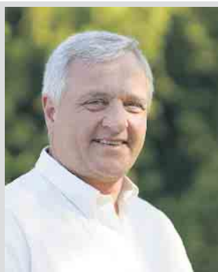
Bürgermeister Rainer Viehof