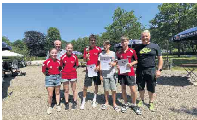
Sportlerehrung TT-Jungen 15 und Mädchen 15-Mannschaften der DJK Eitorf