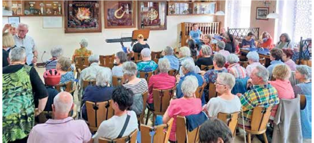
Bis auf den letzten Platz gefüllt, war der letzte Sommermitsingabend „Schlagerfeuer 2026“.

Beginn ist am 26. Juni, um 18 Uhr, im Eitorfer Sängerheim. Danach gibt