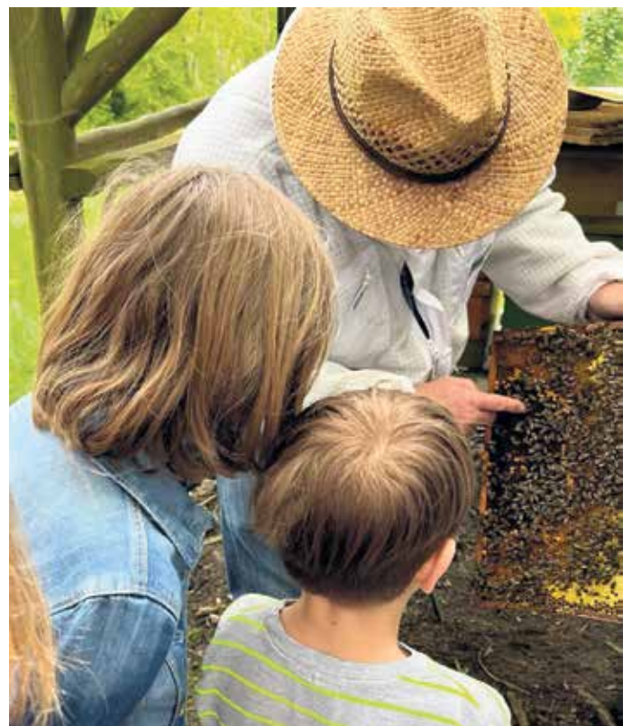
Imker zeigt Kindern eine Bienenwabe

Kurz unverbindlich anmelden & Platz sichern: telefonisch unter 02243 89153 oder per E-Mail an touristinfo@eitorf.de .