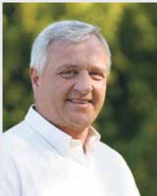
Bürgermeister Rainer Viehof