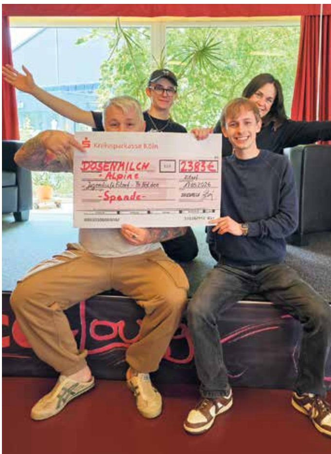
Das Team des Jugendcafés Eitorf

Das Jugendcafé sowie die Gemeinde Eitorf bedanken sich herzlich bei der Band, allen Spenderinnen und Spendern sowie Alpine Gehörschutz für die großzügige Unterstützung und das starke Engagement für die Jugendarbeit vor Ort.