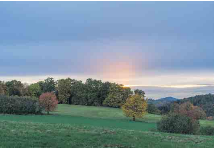
Abendstimmung Hüppelröttchen I