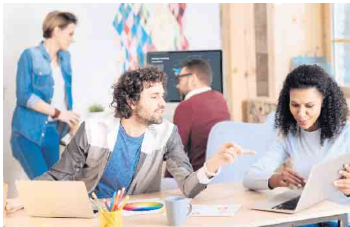
Bei einer Weiterbildung vertieft man sein Wissen in wichtigen beruflichen Themengebieten.

Teil aus Selbstlernphasen, die sich zeitlich flexibel in den Alltag integrieren lassen. Im Unterschied zu klassischen Fernlehrgängen findet zudem eine intensive Betreuung durch Tutorinnen und Tutoren in Foren und Online-Seminaren statt. Ergänzt wird dies durch Präsenzveranstaltungen vor Ort in Koblenz. Die Teilnehmenden erwerben wirtschaftsbezogene Qualifikationen aus den Bereichen Volks- und Betriebswirtschaft, Rechnungswesen, Recht und Steuern sowie Unternehmensführung. Dazu kommen handlungsspezifische Qualifikationen aus den Sparten Betriebsmanagement, Investition und Controlling, Logistik, Marketing und Vertrieb sowie Führung und Zusammenarbeit. Nach bestandener IHK-Prüfung können die Teilnehmenden sowohl betriebswirtschaftliche Sachverhalte und Problemstellungen eines