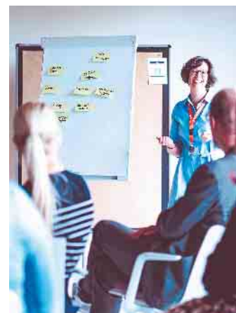
Die Weiterbildung besteht aus ortsunabhängigen Selbstlernphasen und Präsenzveranstaltungen vor Ort.

Während des 18-monatigen Fernlehrgangs sind rund sieben Stunden Lernzeit in der Woche vorgesehen. Wann und wo diese eingeplant werden, bestimmen die Lehrgangsteilnehmenden selbst. Damit ist das Format besonders interessant für Berufstätige, die in ihrem bisherigen Job stark eingebunden sind oder für diejenigen, die Karriere und Privatleben gut miteinander in Einklang bringen möchten. Unter www.ihk-akademie-koblenz.de können sich Interessierte über die Zulassungsvoraussetzungen und Förderungsmöglichkeiten informieren. (DJD)