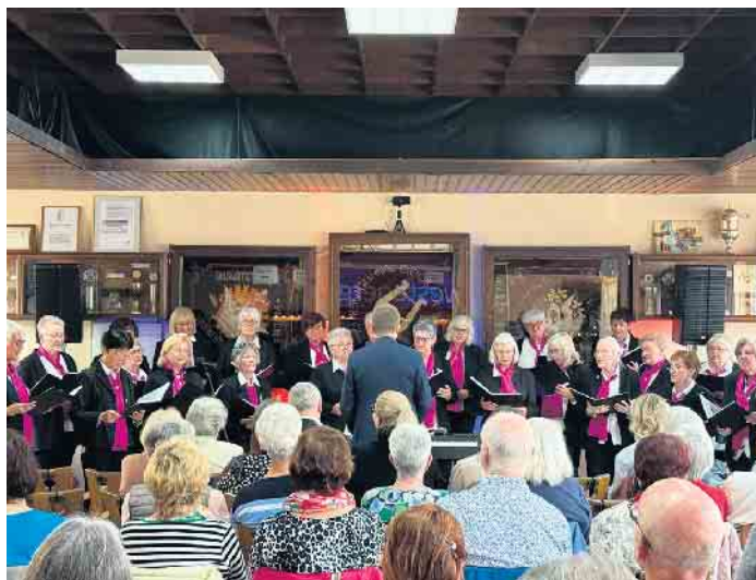
Die Frauen im EGV - 25 Jahre nach der Gründung.