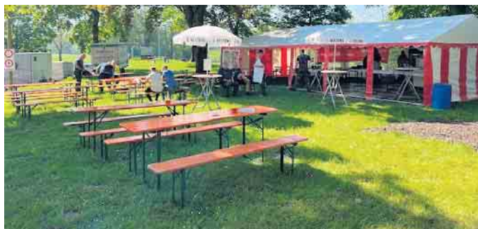
Gemütliches Ambiente an der Kelterser Brücke