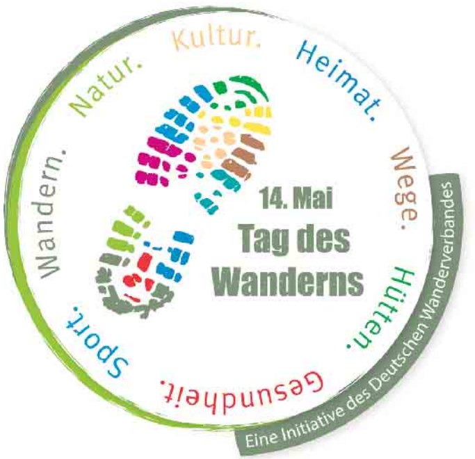
Logo Tag des Wanderns

Alle Teilnehmenden von Aktionen zum Tag des Wanderns am 14. Mai bekommen vom Deutschen Wanderverband (DWW) einen Pin mit dem bunten Logo zum Tag des Wanderns, eine Blumen-Samentüte, ein Gutscheineheft und weitere Überraschungen. Bundesweit laden zum Tag des Wanderns am 14. Mai Vereine, Umwelt-, Tourismus- und andere Organisationen sowie Unternehmen, Schulen, einzelne Wanderführer und sogar ganze Regionen zu Aktionen rund um das Thema Wandern ein. Initiiert hat den Tag des Wanderns vor sieben Jahren der Deutsche Wanderverband. Für dieses Jahr haben viele Organisationen schon tolle Veranstaltungen an den DWW gemeldet. Das Spektrum reicht von Naturschutz-Aktionen über Meditationswanderungen bis zu Kultur-Familienwanderungen. An diesem