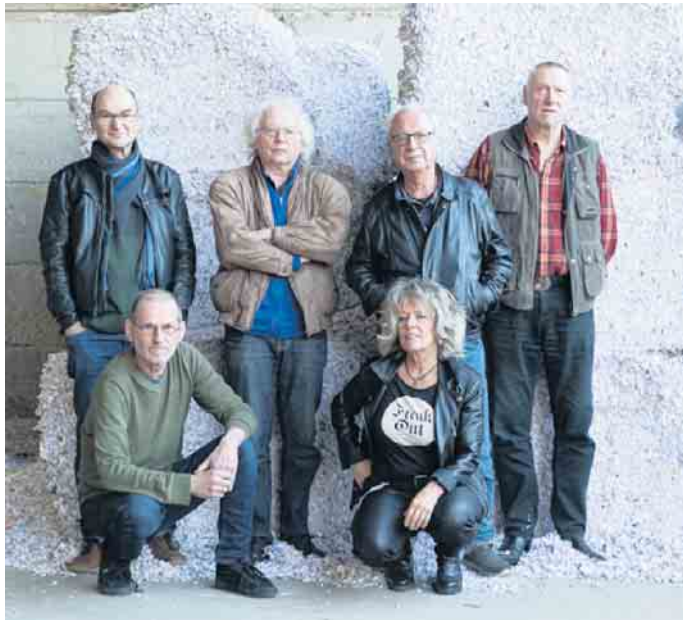
The Roots.