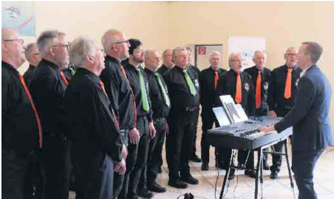
MGV Merten/Sieg e.V. beim Auftritt in Stoßdorf.

Am Sonntagmittag, 7. Mai, fuhren wir zum Freundschaftssingen unseres befreundeten Chores in Hennef-Stoßdorf. Im dortigen Bürgerhaus