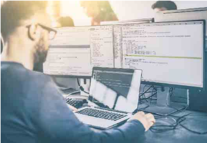
Cybercrime-Experten setzen sich vor allem mit dem technischen Vorgehen von Hackern auseinander.

Rund 300 IT-Forensiker und Sicherheitsexperten haben bereits ihren staatlichen Hochschulabschluss gemacht. Insbesondere für IT-Fachkräfte bietet das Fernstudium die Möglichkeit, sich neben dem Beruf praxisnah und wissenschaftsbasiert spezifisches Fachwissen anzueignen. Die angehenden IT-Sicherheitsexperten setzen sich vor allem mit dem technischen Vorgehen von Hackern auseinander: Dem Datendiebstahl von Smartphones und Tablets, dem Hacken persönlicher Profile in sozialen Netzwerken oder dem Lahmlegen von Rechnernetzen. Zusätzlich stehen kriminaltechnische, juristische und auch moralische Inhalte auf dem Lehrplan. (djd)