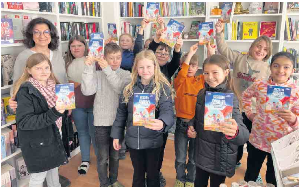
Welttag des Buches