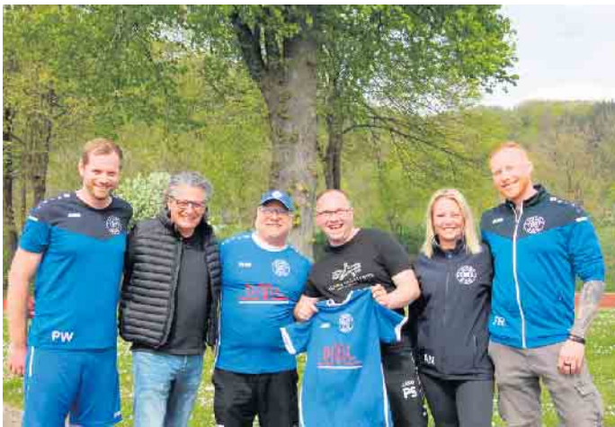
Der Vorstand und die neuen Trainer der 1. Mannschaft für die kommende Saison