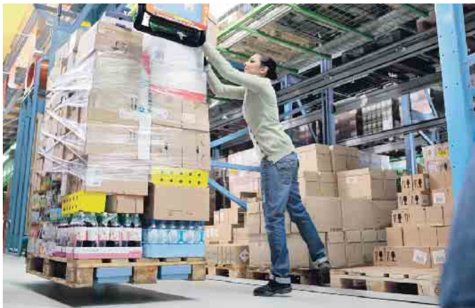
Erkrankungen des Muskel-Skelett-Systems machen den größten Anteil an den Arbeitsunfähigkeits-Tagen aus.

Umsetzung von Maßnahmen Die Möglichkeiten der Prävention von Muskel-Skelett-Erkrankungen sind vielfältig. Beratung und Schulungen gehören hier genauso dazu wie arbeitsplatzbezogene Maßnahmen. Dabei sollte deren Umsetzung nicht „von oben“ bestimmt werden. Eine Maßnahme wird in aller Regel von den Beschäftigten besser akzeptiert, wenn diese an der Verbesserung beteiligt werden und mitgestalten können. In vielen Fällen liegt eine Problemlösung auch bereits als Idee in den Köpfen der Beschäftigten vor. (akz-o)