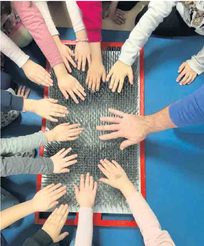
Das Nagelbrett hat die Kinder besonders fasziniert.

Dank der großzügigen Spende der CDU-Kleiderstube erlebten die Vorschulkinder der Kita Haus Kunterbunt eine einzigartige Zirkusprojektwoche. Über einen Zeitraum von einer Woche konnten sie täglich verschiedene Disziplinen ausprobieren und dabei nicht nur ihre eigenen Stärken entdecken, sondern auch mutig und neugierig neue und unbekannte Herausforderungen meistern, wie das Liegen auf einem Nagelbrett oder das Stehen auf Scherben mit nackten Füßen. Die Kinder haben auf eine Aufführung hingearbeitet, die zunächst vor den anderen Kindergartenkindern und dann auch vor den Eltern vorgestellt und mit viel Applaus belohnt wurde. Darunter fanden sich Tellerdreher, Clowns, Akrobaten und viele mehr. Ein Highlight waren die Zauberer, die Bonbons für alle Kinder gezaubert haben.