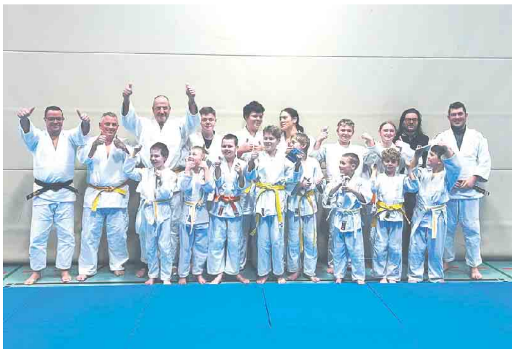
Prüflinge, Prüfer und Trainer