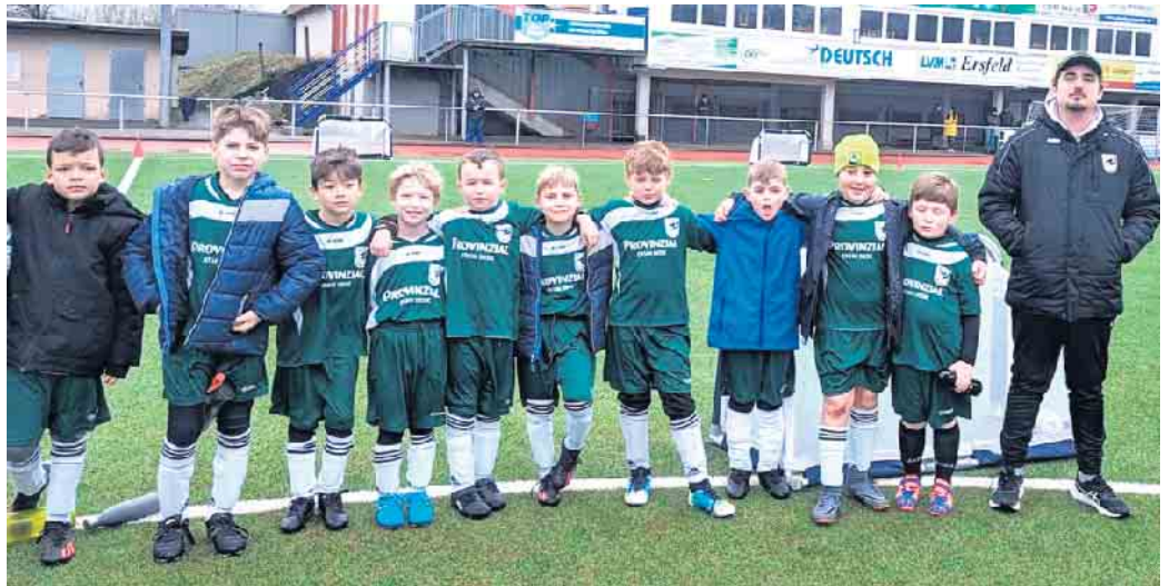
Unsere F-Jugend beim Spielefest in Eitorf

Einige schöne Spiele sorgten für gute Laune bei Spielern und Eltern. Es ist schön, die Fortschritte bei den Jungs zu beobachten.