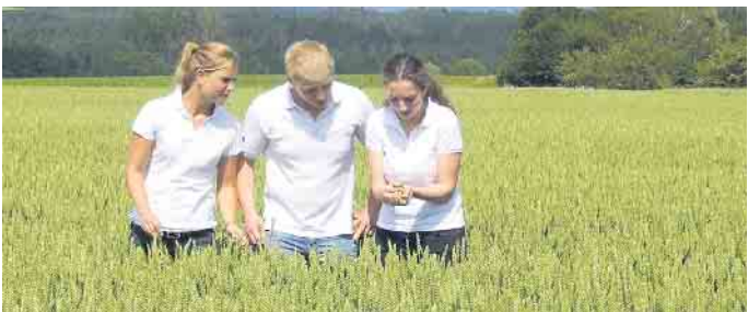
Genaue Kenntnisse über das Naturprodukt Getreide gehören zu den Grundlagen des Müllerberufs.

Wir freuen uns auf Dich! Bitte Bewerbung telefonisch unter 02241 260-122 oder per E-Mail an: TEAM.VERSAND | i.rose@rautenberg.media Stichwort: TEAM VERSAND & PRODUKTION