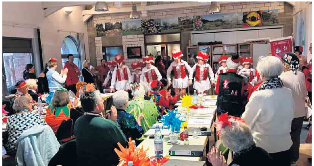
Auftritt der Junioren der Brückenwache Alzenbach

Auf vielfachen Wunsch wurde der Ausflug in die Krombacher Brau-