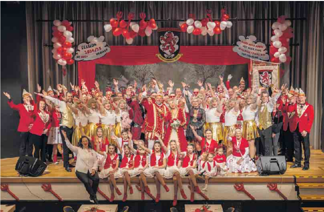
KG Rot-Weiss Herchen mit Prinzenpaar, Flamingos und SiegtalLöwen

Egal, ob Anfänger oder Fortgeschrittene, bei uns ist jeder herzlich