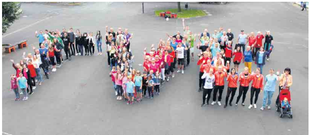
Gemeinsam aktiv: Die Mitglieder des Turnvereins 1894 Eitorf e.V. freuen sich auf neue Sportbegeisterte!

Der Februar ist da und viele von uns haben weiterhin den Wunsch, aktiver und sportlicher zu werden. Wer diese Vorsätze in die Tat umsetzen möchten, so ist der Turnverein 1894 Eitorf e.V. genau die richtige Anlaufstelle! Obwohl wir als „Turn“-Verein bekannt sind, bieten wir ein breites Spektrum an Fitness- und Ballsportkursen an. Unser Angebot reicht von Zirkeltraining über Aerobic und Nordic-Walking bis hin zu (Ski-)Gymnastik, Low Impact Workout und Hula Hoop. Egal ob Anfänger*in oder Fortgeschrittene*r, bei uns findet jeder das passende Training, um fit zu bleiben oder fit zu werden. Unsere Kurse finden regelmäßig statt und bieten eine tolle Möglichkeit, sich sportlich zu betätigen und dabei nette Menschen kennenzulernen. Wir legen großen Wert auf qualifizierte Trainer*innen, die mit Rat und Tat zur Seite stehen. Denn wir möchten, dass man sich bei uns wohl