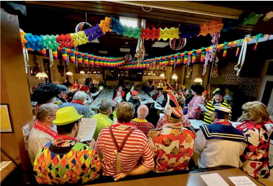
Die Sänger beim Auftritt