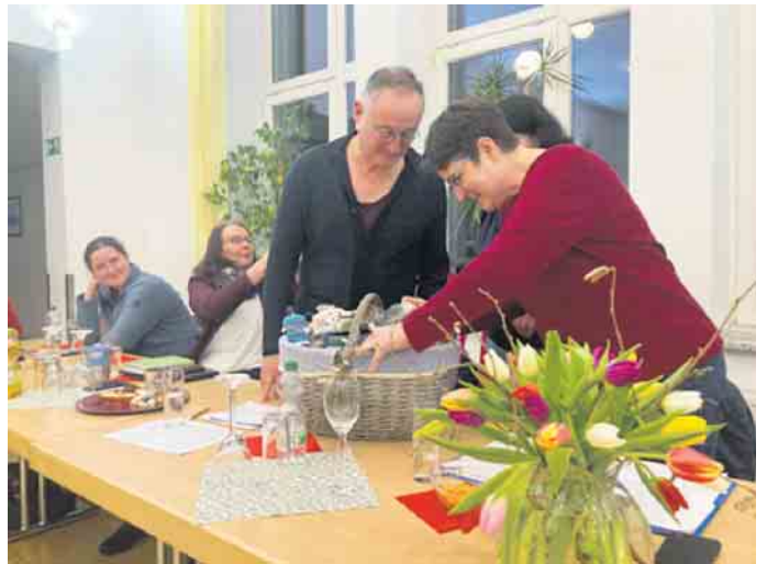
Überraschungskorb zum Geburtstag unseres Chorleiters