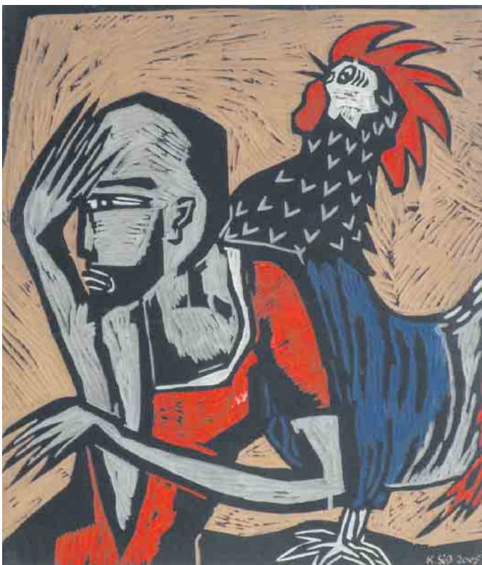
Verleugnung des Petrus.

Ausstellung „Kreuzweg“ von Klaus Süß und Führung mit Carmen Vetere