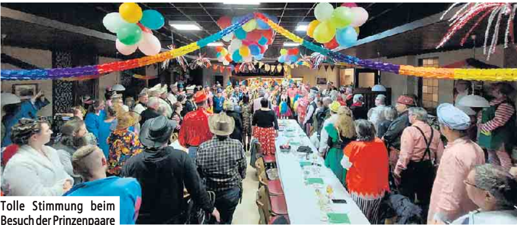
Tolle Stimmung beim Besuch der Prinzenpaare