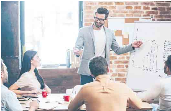
Körpersprache und Rhetorik haben die gleiche Bedeutung, erst die Kombination aus beidem verhilft zu nachhaltigem beruflichen Erfolg.