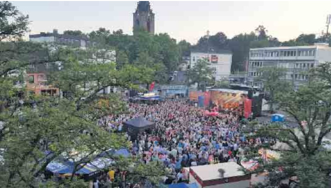
Impression: Feez om Maat 2018

Am 8. Juni ist es endlich wieder so weit: Es ist „Feez om Maat“-Zeit! Die Vereine Turm-Garde Karnevalsfreunde Eitorf und die KG Turm-Garde freuen sich, gemeinsam mit vielen feierfreudigen Besuchern, die größte Open-Air Sommerparty Eitorfs zu feiern. Unser Marktplatz wird auf kölsche Art gerockt durch etablierte Karnevalsgrößen, wie Druckluft, Funky Marys, Domstürmer und Klüngelköpp. Situationskomisch, schräg und immer mit