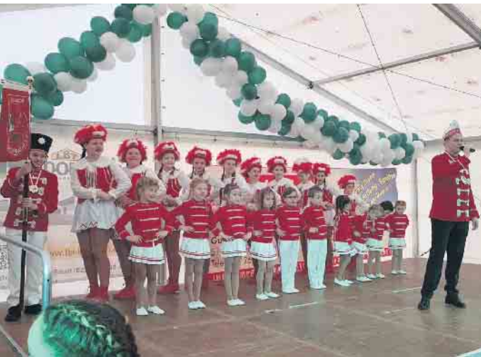
Die Pänz der KG Närrische Brückenwache zeigen ihre tollen Tänzen

Wir stecken mitten in der kurzen Session und die Tänzer*innen der KG Turm-Garde konnten bereits auf vielen Bühnen mit ihren Tänzen begeistern. Neben kleinen und großen emotionalen Highlights, die während, vor und nach Auftritten, auf Busfahrten, beim Training oder auch einfach so im Sessionsalltag zu erleben sind,