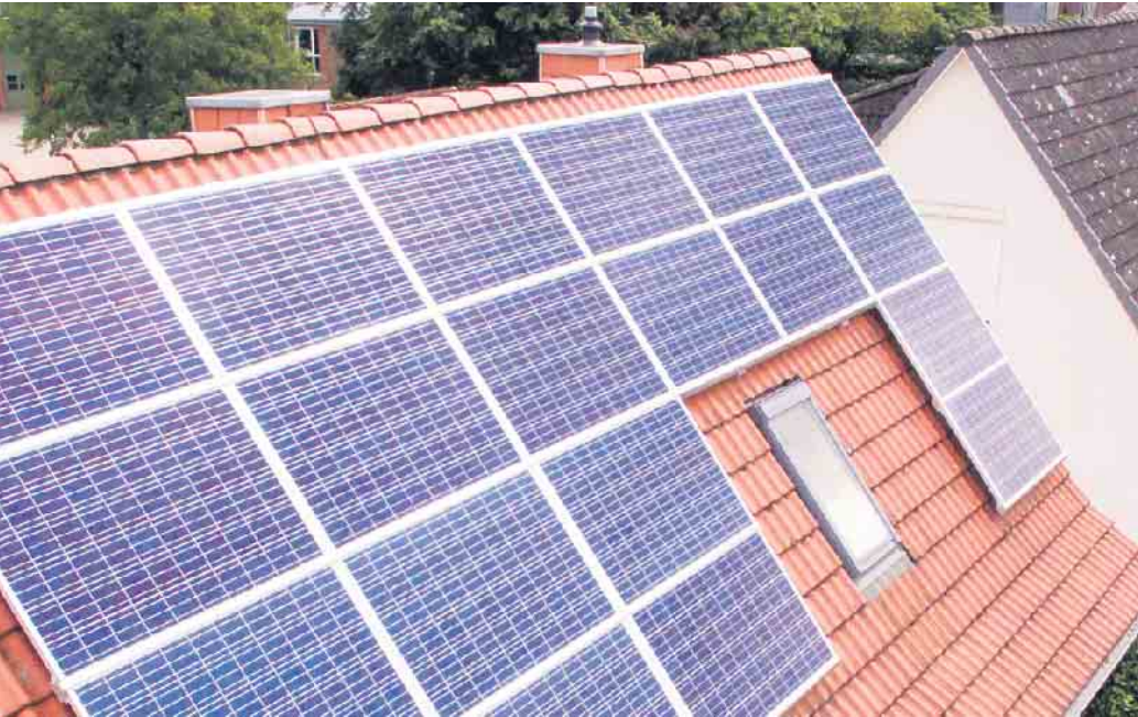
Vorausschauende Investitionen reduzieren auch die „2. Miete“

Ressourcen und Energie sind kostbar und auf unserem Planeten nicht mehr unbegrenzt verfügbar. Das sollten Bauherren auch beim Bau oder der Modernisierung ihres Hauses berücksichtigen. Die