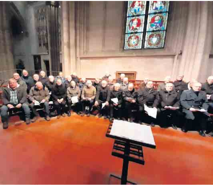
Projektchor auf der internationalen Soldatenmesse