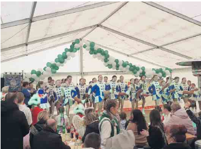
Der Nachwuchs der KG Närrische Stadtsoldaten begeistert das Publikum