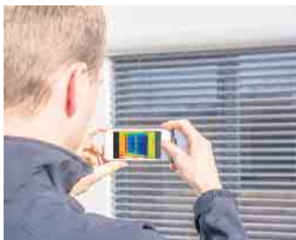
ROLF Fensterbau - Ihre Adresse für energieeffiziente Fenster und Türen aus Kunststoff.

Das neue Jahr beginnt mit eisigen Temperaturen. Gerade in der kalten Jahreszeit wollen wir es zuhause gerne warm haben. Viele stehen dabei vor dem Problem, sich zwischen wohliger Wärme durch Heizen oder ökonomischerem Energiesparen entscheiden zu müssen. Mit Hilfe von sinnvollem Wärmeschutz und der richtigen Dämmung bieten moderne Fenster und Türen aus Kunststoff die Lösung für langfristige Energieeffizienz und ersparen einem somit die Frage nach dem Entweder/Oder. Die Fachleute der ROLF Fensterbau GmbH wissen um die langfristigen und überzeugenden Vorteile von Wärmedämmgläsern und hochwertigen Dichtungen: „Mit der passenden Ausstattung werden nicht nur Umwelt und Geldbeutel geschont, sondern gleichzeitig auch der Wohnkomfort gesteigert“, erklärt Roland Bockshecker, Vertriebsleiter beim größten Fensterbauer im Rheinland. „Gerade Fenster und Türen sind oft eine große Schwachstelle, wenn es darum geht, die eigenen vier Wände warm zu halten. Moderne Kunststoff- oder Wärmeschutzfenster schaffen hier Abhilfe.“