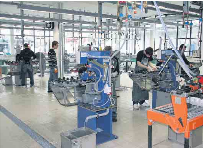
Ausbildung in der Flachglasindustrie.

für die Veredelung und für die Bedruckung von Glas. Dazu gehören auch der Umgang mit Computerprogrammen, die mit den für die Glasbearbeitung notwendigen Daten versorgt werden müssen und die Qualitätskontrolle. „Diese Ausbildung dauert ebenfalls in der Regel drei Jahre, findet auf duallem Wege im Betrieb und in der Berufsschule statt und setzt handwerkliches Geschick, eine gute Beobachtungsgabe, Teamfähigkeit und Sorgfalt voraus. Außerdem soll-