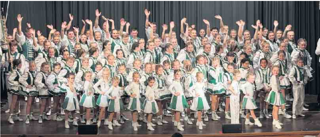
Unsere Tanzgruppen bei Family & Friends gemeinsam auf der Bühne

Ein ereignisreiches Jahr liegt hinter uns. Das vergangene Jahr war geprägt von zahlreichen Veranstaltungen und gemeinsamen Erlebnissen. Bereits im Januar durften wir ein gelungenes Kindergardetreffen erleben, das sowohl bei den kleinen