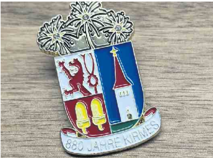
880 Jahre Eitorfer Kirmes

bisher nicht erwerben konnten, gibt es gute Nachrichten: Der Jubiläums-Anstecker ist zum Preis von 5 Euro im Kultur- und Tourismusbüro der Gemeinde erhältlich. Auch hier kommen die Einnahmen vollständig dem Förderverein zugute. Öffnungszeiten Kultur- und Tourismusbüro im Rathaus: Montag bis Freitag 8-12 Uhr sowie Donnerstag 14-17 Uhr