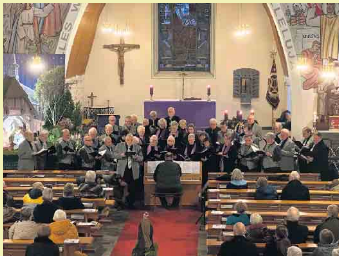
Beide Chöre in der Kirche in Alzenbach