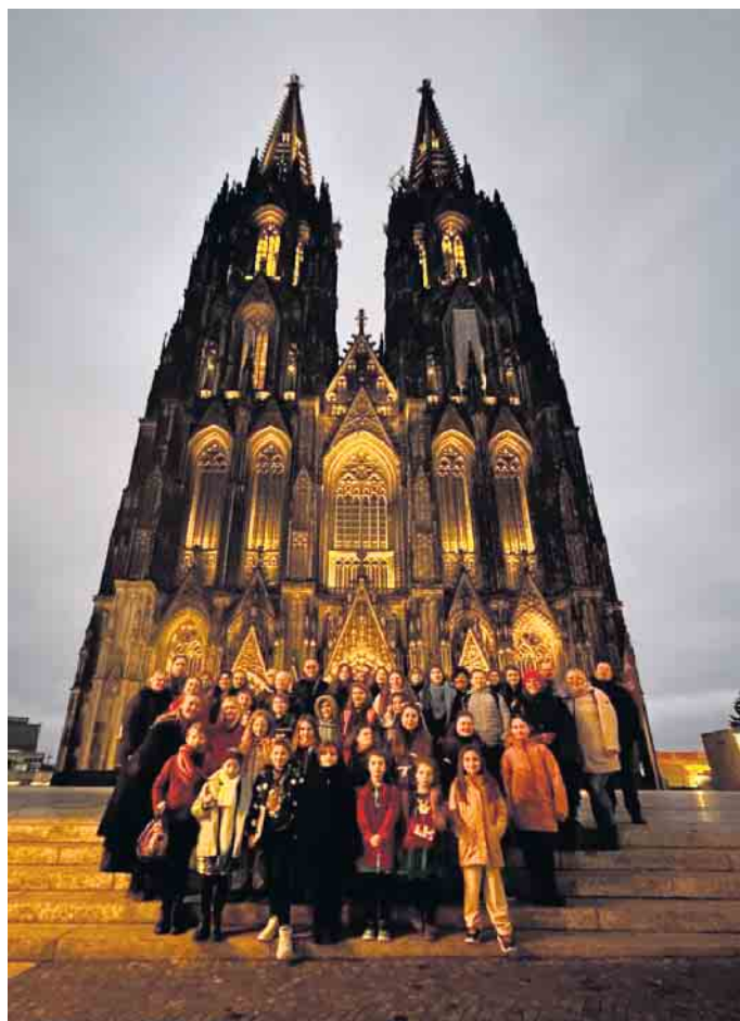
YH-Kids vor dem Kölner Dom

mit einer Mottoparty, die richtig viel Spaß machte. Dieses 3. Adventswochenende war aber vor allem für unsere Kids sehr bedeutend. Samstags ging es am Mittag nach Köln in die Verwaltung der DeutzAG zur Generalprobe. Dort bekamen die Kinder auch die Gelegenheit, das hauseigene Museum zu besuchen und somit den ersten OttoMotor überhaupt zu besichtigen. Am Sonntag hieß es dann früh aufstehen. Um 7 Uhr machten sich 40 Kinder und ihre Betreuer*innen auf den Weg zum Kölner Gürzenich. Dort wurden zwei Konzerte mit dem Deutz-Chor gesungen. Ein wirklich besonderes Erlebnis. Die Rückfahrt am Abend mit dem