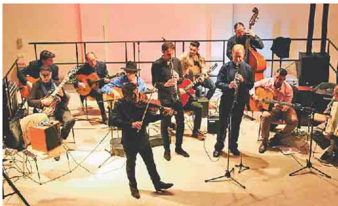
Zigeunernacht in der COMEDIA

Vorverkauf: 20 Euro, teilw. zuzügl. VV-Gebühren