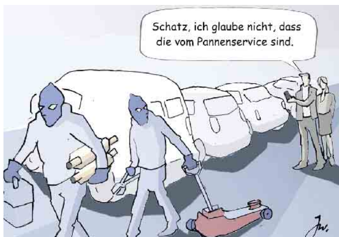
Polizei, Versicherer und Automobilclubs registrieren eine steigende Zahl von Katalysator-Diebstählen.

Wer über eine Kaskoversicherung verfügt, kann die Kosten, die durch Katalysatordiebe entstehen, bei seiner Versicherung geltend machen. Bleibt dann als Eigenbelastung gegebenenfalls nur die Selbstbeteiligung. Allerdings besteht bei älteren Fahrzeugen das Risiko, dass der Aufwand für den Ersatz des Kats den Wert des betroffenen Autos übersteigt. Dann kann sich der Besitzer mit einem Totalschaden konfrontiert sehen. (mid/ak-o)