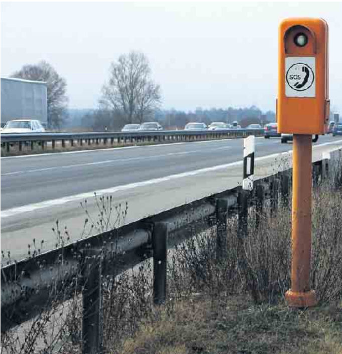
Alle zwei Kilometer steht eine Notrufsäule an der Autobahn. Ein Pfeil und eine Zahl auf den Leitpfosten geben Richtung und Abstand an.

rettenden Engel bestellen. Obwohl die meisten Menschen in Notfällen zum Handy greifen, laufen diese schon mal Gefahr, dass ihnen der Saft ausgeht - natürlich genau dann, wenn das Auto den Geist aufgibt. Von Funklöchern ganz zu schweigen. Die Zahlen belegen durchaus den Sinn der Säulen: Jährlich werden über diesen Weg immerhin circa 46.000 Notrufe abgesetzt, im Schnitt alle elf Minuten einer. Wer spricht? Seit 1999 landen die Anrufe beim Notruf der Autoversicherer in Hamburg und werden an den zuständigen Notdienst weitergeleitet. Im Gegensatz zum Anruf per Handy braucht man sich dabei keine malerische Beschreibung des Standorts zu überlegen: Dieser wird nämlich direkt an die Notrufzentrale übermittelt. Generell gilt: Bei Notfällen Ruhe bewahren! Stellen Sie das Warn-dreieck auf und schalten Sie die Warnblinkanlage ein. Vergessen Sie nicht, die Warnweste anzuziehen! Warten Sie nach dem Absetzen des Notrufs hinter der Leitplanke auf Hilfe. (mid/ak)