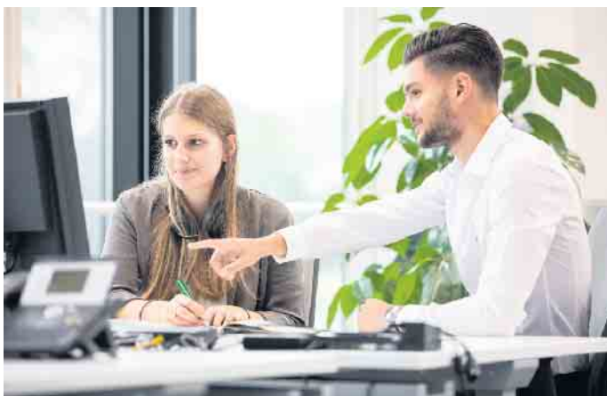
Die künftigen Vertriebstalente im Außendienst sind gefragt und die Entwicklungsperspektiven ausgezeichnet.