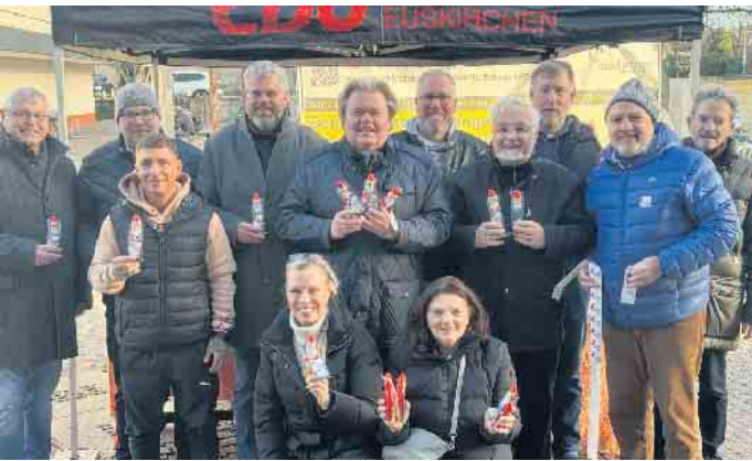
Der CDU Stadtverband Euskirchen wünschte am 3. Advent in der Innenstadt frohe Weihnachten.

Ende: Aus der Arbeit der Parteien CDU Euskirchen