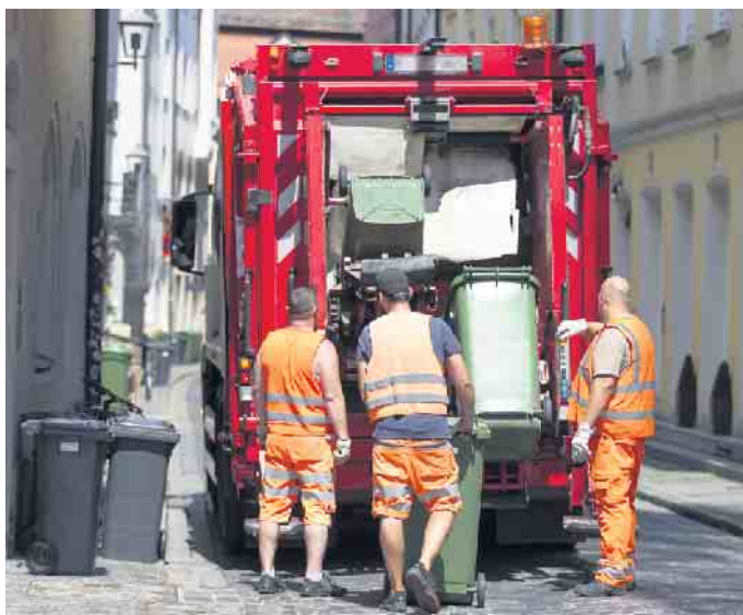
Jobrisiko Sonne: Beschäftigte in Außenberufen sind besonders gefährdet für hellen Hautkrebs.

Das sind alarmierende Zahlen, daher sollte man 365 Tage im Jahr an einen hohen Lichtschutzfaktor denken. Durch die permanente Sonneneinstrahlung haben vor allem Menschen in Außenberufen ein erhöhtes Risiko, an hellem Hautkrebs zu erkranken. Dazu gehören beispielsweise Landwirte, Dachdecker, Straßenarbeiter, Gärtner, Beschäftigte in der Müllabfuhr sowie viele Profisportler. Als wichtigste Maßnahme ist ein medizinischer Sonnenschutz angeraten, der über einen Lichtschutzfaktor der höchsten Kategorie (50+) sowie UV-A und UV-B-Filter verfügt - wie Actinica Lotion, die als Medizinprodukt mit klinischer Langzeitstudie nachweis-