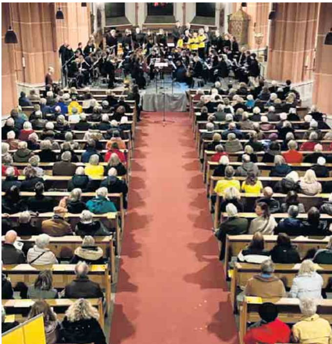
Berührten die Konzertbesucher in der Herz-Jesu Kirche: Junge Chormitglieder*innen inmitten des Rheinischen Bach-Consortiums sangen Teile des Weihnachtsoratoriums von J. S. Bach.

Casa befindet sich im Bau. Es ist für junge gefährdete Mädchen vorgesehen, die in etwa in dem Alter, ca. 10 bis 12 Jahre, sind, wie die jungen Mädchen, die gleich hier im Chor mitsingen werden“, kündigt der engagierte Mediziner einen besonderen Konzertteil an. Die jungen Sängerinnen beeindruckten gemeinsam mit dem Orchester im Choral der Kantate I des Weihnachtsoratoriums und sorgten bei vielen Zuhörern für glänzende Augen. Die Sanges- und Spielfreude war allen Mitwirkenden anzumerken und die begeisterten Konzertbesucher bedankten sich bei den Musikern mit langanhaltenden stehenden Ovationen.