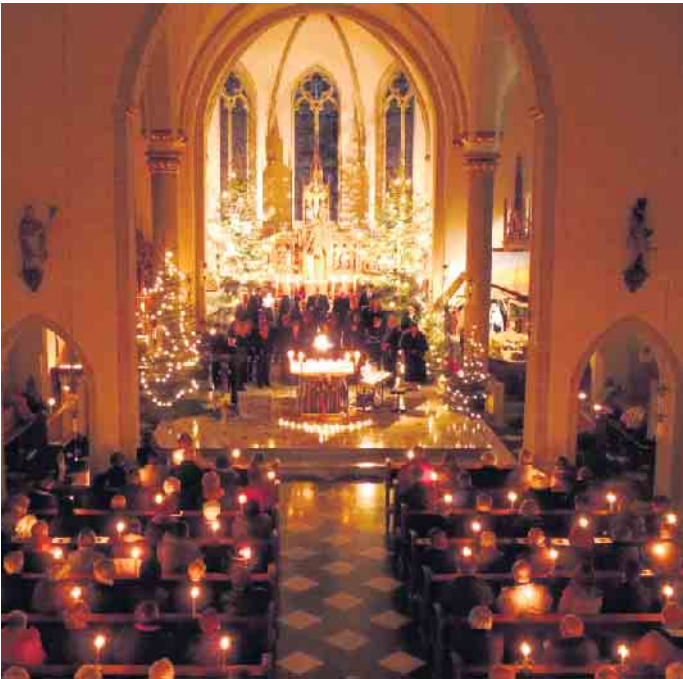
Foto: Volker Prinz/Kirchenmusik im Seelsorgebereich Euskirchen/Erftmühlenbach/pp/Agentur ProfiPress

kirchen unter anderem am Piano, per Orgel und Flötenmusik. Die Gesamtleitung hat der Dirigent und Organist Volker Prinz. Dieser betont: „Hier ist jeder herzlich eingeladen, der Eintritt ist frei(willig)!“ Prinz ist Seelsorgebereichsmusiker des veranstaltenden Vereins „Kirchenmusik im Seelsorgebereich Euskirchen/Erftmühlenbach“. pp/Agentur ProfiPress