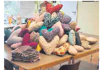
Diese Kissen helfen Brustkrebspatientinnen, den Druck von der OP-Narbe zu nehmen.

weit vorzubereitet, dass sie nur noch gefüllt werden müssen. Und wer wollte, konnte noch der Einladung der Museumsleiterin folgen und an einer Führung durch das Museum teilnehmen. Ein gelungener Tag für eine Herzensangelegenheit und ein tolles Ergebnis, da waren sich Organisatoren, Museumsleitung und Teilnehmer einig. Eine Wiederholung im kommenden Jahr ist angedacht.