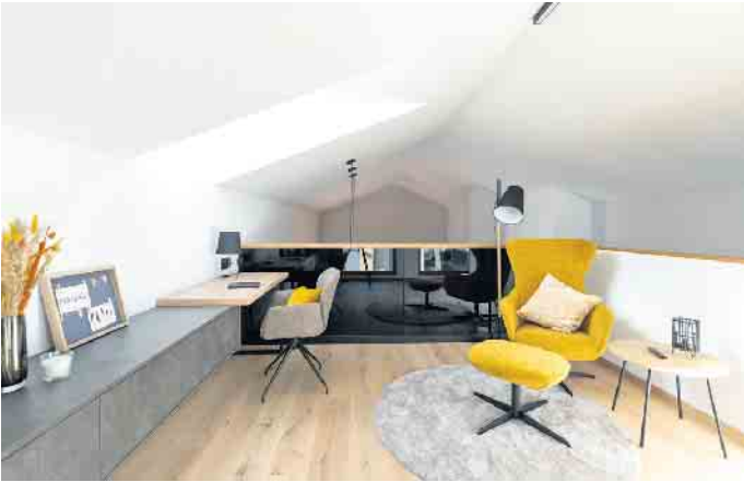
Ein multifunktionaler Arbeits- und Rückzugsort bietet sich etwa auf einer Galerie über dem offenen Küchen-, Ess- und Wohnbereich.

oder ein integrierter Arbeitsplatz. Für eine großzügige optische Wirkung ist der Übergang zwischen Innen- und Außenbereich entscheidend. Hannott ergänzt: „Gute Planung bedeutet, bereits bei der Grundrissgestaltung zu überlegen, wie Bewohner heute und in Zukunft leben wollen; wo sie sich begegnen, aber auch mal zurückziehen können.“