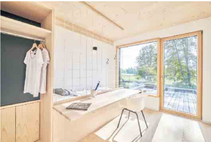
Offene Grundrisse und viel Tageslicht lassen auch kleine Wohnflächen großzügig wirken - funktional geplant entsteht hoher Komfort auf kompaktem Raum.

Ästhetik, Komfort und Lebensqualität Auf kleiner Fläche lässt sich hoher Wohnkomfort und ansprechendes Design verwirklichen. Mit modernen Fensterlösungen und hochwertigen Materialien stehen kleine Häuser den großen Varianten in nichts nach. Große Verglasungen bringen Licht ins Innere und schaffen Ausblicke. Die fle-