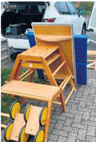
Das Inventar wartet, geladen zu werden.

neuen Räume gebracht, wo bereits Eltern, Großeltern und Mitarbeiterinnen der Kita fleißig malerten, spachtelten und vorbereiteten. „Das war echte Teamarbeit - alle packten mit an, egal ob beim Tragen, Streichen oder Verpflegen“, berichtet Vereinsleiter Volker