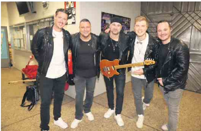
Das Highlight der Sitzung war zweifelsohne, neben den Domstürmern der Auftritt von „Eldorado“.