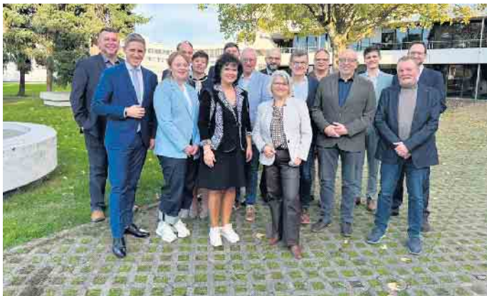
Foto mit Landrat: Die neue SPD-Fraktion im Kreistag Euskirchen vor der ersten Sitzung des Kreistages am 05.11.2025.