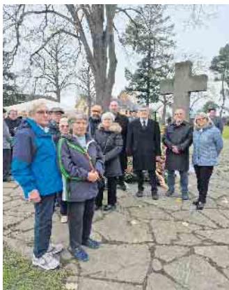
SPD-Vertreter bei der zentralen Gedenkfeier zum Volkstrauertag 2025 in Euskirchen.

es eine Aufgabe der Gegenwart, diese Geschichten nicht zu verges- sen und ihre Bedeutung für eine demokratische und offene Gesell- schaft wachzuhalten. Die SPD Euskirchen betont, dass der Volkstrauertag nicht nur eine historische Erinnerung ist, son- dern ein Auftrag für heute. Ge- denken bedeutet, Verantwortung ernst zu nehmen, Hass und Aus- grenzung entgegenzutreten und das Miteinander zu stärken. Mensch sein beginnt im Kleinen und im Alltag. Genau daran hat dieser Volkstrauertag in Euskir- chen erinnert. www.spd-euskirchen.de Michael Höllmann