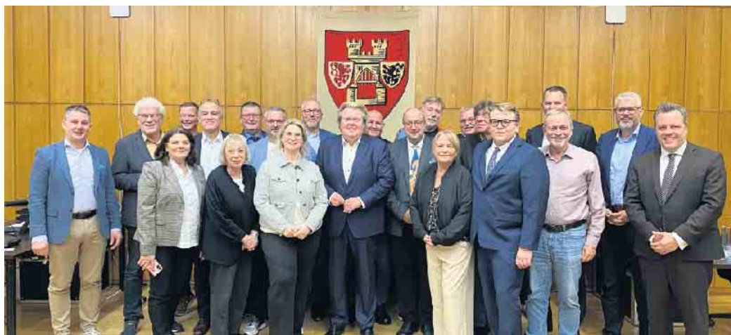
Die neugewählte CDU-Stadtratsfraktion.

Daneben war auch über die Vergabe der Ausschüsse abzustimmen. Hier bekam die CDU-Stadtratsfraktion den Zugriff auf drei von sechs möglichen Ausschüssen. So wird der Ausschuss für Umwelt und Planung, der Ausschuss für Tiefbau und Verkehr und der Ausschuss für Kultur, Frei-