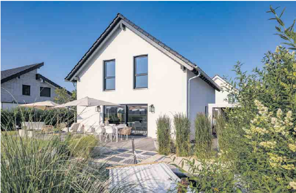
Holz im Innenraum reguliert den Feuchtehaushalt und sorgt für ein angenehmes Raumklima, dass das Wohlbefinden fördert.

Holzfertighäuser schaffen ein angenehmes Raumklima. Holz reguliert Feuchtigkeit und sorgt für eine warme, gemütliche Atmosphäre. Die verwendeten Holzelemente kommen ohne chemische Zusatzstoffe aus und fördern saubere Raumluft. „Die angenehme