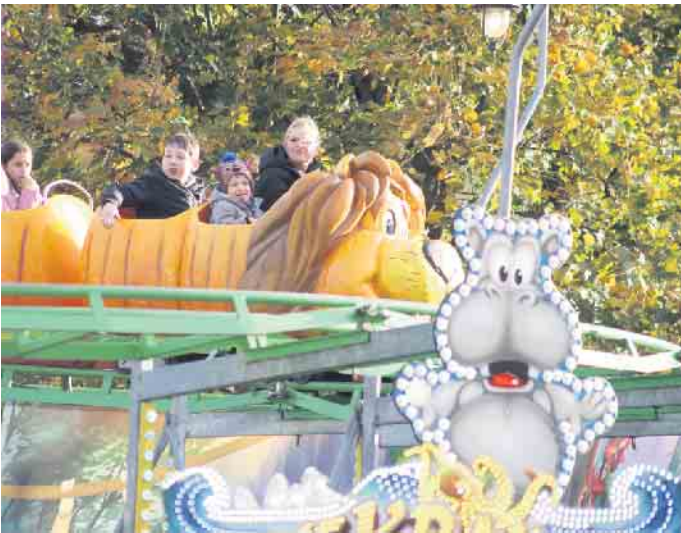
Auf dem Charleviller Platz ließ die Kinderachterbahn „Crazy Jungle“ Kinderaugen leuchten