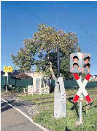
Roitzheim erhält einen Haltepunkt auf der Strecke der Erftalbahn

Ende: Aus der Arbeit der Parteien Bündnis 90 / Die Grünen Euskirchen