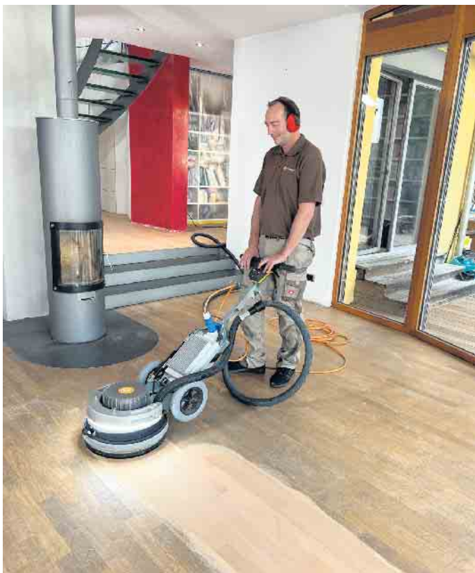
Nach einem Abschliff glänzt Parkett wieder wie neu. So kann es viele Jahrzehnte verwendet werden.

Um Kratzer auf dem Parkett zu vermeiden, sollten Tische und Stühle, Sessel und Sofas Filzgleiter erhalten. So lassen sie sich verrücken, ohne dass der Holzboden Schaden nimmt. Entsteht doch einmal eine Delle oder ein Kratzer, sollte diese Stelle repariert werden - nicht nur um die Optik zu bewahren, sondern auch um das Holz zu schützen. Stärker beanspruchte Laufwege brauchen trotz guter Pflege irgendwann eine Aufarbeitung. Bei geöltem Holz reicht eine partielle Auffrischung, bei lackiertem Holz muss die gesamte Fläche geschliffen und neu versiegelt werden. So ist der Lieblingsboden immer noch schön, wenn die Einrichtung längst ausgetauscht wurde. Verband der Deutschen Parkettindustrie e.V. (vdv)