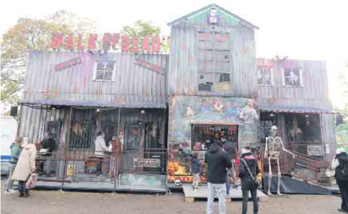
Weiterhin konnten sich die Festplatzbesucher im Laufgeschäft „Walk of Dead“ gruseln