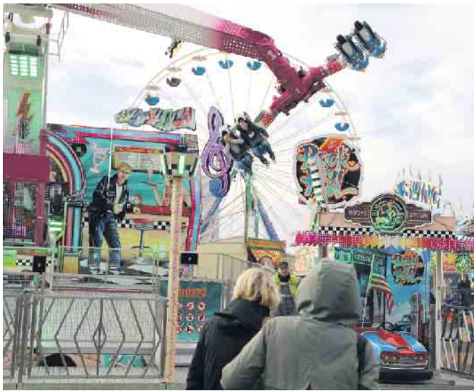
Highlights waren zweifelsohne das Fahrgeschäft „Rock’n’Roll“ sowie das „Riesenrad“

ihr Laufgeschäft sehr gut angenommen. In Empfang genommen von Frankenstein persönlich ging es im Inneren vorbei an Figuren wie „Michael Myers“ sowie anderen Horrorclowns. Wie Familie von Strünc verriet, laufen einige Gäste panisch durch den Parcours, aber generell benötigt man für einen Besuch in ihrem „Walk of Dead“ rund zwei Minuten. Der Simon-Juda-Markt war eine Mischung aus Kirmes und Krammarkt, bot Abwechslung aus rasanten Fahrgeschäften, typischen Volksfestspezialitäten und Verkaufsständen, die zum Bummeln und Verweilen einluden, und zählt damit zu den größten linksrheinischen Innenstadtkirmessen. Für Tanz und Stimmung war wieder gesorgt. Auf dem Charleviller Platz öffnete wieder ein Festzelt seine Türen. Die mobile Wache der Polizei und die Erste-Hilfe-Station des Deutschen Roten Kreuzes waren in der Bergerstraße Ecke Carmanstraße vertreten. Die Ordnungsbehörde und die Polizei waren sehr auf dem Kirmesgelände präsent. Auf den großen Plätzen waren permanent Mitarbeiter der Ordnungsbehörde präsent. FH