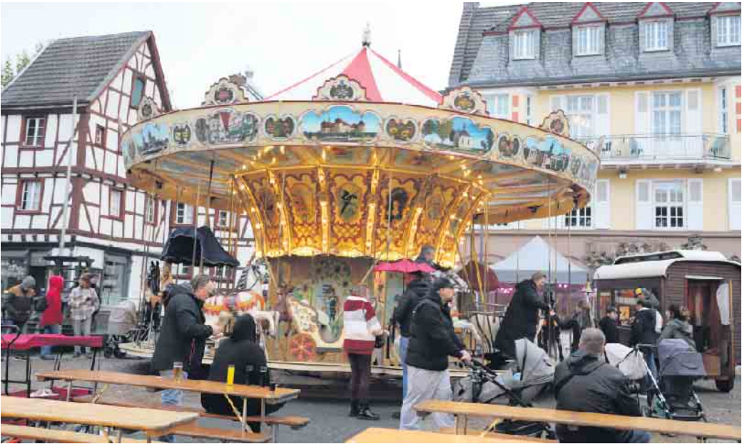
Das Kirmesabenteuer startete traditionell auf dem Alten Markt mit dem „Historischen Pferdekarsussell“