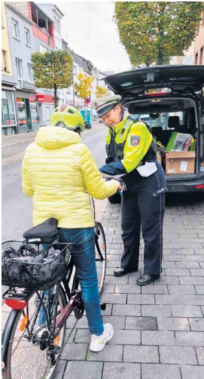
Positive Bilanz der Aktion „Sichtbarkeit in der dunklen Jahreszeit“

Mit Beginn der dunklen Jahreszeit führte die Polizei Euskirchen eine Verkehrssicherheitsaktion unter dem Motto „Sichtbarkeit in der dunklen Jahreszeit“ durch. Ziel war es, auf die Bedeutung von guter Beleuchtung und reflektierender Kleidung im Straßenverkehr aufmerksam zu machen und insbesondere Radfahrende und Nutzer von Pedelecs und E-Scootern zu sensibilisieren.