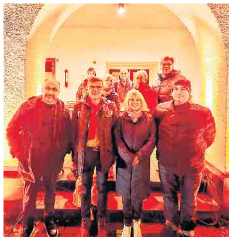
SPD-Vertreter beim Orange-Day dem internationalen Tag gegen Gewalt an Frauen: „Wer Frauen stärkt, stärkt die ganze Stadt“