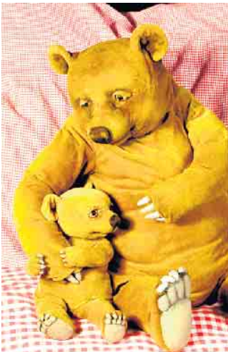
Der kleine Bär kann nicht einschlafen.

geduld“ zulegen wollen. Tickets gibt es an der Tageskasse, Kartenzahlung ist nicht möglich. Es wird empfohlen, unter 02257-4414 oder unter kulturhaus@theater-1.de zu reservieren. Reservierungswünsche, die erst am Tag der Veranstaltung eingehen, können möglicherweise nicht mehr berücksichtigt werden.