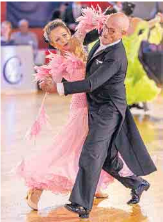
Das muss man in Bewegung sehen.

Ende: Aus der Arbeit der Parteien Bündnis 90 / Die Grünen Euskirchen