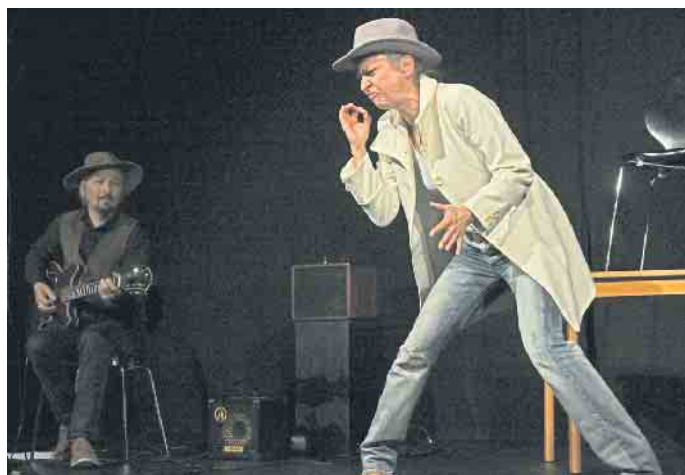
Voller Körpereinsatz mit Gitarrenbegleitung