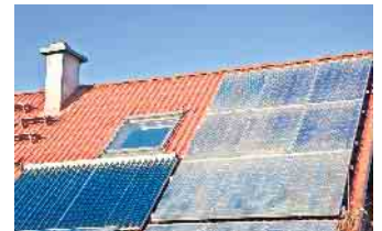
Die Kraft der Sonne ausnutzen - Kosten senken und das Klima schützen.

Mietende erfahren, wie sie mit einer Stecker-Solar-Anlage, dem „Balkonkraftwerk“ einen Teil ih-