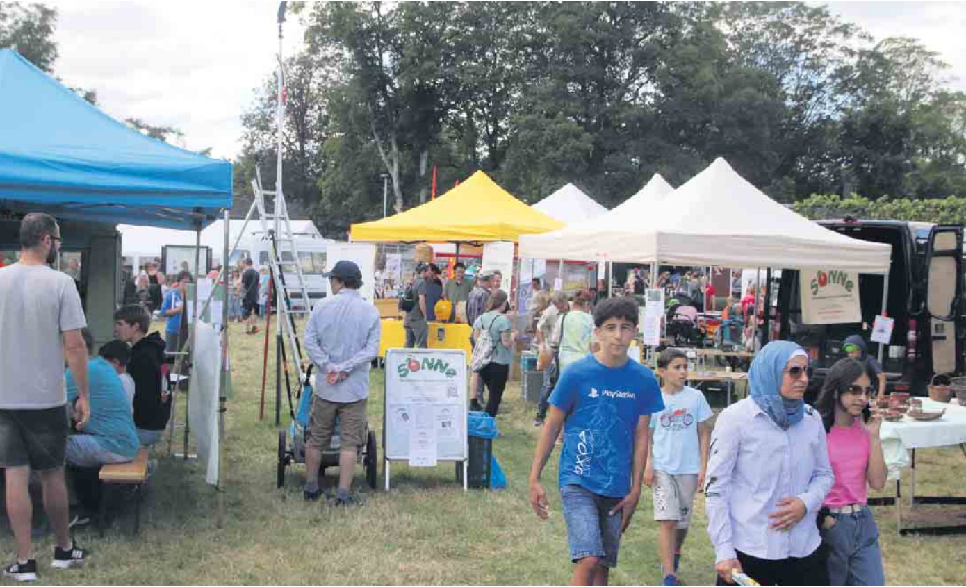
Beim Treff Natur gibt es viele Stände zu erkunden. Das Motto in diesem Jahr lautet „Bewege dich in der Natur“.

Bewegung, Abenteuer und jede Menge Naturspaß. Unter dem Motto „Bewege dich in der Na-