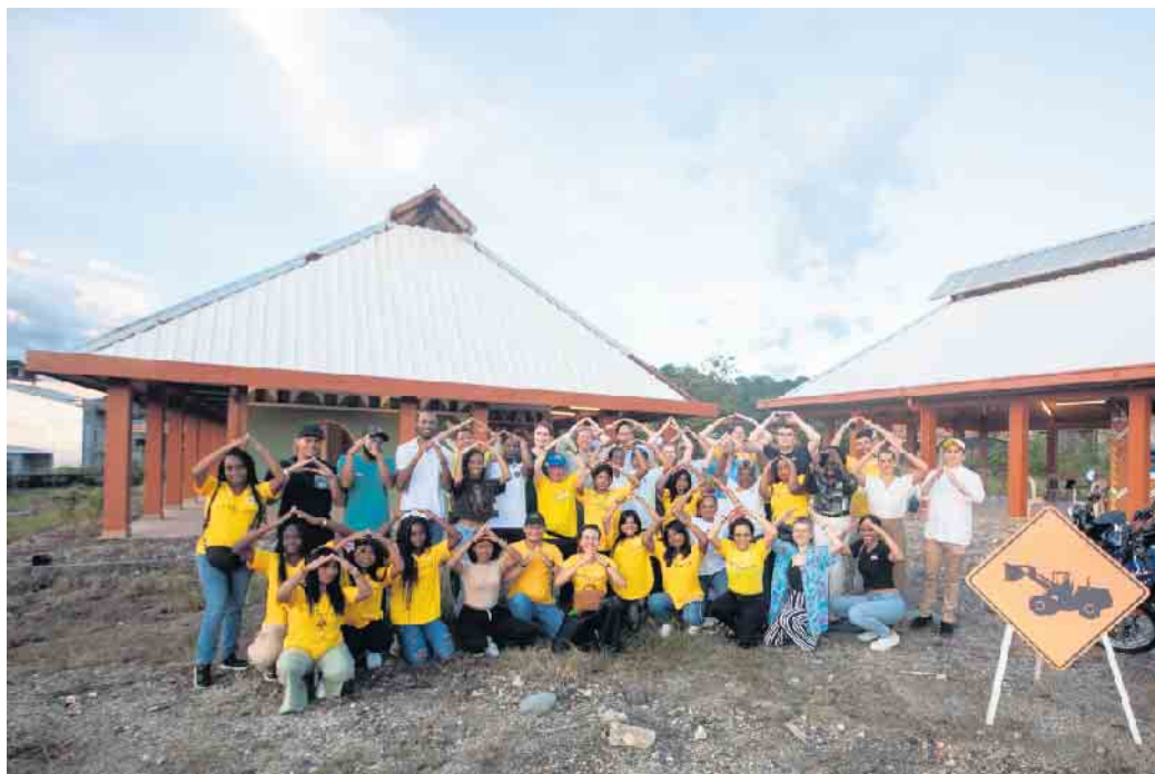
Frauen und Mädchen mit Mitarbeitenden von Casa Hogar sowie Projektpartnern auf der Baustelle ihres neuen Wohnheims in Chocó.

Mit einer feierlichen Zeremonie im Kongress der Republik Kolum-