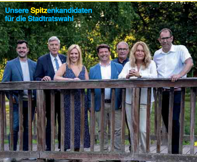
Unsere Spitzenkandidaten für die Stadtratswahl