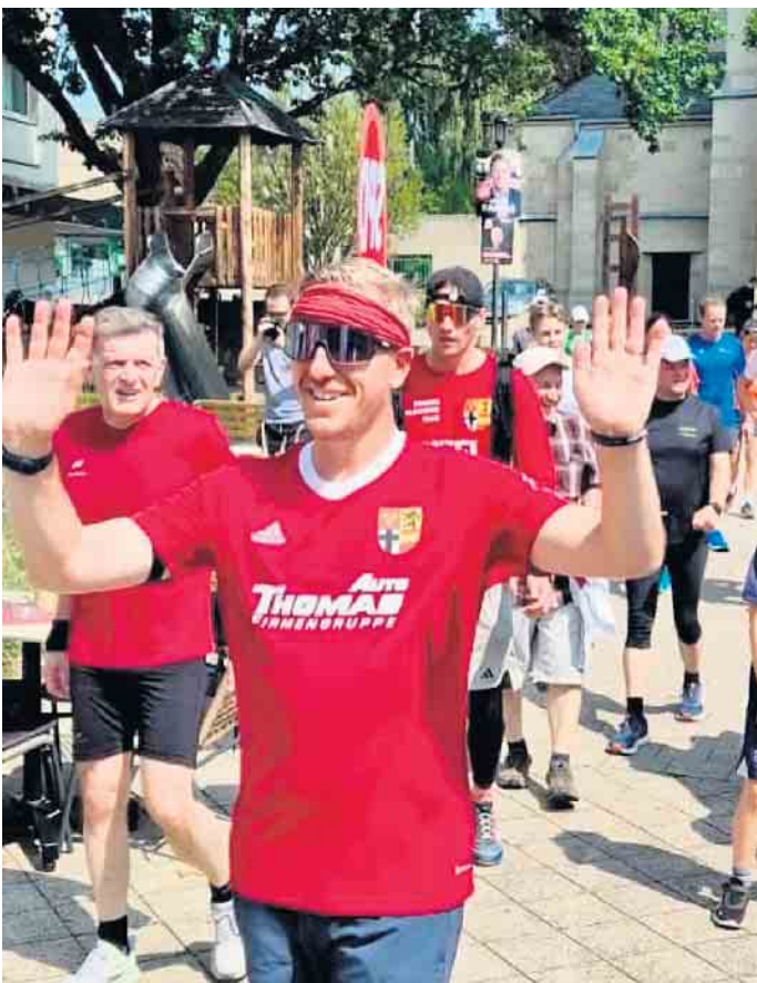
Am Ziel: Nach 7 Tagen und 200 km - Landrat Markus Ramers (SPD) beim Zieleinlauf in Euskirchen. Respekt für diese beeindruckende

Diese Tour war weit mehr als sportliches Engagement. Es war ein Statement für Präsenz, Dialog und Zusammenhalt: Der Landrat wollte seine Amtszeit sichtbar mit der Bevölkerung verbinden - von der Eifel bis zur Kreisstadt. Dementsprechend bunt war das Programm: Begegnungen mit Vereinen, Projekten, jungen und älteren Bürger*innen, spontane Gespräche und bestärkende Signale für Zusammenhalt und Verantwortungsübernahme vor Ort. Diese Lauftour durch den Kreis bleibt