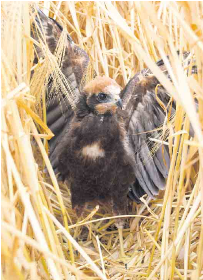
Junge Rohrweihe im Nest.