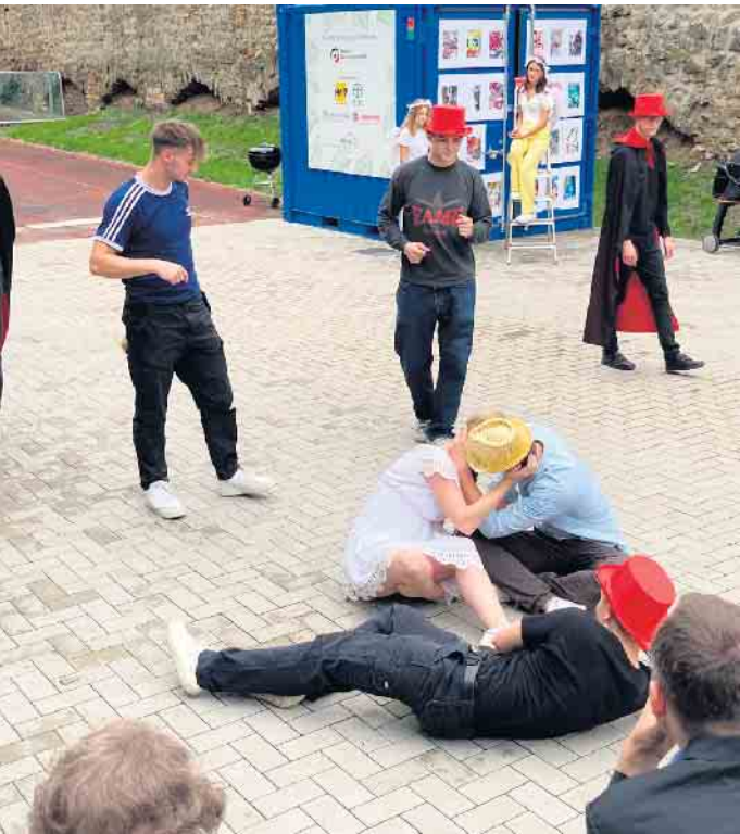
Schülerinnen und Schüler begeisterten mit einer grandiosen Inszenierung des Literaturklassikers „Faust“ von J. W. von Goethe.