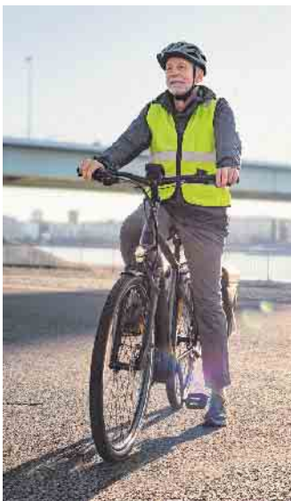
Jede fünfte Person über 55 Jahren besitzt einer Studie zufolge mittlerweile ein Pedelec. Foto: DJD/DVR

Als sehr wahrscheinliche Gefahrensituationen schätzen die Pedelec-Fahrenden laut Umfrage überwiegend Situationen ein, in denen sie die Kontrolle über das Fahrzeug verlieren können, etwa witterungsbedingt auf rutschigen Straßen, durch Unterschätzung der Geschwindigkeit in Kurven und im Allgemeinen durch höhere Geschwindigkeiten, die dank der elektrischen Tretunterstützung mit einem Pedelec erreicht werden. (DJD)