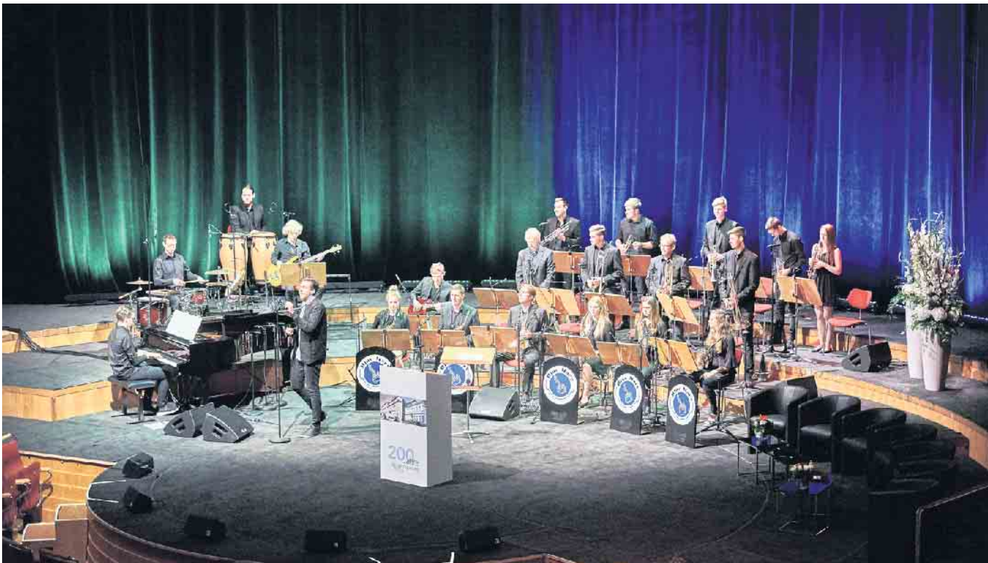
Viel herumgekommen: Die MSE-Big Band beim 200. Geburtstag der Bezirksregierung Köln.