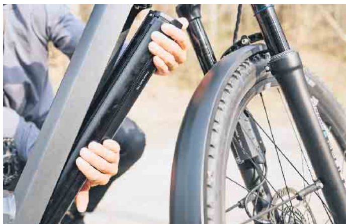
Der Akku bildet das Herzstück des E-Bikes. Mit dem richtigen Laden, Lagern und einigen Tipps zur Pflege lässt sich die Lebensdauer des Energiespenders verlängern.

Er versorgt den Elektromotor mit Leistung und liefert die Energie für so manchen zusätzlichen Kilometer: Der Akku bildet das Herzstück jedes E-Bikes. Mit dem richtigen Laden, Lagern sowie einer regelmäßigen Pflege können E-Biker und -Bikerinnen dazu beitragen, die Lebensdauer des Akkus zu verlängern und sicherer vom eingebauten Rückenwind zu profitieren.