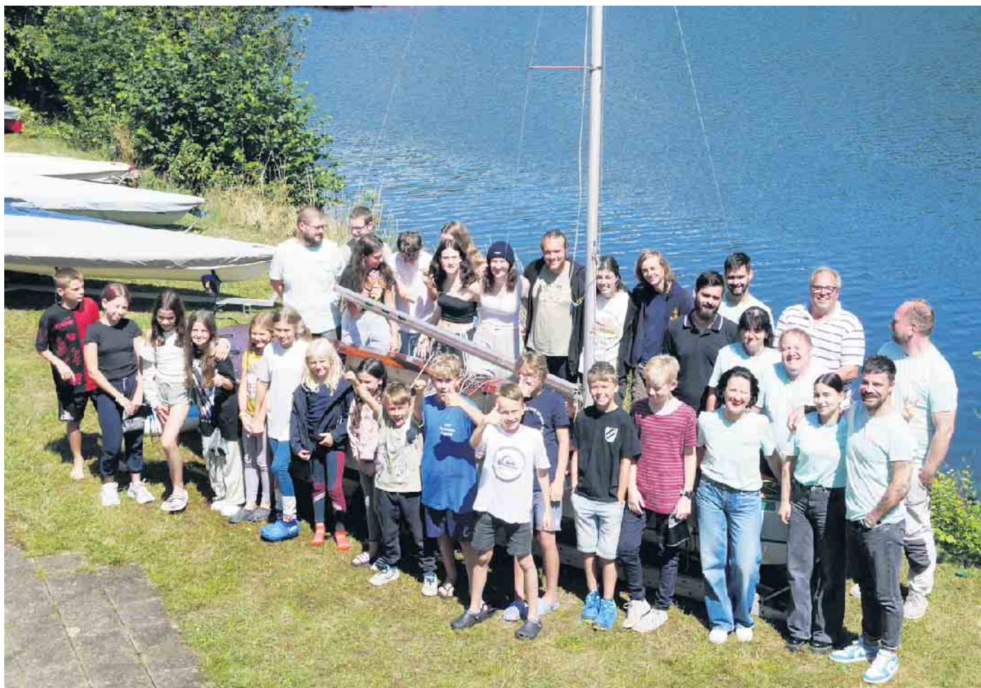
Abschluss-Gruppenbild von Teilnehmern, Trainern und Betreuern.

Trainingslager trotz niedrigem Wetter erfolgreich