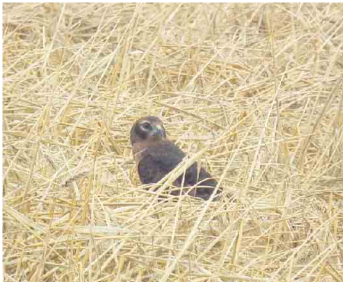
Junge Wiesenweihe am Nest.