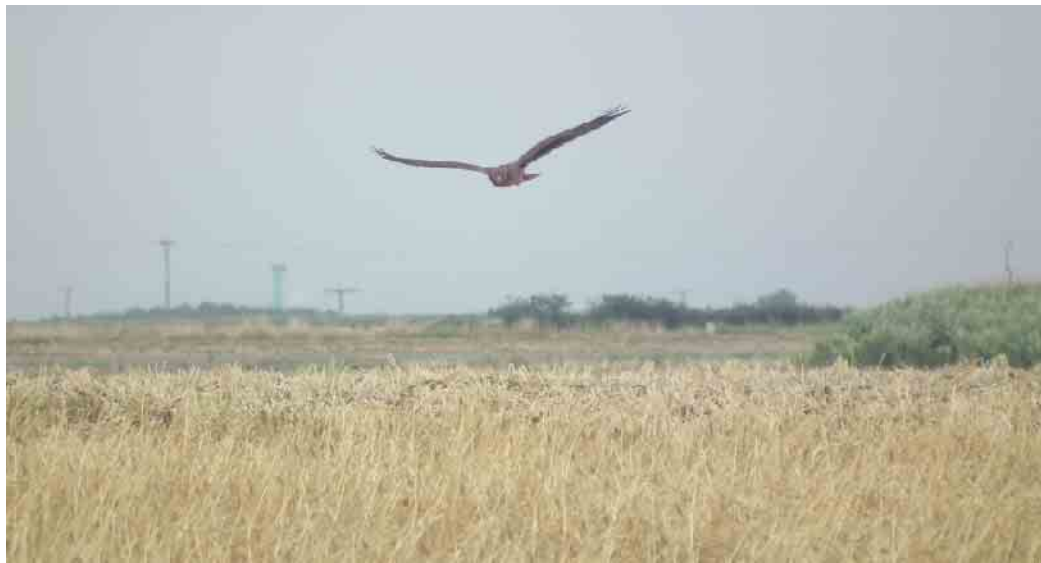
Ein Jungvogel fliegt über den Neststandort.