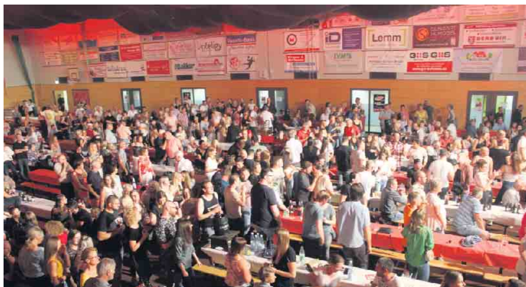
Die Peter-Weber-Halle platzte aus allen Nähten mit gut gelauntem Publikum.

Zusätzlich lockte einen Tag später der Familientag mit einem bunten Programm für Jung und Alt. Neben Frühschoppen, Menschenkicker-Turnier, Hüpfburg, einer Feuerwehr-Ausstellung, Cafeteria war auch mit der Feuerwehr-Spritzwand für beste Unterhaltung gesorgt. Abschließend gilt ein großer Dank den Sponsoren und allen fleißigen Händen, die zum Gelingen des Jubiläumswochenendes beigetragen haben. FH