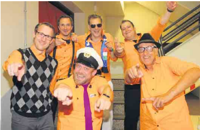
Die Bühne brachte als Ersatz für die Palm Beach Girls die Band Tacheles sprichwörtlich zum Beben