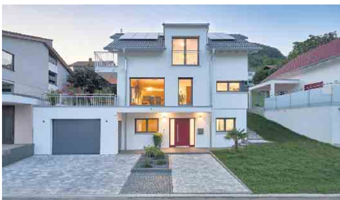
Eine separate Souterrainwohnung bietet zuhause mehr Flexibilität - auch für das Wohnen im Alter.

für Weiss Holzhausbau und Haus-technik ist. Die Kosten für ein unterkellertes Haus liegen ungefähr 20 Prozent höher als bei einem Haus ohne Keller. Die Wohnfläche vergrößert sich jedoch um beachtliche 40 Prozent. Je nach Topografie und Straßenführung kann der Keller mit ebenerdiger Anbindung zum hangseitigen Garten des Grundstücks ausgestattet sein. In einer Souterrainwohnung kann hier durch große Fenster und Türen reichlich Sonnenlicht ins Innere des Wohnbereichs strömen und eine barrierefreie Terrasse leicht zugänglich positioniert werden. Eine Alternative hierzu ist ein sogenannter Lichthof, der beispielsweise über eine Rampe barrierefrei erschlossen werden kann. In die bergseitigen Räume des Kellers können Sonnenlicht und frische Luft etwa durch Lichtschächte gelangen. Schlaf- und Badezimmer sind in diesem Bereich der Wohnung sinnvoll platziert und bleiben an heißen Sommertagen vergleichsweise kühl. GÜF/FT