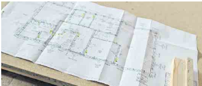
Der maßstabsgetreue Grundriss ist eine wichtige Planungsgrundlage für Bauherren sowie bei der Herstellung von Fertigbauteilen im Werk.

Couch-Ecke benötigt, kann hier Platz sparen, um das Esszimmer auf Wunsch zur geräumigen Kommunikationszentrale des Hauses werden zu lassen.