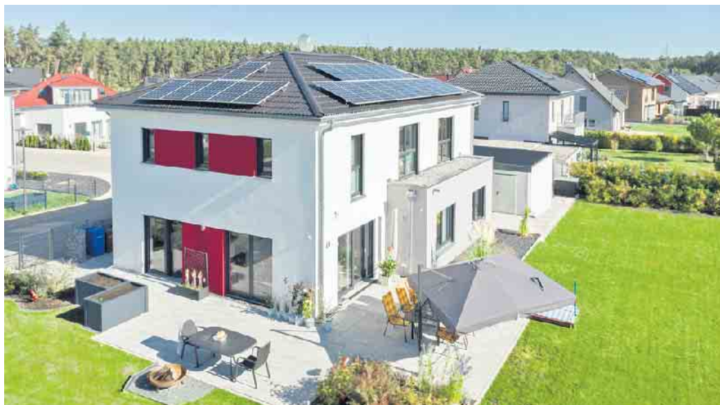
Beim Fertighausbau wird der Grundriss so wie das gesamte Haus individuell auf die Baufamilie zugeschnitten.