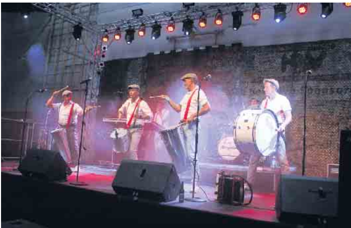
Die Klüngelköpp fungierten nicht nur als Eisbrecher am Samstagabend, sondern überzeugten auch mit ihrer Trommel-Show

Karnevalsstars geben sich in der Peter-Weber-Halle die Klinke in die Hand