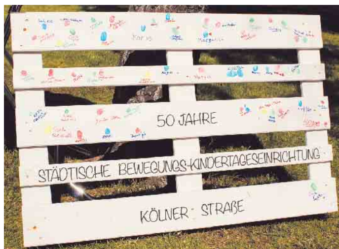
Kita Kölner Straße.

„Die Teams in unseren Kindertagesstätten machen eine tolle Arbeit und ich fand es bei den Jubiläen wirklich schön zu sehen, wie lebendig die Arbeit in den Einrichtungen ist“, so Bürgermeister Sacha Reichelt.