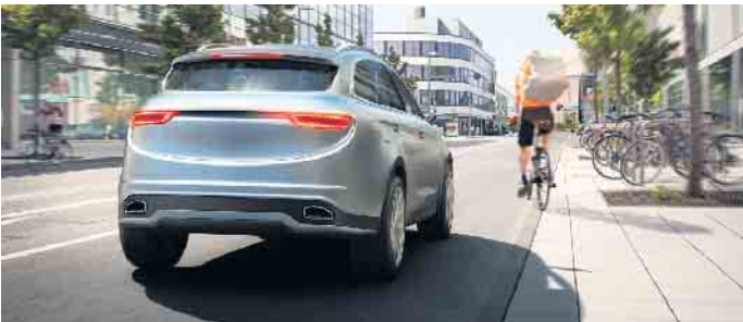
Mehr Sicherheit dank Technik: Der Gesetzgeber schreibt für Neufahrzeuge Ausstattungen wie einen Notbremsassistenten vor.

Um die verbesserte Sicherheit im Straßenverkehr zu ermöglichen, arbeiten im Hintergrund komplexe Systeme. Verschiedene Umfoldsensoren sind in der Lage, kreuzende Fahrradfahrer sowie deren Abstand zum Fahrzeug, Geschwindigkeit und Fahrtrichtung zu erkennen. Droht eine Kollision, brems das System das Auto automatisch ab, bis es zum Stillstand kommt. In modernen Fahrzeugen sind dazu verschiedene Komponenten wie Radarsensoren, Videokameras und Ultraschallsensoren von Bosch verbaut. Die Technik macht den Straßenverkehr nicht nur sicherer, sondern entlastet zugleich den Menschen am Steuer. Ein weiteres Beispiel dafür ist die Ausstiegswarnung: Das System erkennt mit Eck-Radarsensoren im hinteren Teil des Fahrzeugs, wenn sich andere Verkehrsteilnehmer nähern. Optische und akustische Signale warnen in diesem Fall Fahrer und Mitfahrer davor, die Tür zu öffnen. Auf diese Weise lassen sich Unfallrisiken minimieren, Verletzungen bei Radfahrern vermeiden und Schäden am Fahrzeug vermindern. (djd)