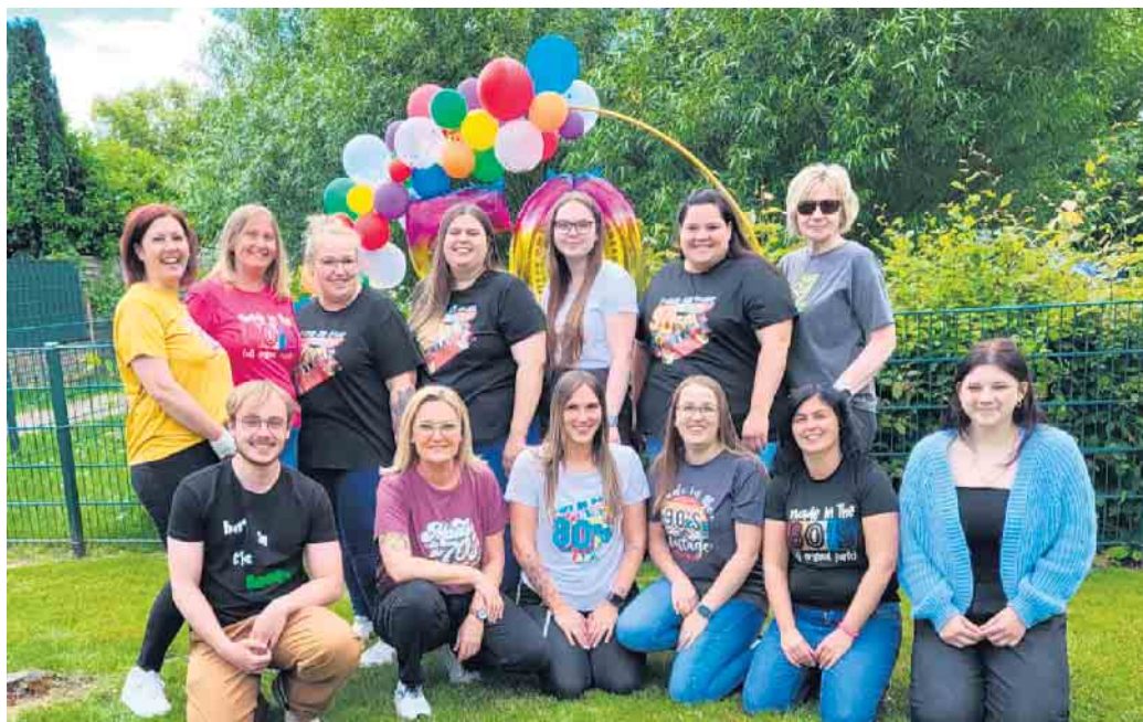
Kita Großbüllesheim.