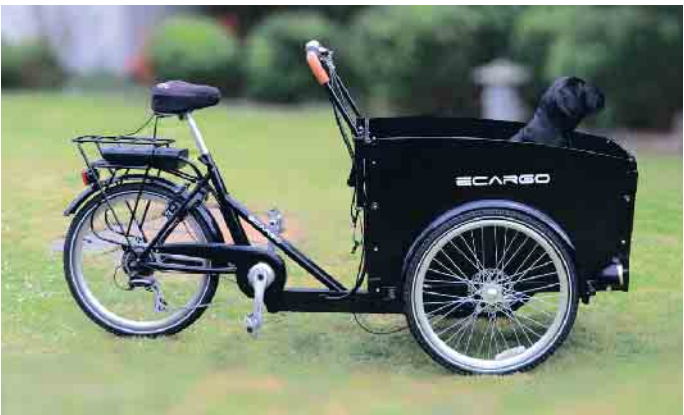
Grundsätzlich ist das Lastenrad eine sichere Methode, nicht nur Güter, sondern durchaus auch Kinder oder Tiere zu befördern.

Eines ist klar: Grundsätzlich ist das Lastenrad eine sichere Methode, nicht nur Güter, sondern durchaus auch Kinder oder Tiere zu befördern. Es gilt lediglich, wie bei jeder Teilnahme am Verkehr, Regeln zu beachten, bestimmte Sicherheitsmaßnahmen zu treffen und mit dem Transportmittel umgehen zu können. Experten empfehlen daher, sich als erstes mit dem neuen Rad vertraut zu machen: Wie verhält es sich auf der Straße, zum Beispiel beim Abbiegen oder bei der Auffahrt auf Erhöhungen? Eine Leerfahrt entwickelt ein besseres Gefühl für Fahren, Lenken und Bremsen. Welche Bestimmungen sieht die Straßenverkehrsordnung vor? Ein Cargo-Bike mit Elektroantrieb bis 25 Stundenkilometer wird wie ein Fahrrad behandelt und gehört daher auf den Radweg, sofern dessen Nutzung vorgeschrieben ist.