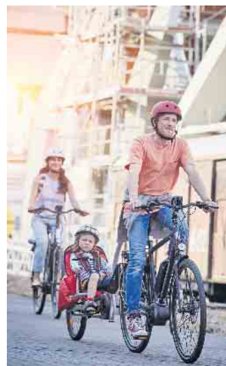
Selbst körperlich aktiv werden und etwas für den Umweltschutz tun: Diese Motive sind E-Bike-Nutzern laut einer E.ON-Umfrage unter anderem besonders wichtig.

der 18- bis 29-Jährigen, die sich demnächst ein E-Bike anschaffen möchten, könnten sich vorstellen, beim Kauf zu einem Ökostromtarif zu wechseln. (DJD)