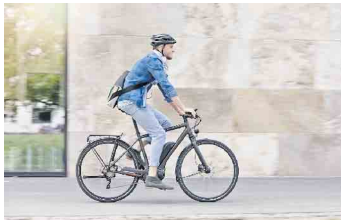
Ob für den Weg zum Arbeitsplatz oder für Freizeitaktivitäten: Immer mehr Menschen in Deutschland satteln auf ein E-Bike um.

Umfrage: Fast jede vierte Person in Deutschland besitzt bereits ein E-Bike