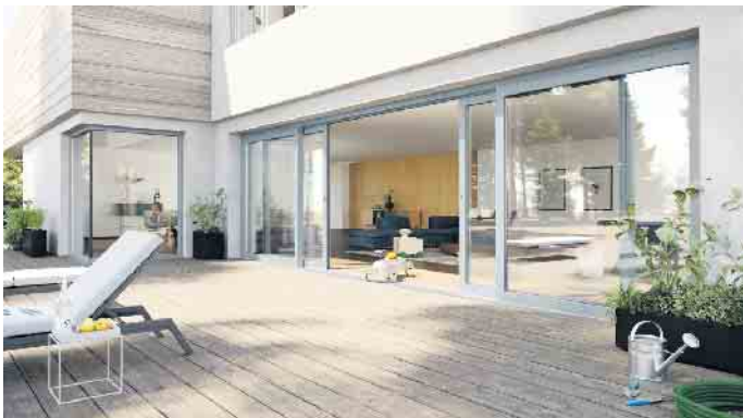
Trend 2 & 3: Der Garten wird zum erweiterten Wohnzimmer mit großen Hebe- und Schiebetüren. Die Profile sind in silbergrau gehalten.

entweichen kann. Dies ist ein wirk-samer Beitrag, um im Winter Heiz-kosten zu sparen. Aber auch beim Design gibt es Unterschiede: Rahmen und Fenster-flügel schließen häufig leicht versetzt, andere sogenannte „flä-chenbündige Konstruktionen“ lassen Flügel und Blendrahmen zu einer Ebene werden. Geglie-dert ist diese nur durch einen schmalen Spalt. Diese reduzierte Optik entspricht dem aktuellen Haustürendesign, bei dem große Flächen mit wenigen Linien struk-turiert werden. Es gibt zudem ge-klebte Flügelkonstruktionen, bei denen das Profil des Flügels gar nicht mehr zu sehen ist und op-tisch hinter dem Blendrahmen verschwindet. Dadurch sehen Fest-verglasungen und Flügel von außen nahezu identisch aus. Ein weiterer Vorteil: Die Glasfläche wird nochmals größer. Trend 5: Automation - das Smart Home hält Einzug Smart-Home-Systeme beziehen zunehmend auch die Fenster ein. Besonders automatische Lüf-tungssysteme setzen sich durch. Sensoren messen Temperatur und Luftfeuchtigkeit und lüften bei Bedarf über in die Fenster inte-grierte, automatische Lüfter. Für den Sommer kann der Sonnenschutz über entsprechende Sensoren automa-tisch hoch- und runtergefahren