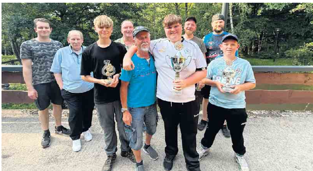
Die drei Bestplatzierten beim Rotaugenpokal.