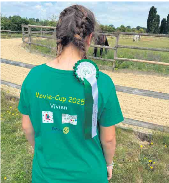
Das Kader der St. Nikolaus-Schule Kall war auch optisch ein Team: Grüne T-Shirts mit Namen und Schullogo zeigen die Förderer „Riedlingstiere“ und Rotary Club Euskirchen - und nach dem Turnier die Schleife des Pferdesportverbandes.

Zentrum der Gold-Kraemer-Stiftung ist auf Menschen mit Behinderung ausgerichtet. Das Gelände ist barrierefrei. Eine professionelle Jury bewertete die Übungen der Kinder und Jugendlichen auf dem MOVIE und verlieh allen Teilnehmenden am Ende ihrer Kür eine Schleife des Pferdesportverbandes Rheinland. Insgesamt elf Förderschulen aus dem Rheinland waren der Einladung gefolgt. Der Auftritt jedes Teams begann mit dem Einlaufen in die Reithalle zu selbst gewählter Musik. Weiter ging es auf das MOVIE. Die begeisterten Zuschauer erlebten freihändige