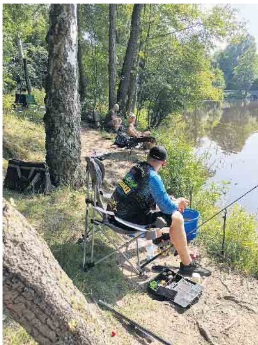
Gemeinschaftsangeln mit Senioren.