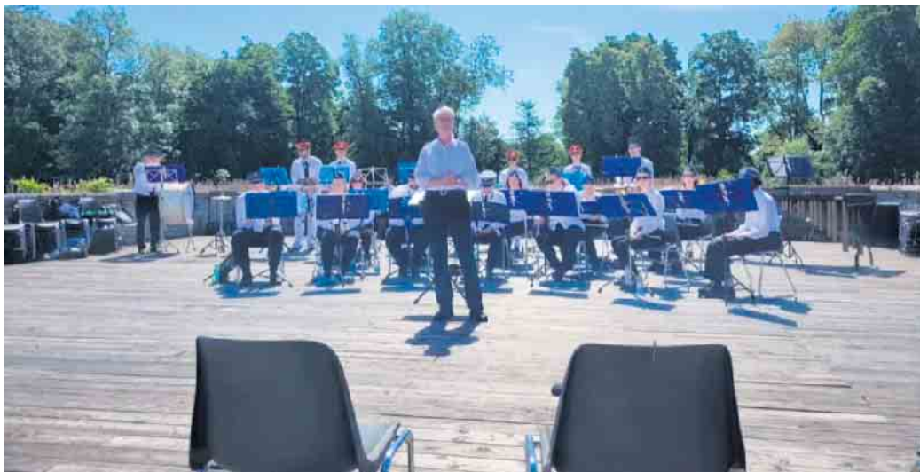
Fotos: Marika Pick, Musikalische Leitung des Tambourcorps Oberwichterich, Bundesvereinigung Deutscher Musikverbände e. V., LandesMusikVerband NRW 1960 e. V.

Ein musikalisches Wochenende voller Gemeinschaft, Spaß und unvergesslicher Momente