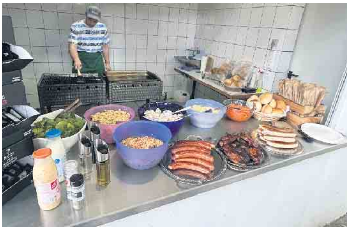
Für das leibliche Wohl ist immer bestens gesorgt auf dem Schützenplatz.

Es wurde gehämmert, abgerissen, getaucht, gegurgelt und gelacht. Vier Mannschaften traten bei den spannenden Spielen an. Wer sich den Tag in einem Video anschauen möchte, kann dies gerne auf der Instagram-Seite der Schützenbruderschaft Kuchenheim tun. Das nächste Schützenfest findet am 31. August auf dem Schützenplatz in Kuchenheim statt. Wer gerne bei der Durchführung helfen möchte, kann sich beim Vorstand oder auf der Instagram bei den Schützen melden. Die Bruderschaft freut sich über viele fleißige Hände.