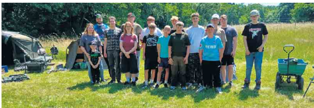
Gruppenbild der Jungangler mit Betreuer.

Das Jugendzeltlager und das Gemeinschaftsangeln mit den Senioren zählt im Kalender der Jugend des Fischerei-Vereins Euskirchen e. V. mit zu den Highlights im Jahreskalender.