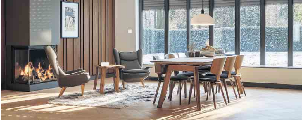
Trend 1: Große bodengebundene Fenster lassen viel Tageslicht herein. Und sparen im Winter viel Heizenergie.