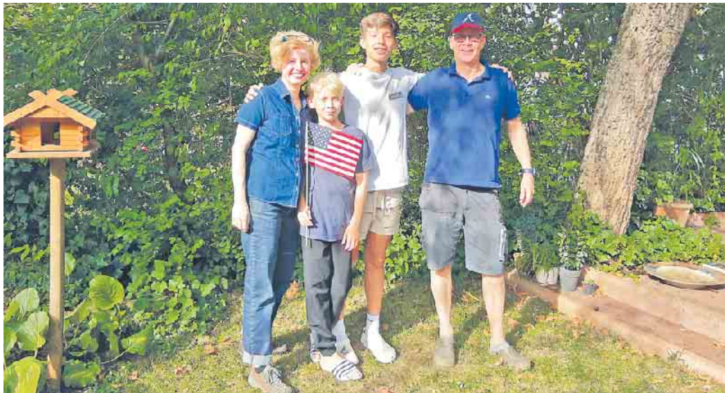
Gastfamilien schenken Austauschschüler/innen ein Zuhause auf Zeit.

Das Besondere: Mit Experiment können fast alle Gastfamilie werden!