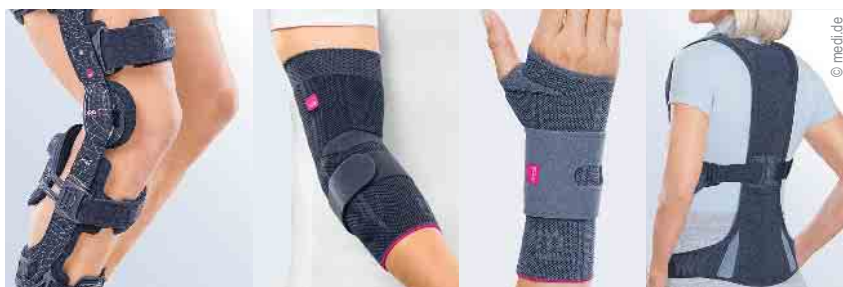
Direktversorgung von Bandagen und Orthesen