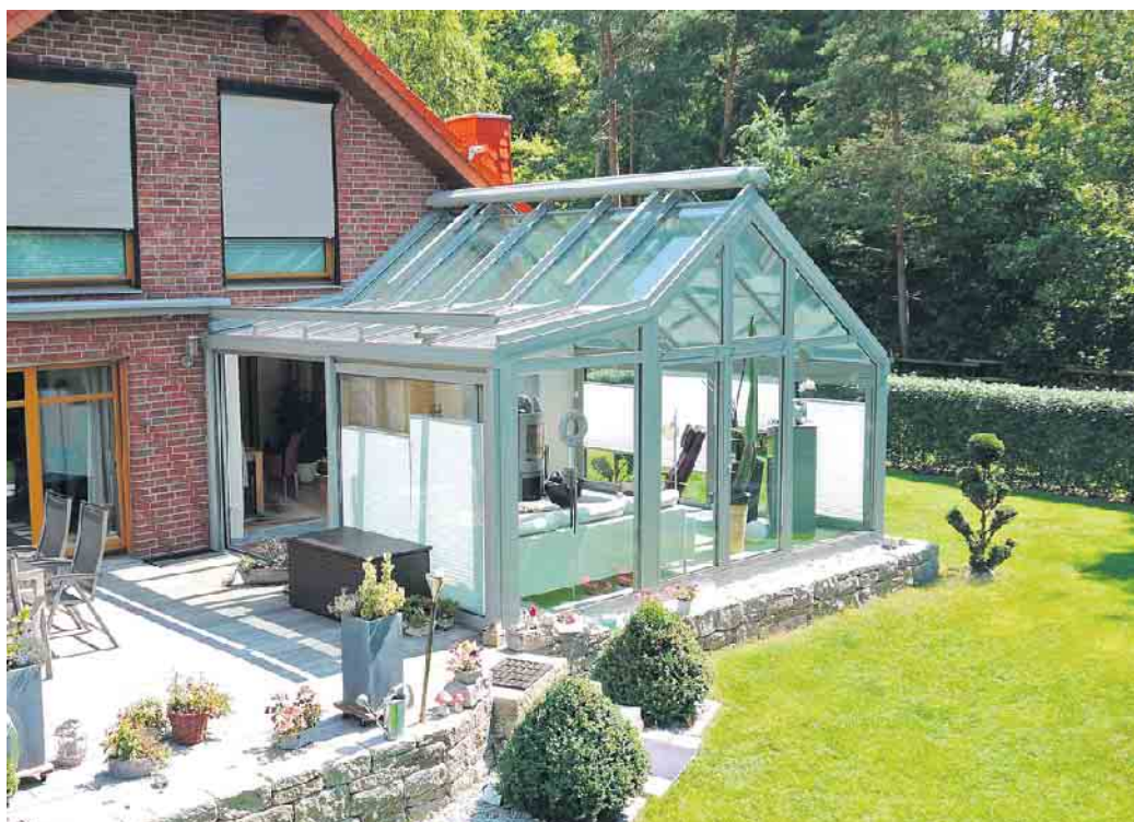
Ein Wintergarten verbindet Haus und Garten und sorgt für mehr Tageslicht im Haus.

Warum handwerkliche Kompetenz bei der Wintergartenplanung besonders wichtig ist