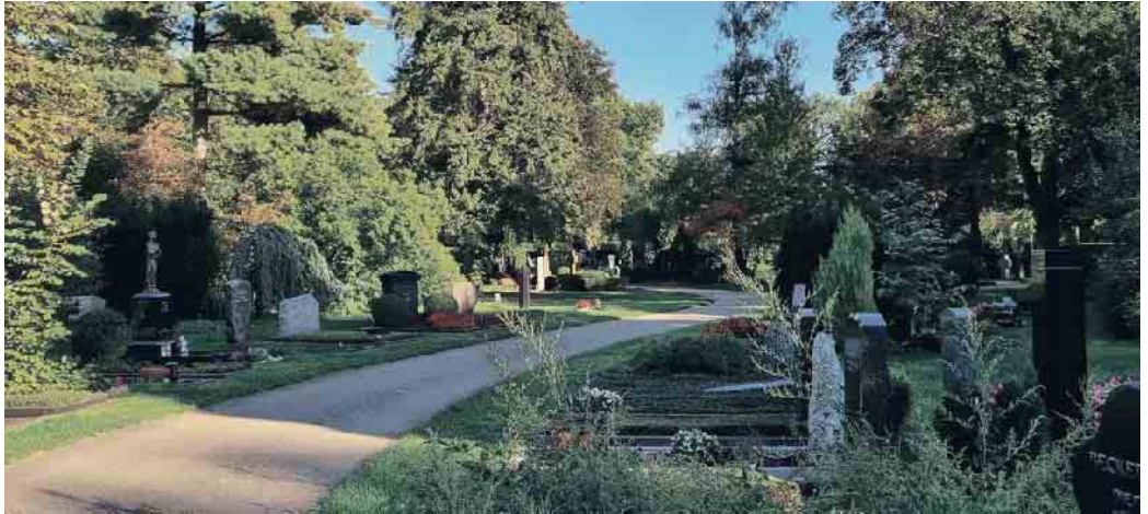
Der BDB Bestattungsplaner gibt einen schnellen Überblick zu Bestattungskosten.

Wie tief und wie lange jemand nach dem Tod eines wichtigen Menschen trauert, hängt von vielen Faktoren ab. Unterstützungsangebote helfen dabei, mit dem Schmerz nicht alleine bleiben zu müssen. Viele Hinterbliebene ziehen sich in ihre Trauer zurück. Trauer-Zeit kann und sollte man nicht willentlich verkürzen, da unverarbeitete Trauer und mangelnde Akzeptanz eines schweren Verlustes zu Krankheiten, Depression und seelischen Schäden führen können. Hier braucht es Stütze und Geleit - durch Familie, gute Freunde, eine Selbsthilfegruppe oder einen Trauerbegleiter. Erste Ansprechpartner sind dabei oft die Bestattungshäuser und ihre Trauernetzwerke. „Viele Bestatter sind durch Aus- oder Fortbildung in Trauerpsychologie fachlich qualifiziert. Sie begleiten Hinterbliebene oft seelsorgerisch weit über den Bestattungstermin hinaus. In ihren Räumen finden, häufig ehrenamtlich begleitet, Trauergruppen und Trauercafés statt“, erläutert Elke Herrnberger vom Bundesverband Deutscher Bestatter.