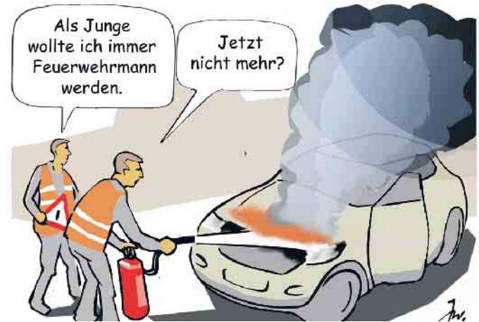
Ein Brandherd in einem Kfz kann sich durch auslaufenden Treibstoff sehr schnell ausbreiten.

Allerdings kann sich ein Brandherd in einem Kfz durch auslaufenden Treibstoff sehr schnell ausbreiten. Entzündet wird der Treibstoff dabei meist durch Funken oder einen Kurzschluss in der Elektronik bzw. die heißen Motortemperaturen, die auch Schmierstoffe in Brand setzen können. Ausgehend vom Motorraum kann ein Feuer dann schnell zu einer tödlichen Gefahr für Autoinsassen werden. Was soll man also tun, wenn das Fahrzeug brennt? Wenn sich ein Brand durch Qualm oder Brandgeruch ankündigt empfiehlt es sich, umgehend anzuhalten - am besten auf dem Seitenstreifen oder am rechten Fahrbahnrand - die Warnblinkanlage einzuschalten sowie die Seitenfenster zu öffnen und das Fahrzeug zügig zu verlassen. Die Motorhaube sollte geschlossen bleiben, um zu ver-