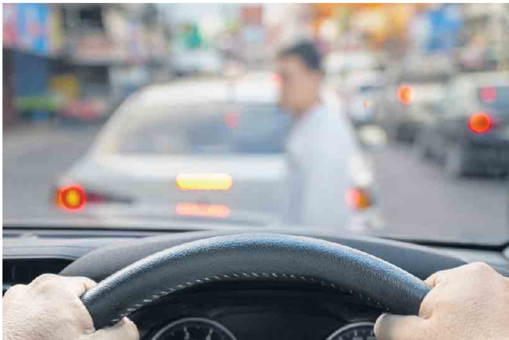
Unachtsamkeit am Steuer kann schwerwiegende Folgen haben, gerade im quirligen Stadtverkehr. Technik kann dabei den Menschen unterstützen und die schwächsten Verkehrsteilnehmer besser schützen.

Assistenzsysteme können Autofahrer unterstützen und viele Unfälle verhindern