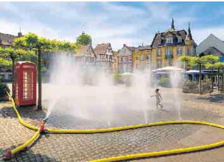
Oder auch mit einfachsten Mitteln für schnelle Lösungen.

Die SPD-Fraktion beantragt, dass die Stadt Euskirchen ein Pilotprojekt zur Kühlung des öffentlichen Raums am Alter Markt durchführt. So wird an besonders heißen Tagen die Aufenthaltsqualität verbessert und ein Beitrag zur Klimaanpassung geleistet.