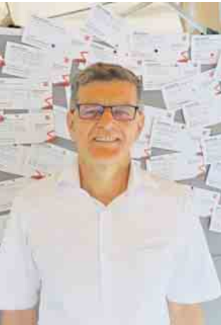
Viele „Beste Ideen“ haben die Euskirchener Sozialdemokraten zum Sommeranfang gesammelt.

Zum Sommerbeginn hat die SPD in Euskirchen Menschen in der Fußgängerzone gefragt, was sie in ihrer Heimatstadt verbessern würden. Sehr viele „Beste Ideen“ kamen schon am ersten Infostand zusammen.