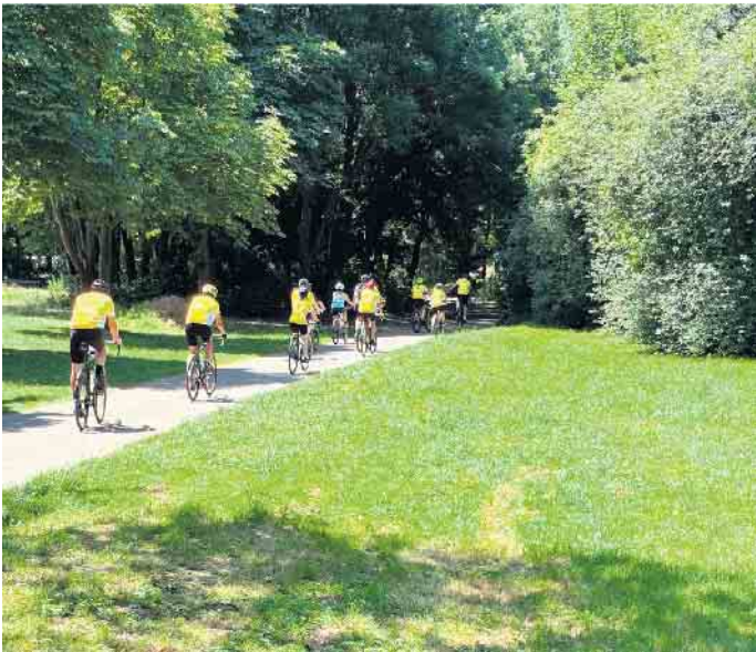
Die Trainingseinheiten zeigen: Gutes Teamwork und angemessene Ernährung sind Voraussetzungen für das Gelingen der anspruchsvollen Tour.