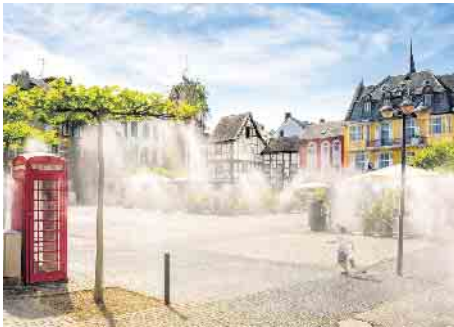
Animation: So könnte eine Vernebelungsaktion am Alter Markt aussehen.

Solche Maßnahmen sollten Teil eines städtischen Hitzeaktionsplans sein. Der Klimawandel verlangt konkrete, vor Ort wirksame Lösun-