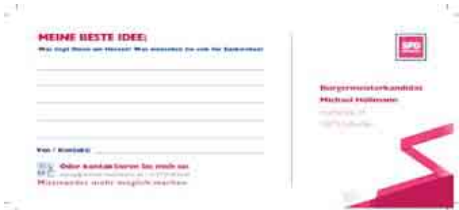
Per Karte können Euskirchener Bürgerinnen und Bürger ihre „Beste Idee“ bei der SPD Euskirchen einreichen. Das geht auch online.