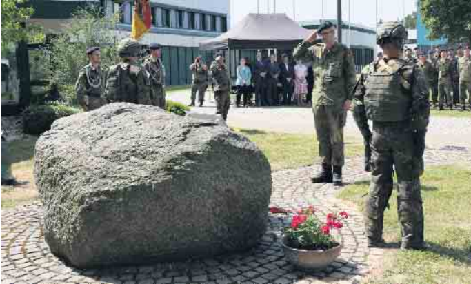
Stilles Gedenken an die Getöteten und Verwundeten.