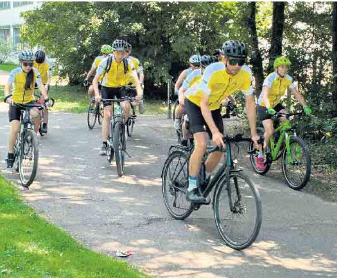
Bestes Wetter beim Start einer der bis zu 80 Kilometer langen Trainingsrunden als Vorbereitung auf die Charity-Alpentour 2025 der Marienschule Euskirchen. Der Erlös ist für Kinder in benachteiligten Lebenssituationen.

Fördervereins des Rotary Clubs Euskirchen bei der Kreissparkasse Euskirchen: IBAN DE46 3825 0110 0001 0043 99. Spendenbescheinigungen können ab 300 Euro ausgestellt werden. Dazu müssen Namen und Anschrift im Verwendungszweck angegeben sein. Bei Beträgen unter 300 Euro genügt der Überweisungsbeleg als Spendennachweis. RiWi