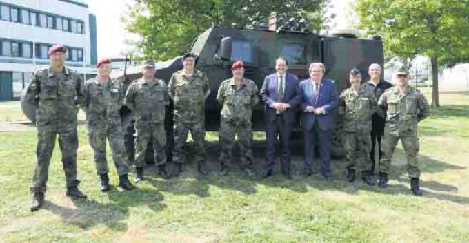
Europaminister Nathanael Liminski (5.v.r.) besuchte auf Einladung von Klaus Vossemer MdL (4.v.r.) den Veteranentag in Euskirchen.

Viele Soldatinnen und Soldaten leben und arbeiten in Euskirchen und nennen die Stadt ihre Heimat. Als Zeichen der Wertschätzung des Einsatzes der Frauen und Männer in Uniform für den Schutz, die Freiheit und die deutsche Demokratie haben wurde am 14. Juni der erste nationale Veteranentag begangen. Die Initiative, dies auch in Euskirchen zu feiern, stammte von der CDU