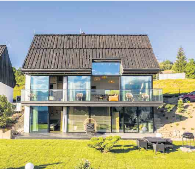
Wo viel Glas für wohngesundes Tageslicht gefragt ist, sollte auch an einen Schutz vor Überhitzung der Innenräume gedacht werden.

grierten Sonnenschutzlösungen ist ihre Wetterunabhängigkeit und Wartungsfreiheit“, erklärt Grönegräs.