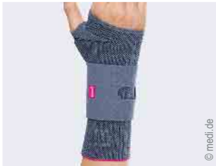
Versorgung der Hand