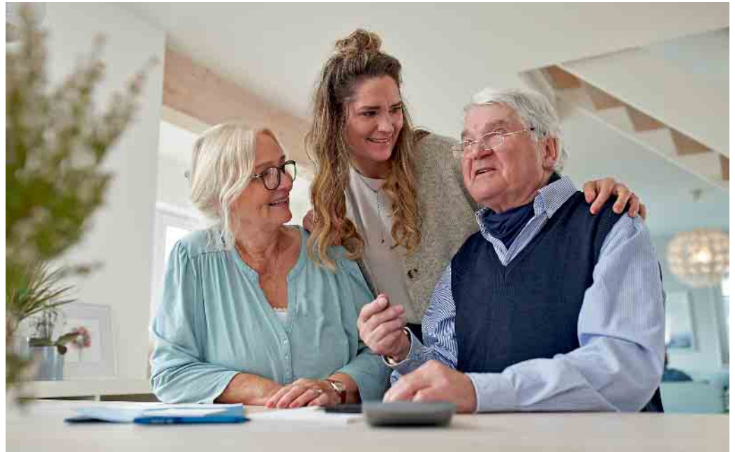
Eine Eigentumswohnung für die Kinder kaufen: Dieses Finanzierungsmodell ist bei Immobilienbesitzern und Banken gleichermaßen beliebt.