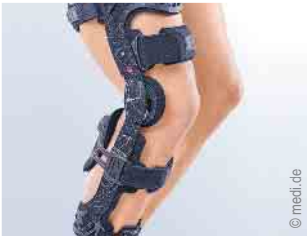
Versorgung des Kniegelenks