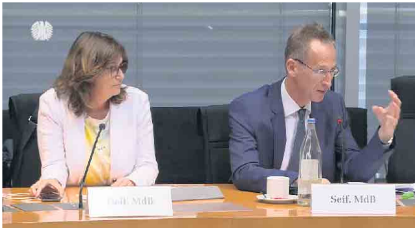
Der Bundestagsabgeordnete Detlef Seif, gemeinsam mit seiner Kollegin Mechthild Heil, Bundestagsabgeordnete für den Landkreis Ahrweiler, bei der Sachverständigenanhörung des Deutschen Bundestages zum Bevölkerungsschutz

Detlef Seif: Die Flutkatastrophe hat wie ein Brennglas bestehende Mängel deutlich gemacht. Ich gebe hier einige Beispiele: Vorliegende Daten zu Niederschlagsmengen wurden nicht in allen Fällen zeitnah an die zuständigen Behörden weitergeleitet und nur bedingt für die jeweiligen regionalen Bereiche ausgewertet. Die Warnung der Bevölkerung hat nicht funktioniert. Ein Radiosender hat sogar sein aufgezeichnetes musikalisches Programm einfach weiterlaufen lassen, anstatt eine dringlich gestellte Warnmeldung zu senden. In weiten Teilen der Bevölkerung fehlt bis heute das Wissen über das richtige Verhalten in einer Katastrophe. Bei der Anforderung, dem