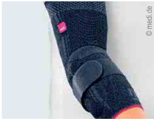
Versorgung von Ellbogen und Schulter