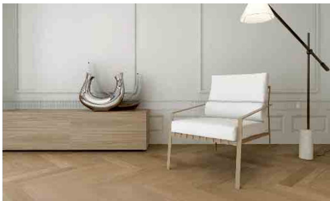
Beim feuchten Wischen gilt es, immer ein zur Oberfläche passendes Reinigungsmittel zu verwenden.

Erst die Reinigung, dann die Pflege Bevor es an die Pflege geht, muss der Schmutz runter. Mit einem Besen aus weichen Borsten oder einem Staubsauger mit weichem Parkett-Aufsatz werden Staub, Schmutz und grobe Partikel entfernt. So wie bei Massivholzmöbeln sollte auch die Parkettoberfläche anschließend mit einem nebelfeuchten Mopp gewischt werden. „Beim feuchten Wischen gilt es, immer ein zur Oberfläche passendes Reinigungsmittel zu verwenden. Zum Beispiel darf geöltes Parkett nicht mit einem Mittel für lackierten Boden gereinigt werden“, sagt der