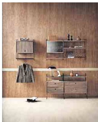
Edel und einzigartig: Furnierte Möbel.

Initiative Furnier + Natur (IFN) e.V. Weitere Infos zum Thema Furnier unter www.furnier.de oder www.furniergeschichten.de sowie auf Instagram unter #furnier_und_natur