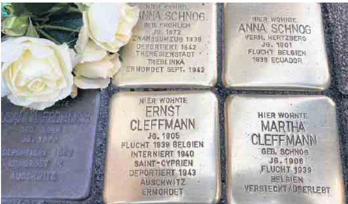
Stolpersteine für die Familien Schnog und Cleffmann in der Bischofstraße 21, neben den bereits 2009 verlegten Steinen für Familie Fröhlich.

Ende: Aus der Arbeit der Parteien Bündnis 90 / Die Grünen Euskirchen