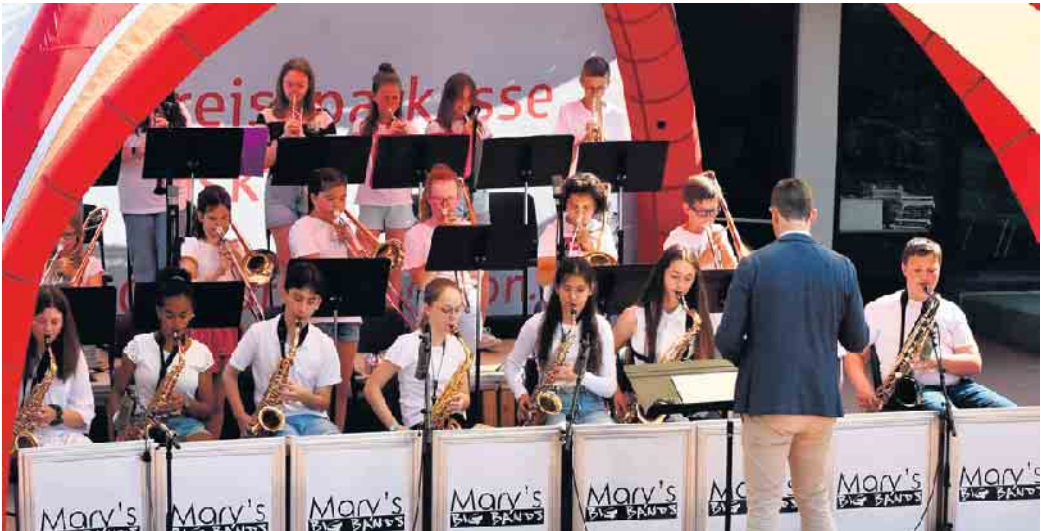
Der Jazz-Frühschoppen findet bereits zum 21. Mal statt.