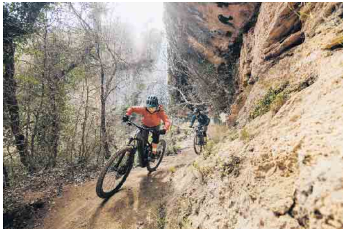
Das E-Bike ist das passende Trainingsgerät für alle, die gezielt ihre Fitness verbessern möchten.

tungswerte, die Trittfrequenz und die Anzeige der verbrannten Kalorien. So sehen E-Biker, ob sie gerade über oder unter ihrer persönlichen Leistung und Trittfrequenz fahren und können auf diese Weise ihr Sportprogramm optimieren. Mit dem richtigen Training ist das E-Bike ein effektiver Fettverbrenner und Fitnessturbo. Wichtig dabei: Gerade Einsteiger sollten sich realistische Ziele setzen und sich zu Beginn nicht überfordern. Zudem sollten sich auch Sport-Enthusiasten zwischen jeder intensiven Einheit ein bis zwei Ruhetage zur Regeneration gönnen. Ein weiterer Tipp: E-Biken in der Gruppe macht noch mehr Spaß und fördert erfahrungsgemäß die persönliche Motivation. (DJD)