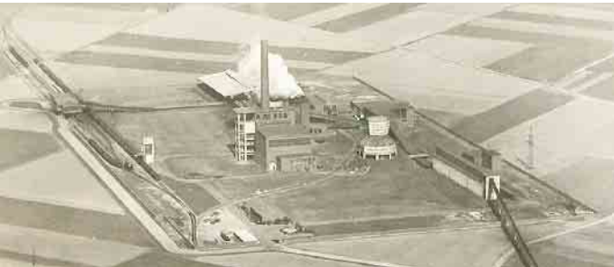
Brikettfabrik in Zülpich-Geich, Grundsteinlegung vor 70 Jahren.