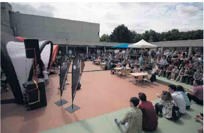
Die Big Bands spielen ein abwechslungsreiches Programm.

de und Ehemalige möchten die Musiker mit ihrem Open-Air-Konzert ansprechen, sondern natürlich auch alle Freunde des Big Band-Sounds aus dem gesamten Kreisgebiet und darüber hinaus. Wer also bei hoffentlich sonnigem Wetter einen „jazzigen“ Sonntagsvormittag verbringen möchte, merke sich den 30. Juni, ab 10.30 Uhr, vor (Ende gegen 14.30 Uhr). Bei schlechtem Wetter findet die Veranstaltung in der Aula und im Foyer der Marienschule statt. Für das leibliche Wohl ist bestens gesorgt. Beim Jazzfrühschoppen ist der Eintritt frei.