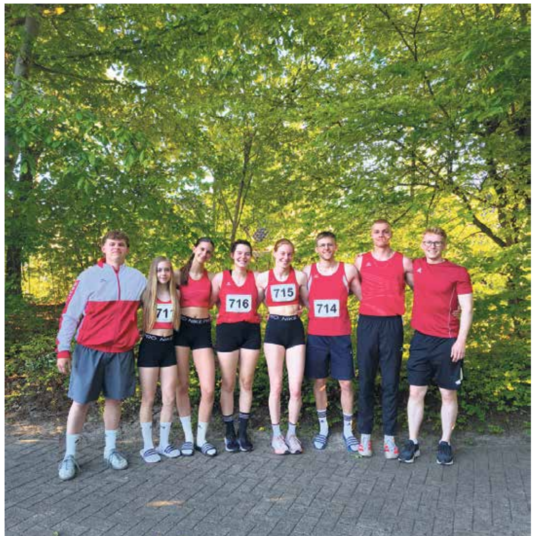
Das Team Voreifel aus Zeven

vielen positiven Eindrücken, starken Einzelleistungen und wertvollen Impulsen für die weitere Saison aus Zeven zurück