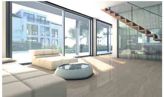
Gerade bei frei zugänglichen Terrassentüren bietet sich Sicherheitsglas besonders an.

verband Flachglas (BF) erklärt, worauf es ankommt. Wer eine Immobilie besitzt, hat nicht nur Rechte - sondern auch Pflichten. Laut der sogenannten Verkehrssicherungspflicht müssen Eigentümer sicherzustellen, dass niemand Schaden nimmt, der am Haus vorbeiläuft oder es als Mieter oder Besucher nutzt. Dazu gehören beispielsweise die Sicherung des Dachs, das Befreien