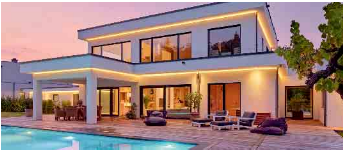
„Die Bauhausarchitektur ist Ausdruck von Individualität und Stilsicherheit.“

Fertighäuser zeigen Merkmale der Bauhausarchitektur