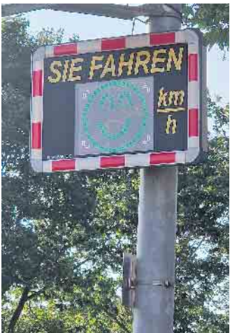
Smileys für die Sicherheit und gegen Verkehrslärm. SPD fordert zusätzliche Geschwindigkeitsanzeigen.

Bereits 2020 hatte sich die SPD-Fraktion für die Anschaffung von sogenannten „Geschwindigkeitsanzeigen mit Dialog-Display“ eingesetzt, die bei einer Überschreitung der zulässigen Höchstgeschwindigkeit traurige Smiley-Anzeigen anzeigen. Obwohl die Wirkung nicht angezweifelt wurde, konnte man sich 2020 nur auf zwei Anlagen einigen. Zwischenzeitlich sind im Stadtgebiet auch privat beschaffte Anlagen installiert. „Es sind immer noch zu wenig Anlagen im Einsatz. Fragt man bei der Stadt nach, um eine Wechsel-Anlage zu montieren, bekommt man gesagt, dass die Anlagen auf lange Zeit ausgebucht sind“, sagte Thomas Brochhagen, SPD-Sprecher im Verkehrsausschuss. Viele Anlieger wünschen sich mittlerweile die Anlagen in ihren Straßen, weil ihre Wirkung wegen der sozialen Kontrolle von