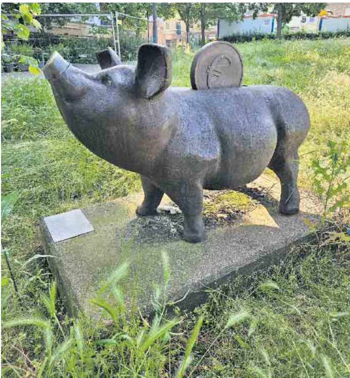
Das Sparschwein vom Klosterplatz ist derzeit genauso eingesperrt: Der Haushalt 2024 für die Stadt Euskirchen soll mit einem Defizit von ca. 19 Millionen Euro abschließen. Trotzdem gibt es Grund, optimistischer in die Zukunft zu blicken.