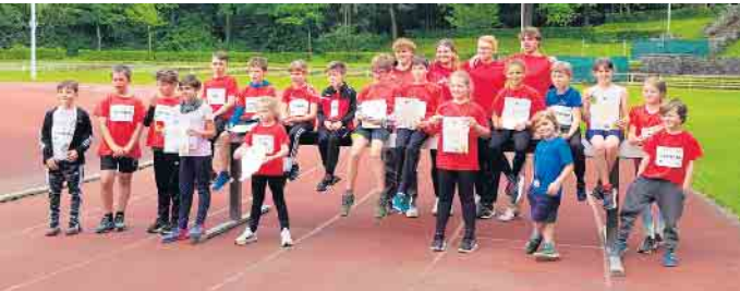
Gruppenfoto der Teilnehmer

Besonders erfolgreich war die U12, deren Mannschaften den 5. und 2. Platz belegten. Es war ein aufregender und erfolgreicher Tag für die jungen Sportler.