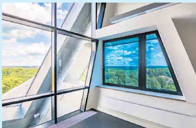
Mit Sonnenschutzgläsern lassen sich zusätzliche Kühl- und Verschattungsmaßnahmen reduzieren.

Sonnenschutz-Isoliergläser haben eine spezielle Beschichtung, die bis zu 80 Prozent der Wärmestrahlung der Sonne reflektiert. Dies gelingt durch eine hauchdünne Beschichtung, meist aus Silber, auf der Innenseite der äußeren Glasscheibe. „So wird der