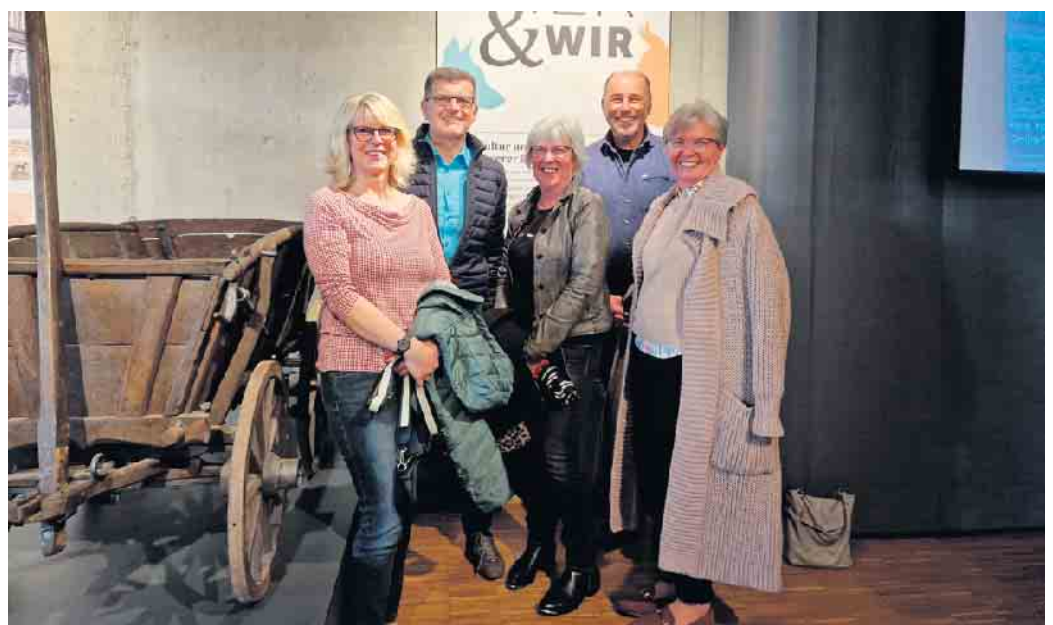
SPD-Kulturvertreter bei der Eröffnung der sehenswerten Sonderausstellung Tier &amp; Wir im Stadtmuseum

1905 meldet Albert Latz eine Hundekuchenfabrik in Euskirchen an. Diese Erfindung ist heute unter dem Namen Nestlé Purina Petcare weltbekannt.