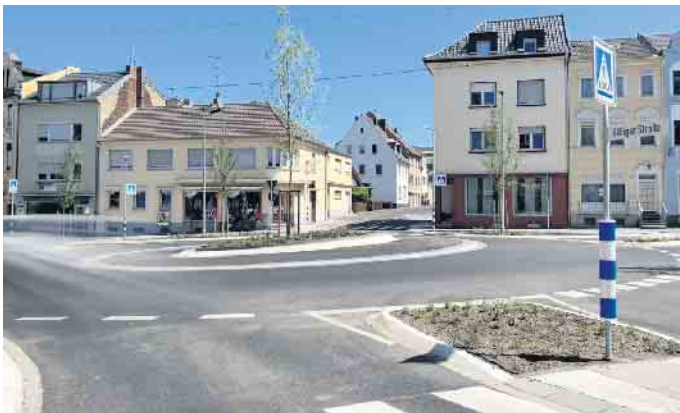
Der neugestaltete Kreisverkehr an der Billiger Straße.

Keine Ampeln mehr dank Landesförderung: Mit 380.000 Euro förderte das Land NRW den Umbau des Knotenpunktes Müns-terefeler Straße/Billiger Straße/Gottfried-Kinkel-Straße zu einem Kreisverkehr. Dieser wurde nun nach rund neun Monaten Bauzeit für den Verkehr freigegeben. „Ohne die Landesförderung aus dem Programm „Kommunaler Straßenbau 2022“ wäre es für die Stadt schwer geworden, den Knotenpunkt mit eigenen Mitteln umzugestalten“, so der CDU Fraktionsvorsitzende