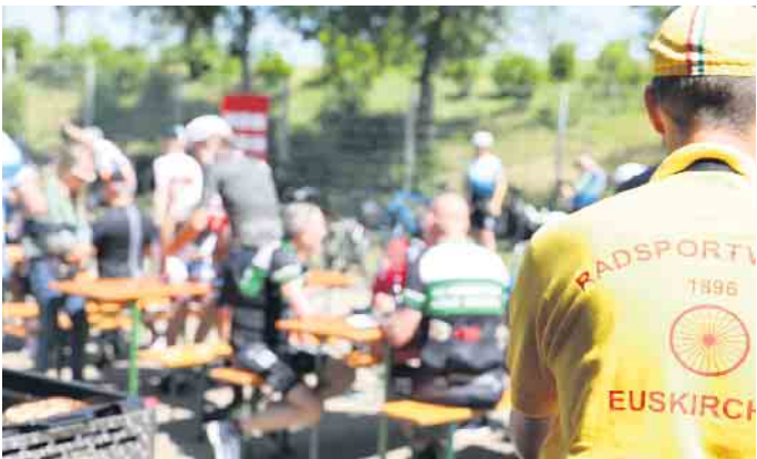
Auch für das leibliche Wohl wurde bestens gesorgt.

begeisterte Rennradfahrer Ramers startete anschließend auf eine kleine Runde und konnte sich so ein Bild von den wunderschönen Strecken und der top Organisation machen. „Das Konzept der Radtouristikveranstaltung Von der Erft zur Urft begeistert mich. Die beiden das Kreisgebiet durchfließenden Flüsse sind das verbindende Element, dazwischen spannt sich ein Straßen- und Wegenetz, dass der RSV Euskirchen geschickt zu wunderschönen Routen zusammengefügt hat“ fasst Markus Ramers seine Eindrücke zusammen. „Gerade erst wurde Euskirchen zum wiederholten Male das Prädikat „Fußgänger- und fahrradfreundlicher Kreis“ vom Land NRW verliehen. Das ist eine schöne Auszeichnung, aber gleichzeitig auch die Verpflichtung die Radwege im Kreis weiter auszubauen und an der Mobilitätswende zu arbeiten“ blickt der Landrat zuversichtlich in die Zukunft. Der 2. Vorsitzende des Vereins, Markus Ernst, freute sich über die gelungene Veranstaltung und die prominenten