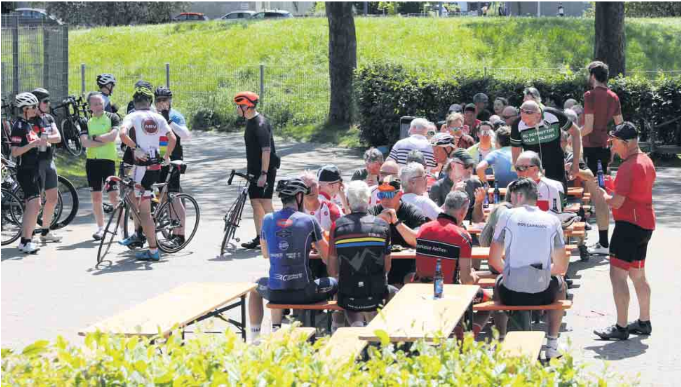
Bei strahlendem Sonnenschein starteten 532 Radsportler aus Nordrhein-Westfalen, den umliegenden Bundesländern und Benelux auf eine der sechs angebotenen Rennrad- oder Gravelbike-Routen.