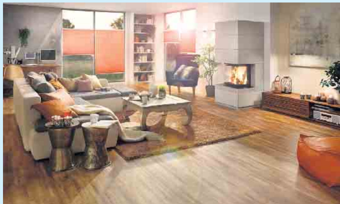
Auch ein moderner Sonnenschutz steigert den Wert.

Ein weiteres Kriterium für den Wert einer Immobilie ist, ob die Fenster und Türen den heutigen energetischen Standards entsprechen. Schlecht isolierte Bauteile treiben die sowieso teuren Energiekosten weiter in die Höhe und drücken den Wert einer Immobilie. „Man sollte möglichst auf dreifach verglaste Fenster bei der Modernisierung setzen“, emp-