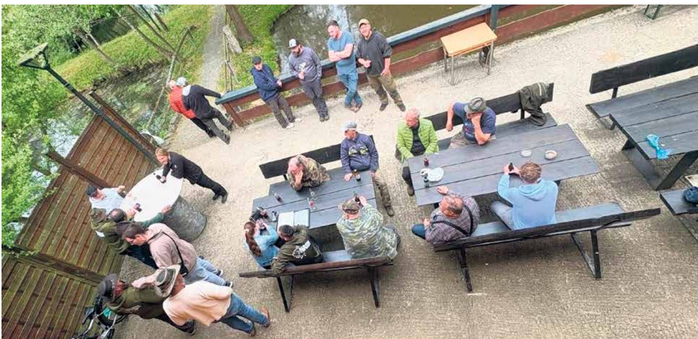
Pflege der Gemeinschaft im Verein

Am Nachmittag saßen die Angler noch im Vereinsheim zum Essen zusammen und tauschten noch Anglerlatein aus.