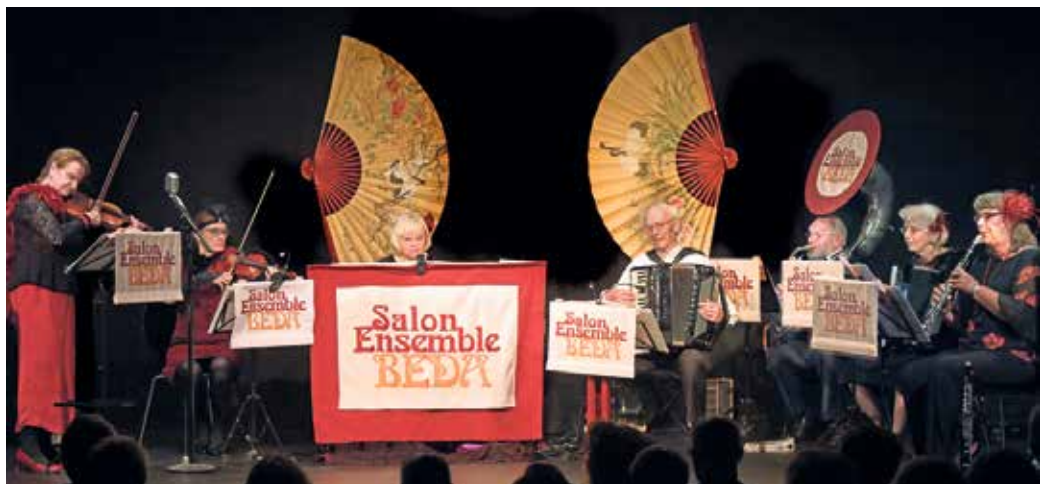
Das Salon Ensemble Beda begeisterte das Publikum im Kulturhaus theater1.