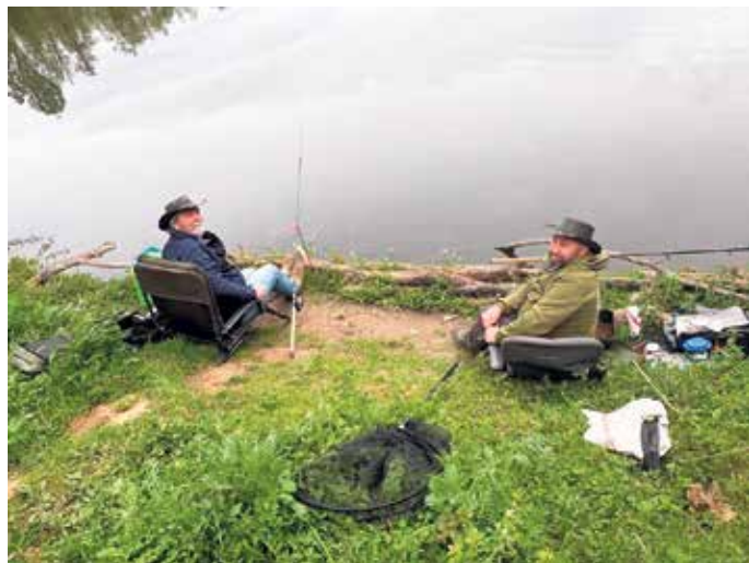
Erwartungsvolle Petrijünger.

Zum Auftakt der Angelsaison kamen am 3. Mai 21 Mitglieder des Fischerei-Vereins Euskirchen e.V. am Vorstau der Steinbachtalsperre in Euskirchen zusammen. Mit dem traditionellen Anangeln beginnt formal das Angeljahr.