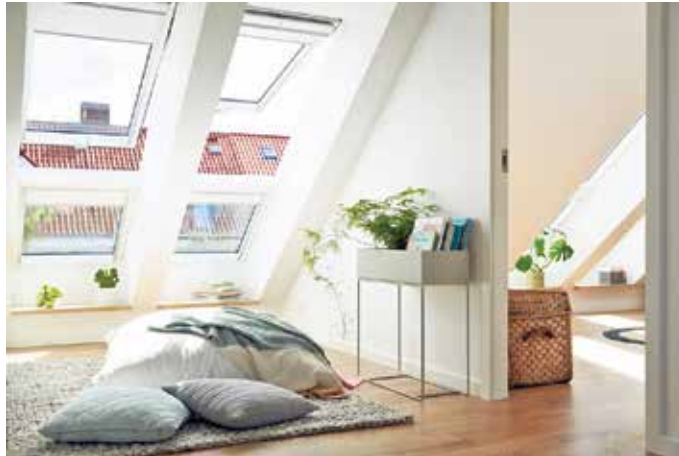
Glas schafft Licht, Raumbeziehungen und visuelle Offenheit.

Troisdorf. In modernen Gebäudehüllen ist Glas weit mehr als ein gestalterisches Element. Es übernimmt zentrale funktionale Aufgaben: Wärmedämmung, Tageslichtführung und Nutzerkomfort. Zudem beeinflusst es die Wirtschaftlichkeit eines Gebäudes über dessen gesamten Lebenszyklus. Leistungsstarke Verglasungen senken den Energieverbrauch, reduzieren Betriebskosten und helfen, Nachhaltigkeitsziele von Neubau- und Sanierungsobjekten zu erreichen. „Glas vereint architektonischen Anspruch mit messbarer Leistung und wird so zum Schlüsselbaustein zukunftsfähiger Gebäude“, sagt Jochen Grönegräs, Hauptgeschäftsführer des Bundesverbandes Flachglas (BF). Energieeffizienz als Grundpfeiler Energieeffizienz ist ein zentrales Thema bei Verglasungen. Im Gebäudebestand besteht großes Verbesserungspotenzial, wie eine Studie des BF mit dem Verband