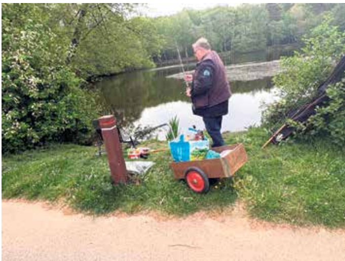
Vorbereitungen für das Anangeln.

Anangeln am Vorstau der Steinbachtalsperre