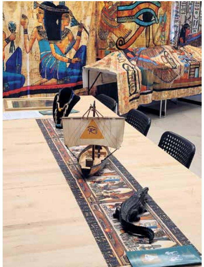
Bild aus unserem Kursraum im Museum