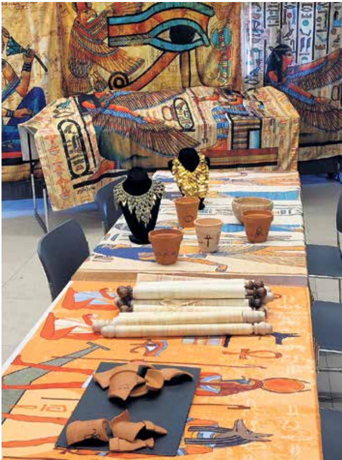
So sieht unser Workshopraum im Museum aus.

Zwölf Workshop-Termine für Kinder ab 7 Jahren im Mai und Juni