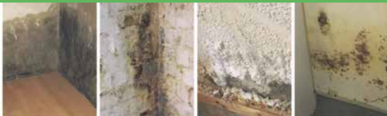
Defekte Horizontalsperre Querdurchfeuchtung Ausblühungen Schimmelbefall