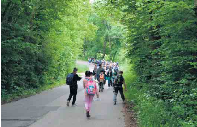
Über 100 Kinder aus OGS-Einrichtungen der KJA Bonn pilgerten durch Kirchheim