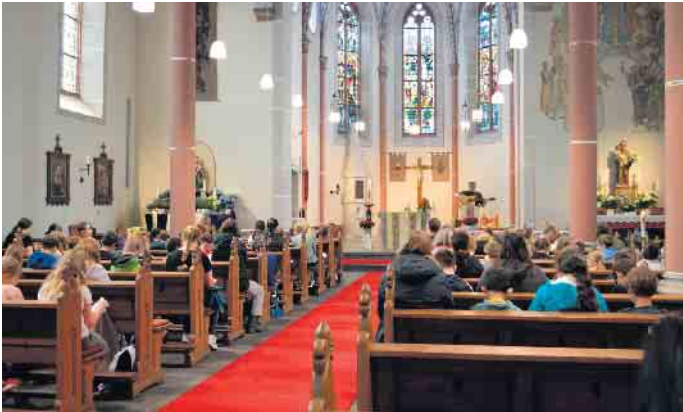
Station an der St. Martinus Kirche in Kirchheim