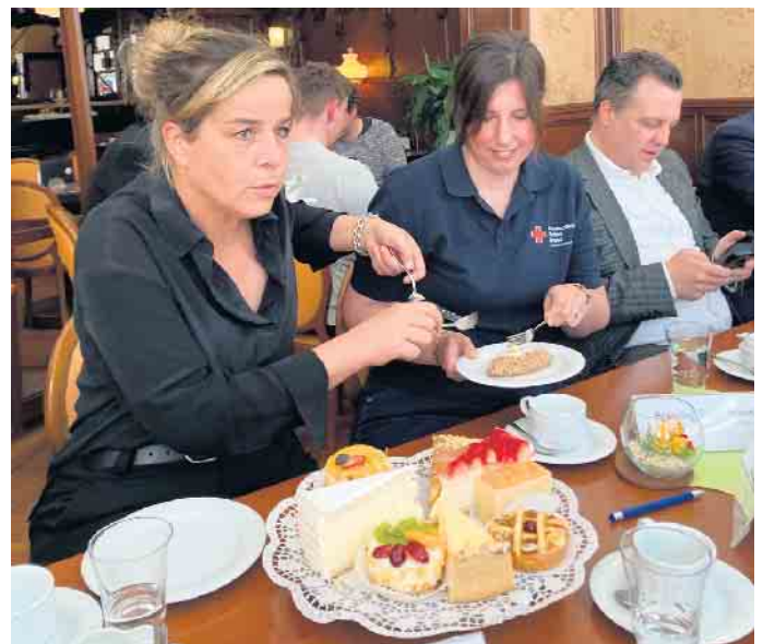
NRW-Vize-Ministerpräsidentin Mona Neubaur (l.) verteilt Kuchen an die Gäste. Im Euskirchener Café Kramer stimmten Service und Atmosphäre.

NRW-Vize-Ministerpräsidentin und Ministerin für Wirtschaft, Industrie, Klimaschutz und Energie, Mona Neubaur, hatte Vertreter der Wohlfahrtsverbände und Rotary Clubs Euskirchen zum Gespräch eingeladen.