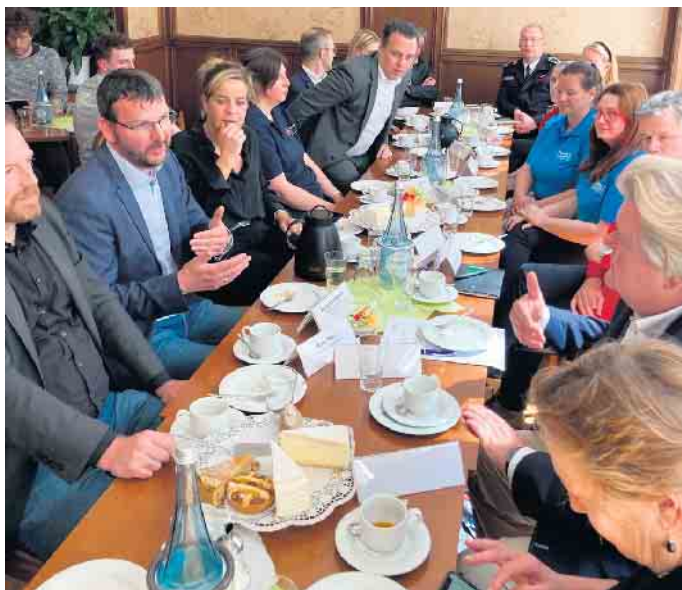
Eine gute Gastgeberin und aufmerksame Zuhörerin. NRW-Vize-Ministerpräsidentin Mona Neubaur (2. v.l.) im Gespräch mit Vertretern der Wohlfahrtsverbände und der Rotary Clubs Euskirchen.