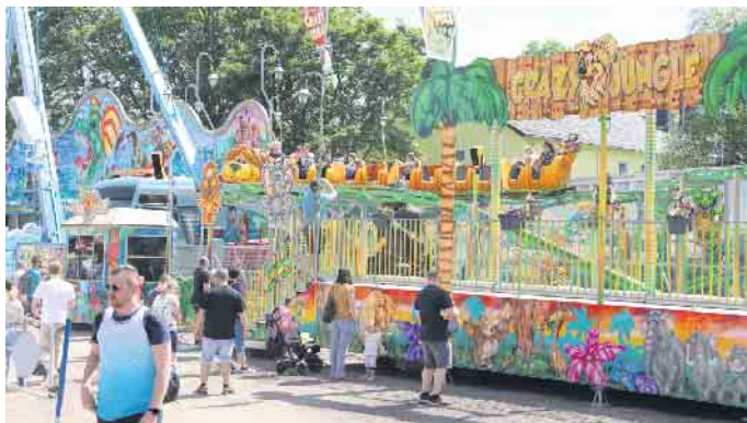
Auch die kleinen Gäste kamen mit der Familienachterbahn Crazy Jungle nicht zu kurz

Auf dem Charleviller Platz wurde erneut ein großes Festzelt aufgebaut, in dem ein tolles Programm auf alle Besucherinnen und Besucher wartete.