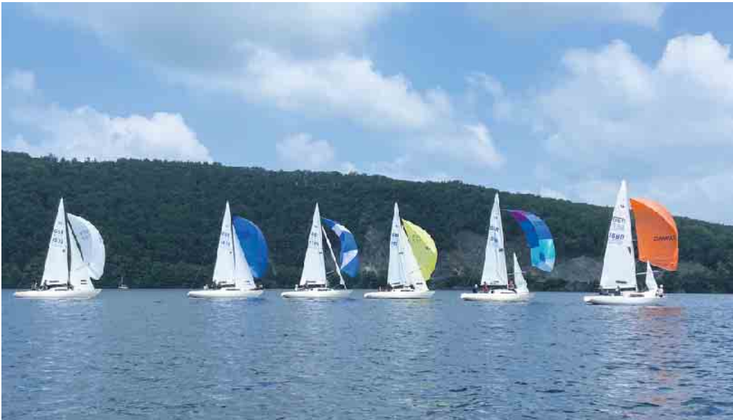
H-Boote auf Kurs.

Erste Regatta nach Corona hat stattgefunden