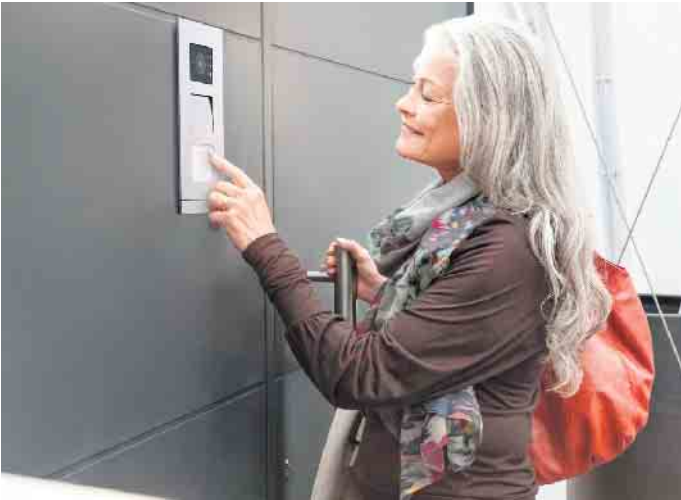
Viele Smart-Home-Funktionen können das Leben deutlich erleichtern und sicherer machen.

nennt Simon automatisierte Rollläden, welche die kräftezehrende Gurtbedienung überflüssig machen, das automatische Öffnen von Türen, die intelligente Beleuchtungssteuerung durch Bewegungsmelder oder Schalter und Steckdosen mit Orientierungslichtern. Zudem lassen sich Befehle zu Szenarien zusammenfassen - etwa ein einziger Schaltbefehl, um beim Verlassen des Gebäudes alle Lichter, Elektrogeräte und die Heizung auszuschalten und zugleich alle Zugänge zu verriegeln. Welche Anforderungen das Haus oder die Wohnung bei unterschiedlichen körperlichen Einschränkungen erfüllen sollten, zeigt eine übersichtliche Tabelle in der Broschüre „Elektroinstallation im AAL-Umfeld“, die unter www.elektro-plus.com/aal kostenlos heruntergeladen werden kann. Dort gibt es auch eine Vielzahl konkreter Planungstipps für Haus- und Wohnungsbesitzer.