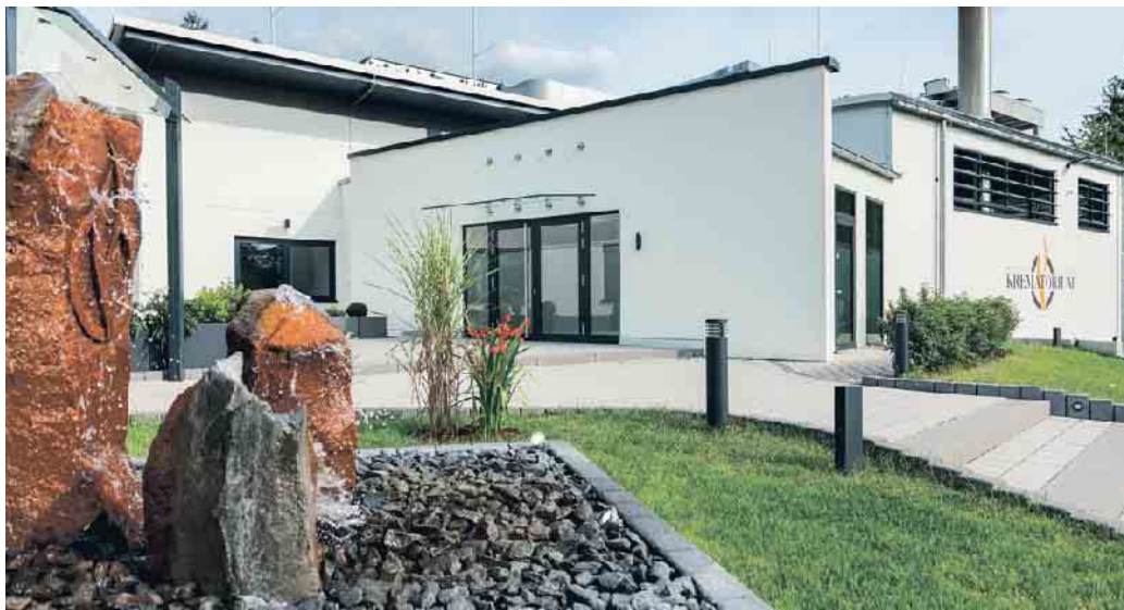
Feuerbestattung im Rhein-Taunus-Krematorium.

Selbstbestimmte Vorsorge - die Bestattungsverfügung