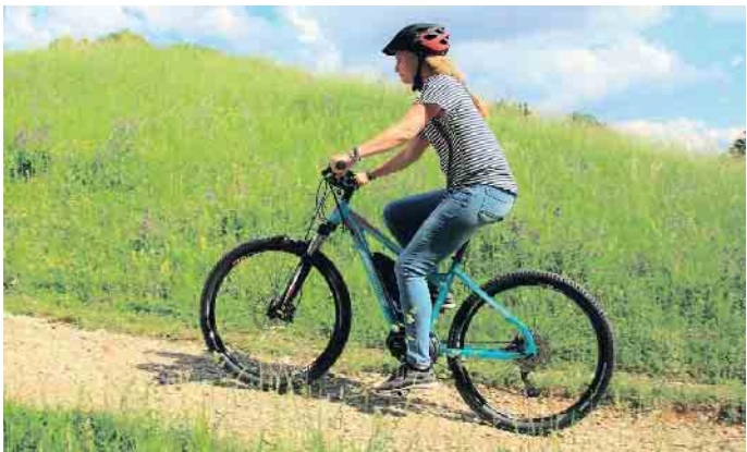
Vor dem Start in den Frühling sollte das Fahrrad oder E-Bike gründlich durchgecheckt werden.

Die Schrauben an Schutzblechen, Beleuchtung oder Klingel können selbst festgezogen werden. Bei anderen Komponenten gibt es oft exakt festgelegte Anzugdrehmomente. Deshalb ist ein Drehmoment-Schraubendreher notwendig - oder der Fachmann sollte ran. Nur eine saubere, gepflegte Kette