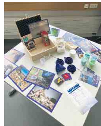
Bildungskoffer Grundschule - exemplarisch.

seine Ausführungen vor den interessierten Kolleginnen und Kollegen der geladenen Grundschulen sowie der weiterführenden Schulen aus dem Kreis Euskirchen, und ergänzte: „Die Nahrung wird mit Mikroplastik angereichert und Menschen nehmen Bestandteile chemischer Partikel auf“, erklärt der engagierte Pädagoge weiter und berichtet aus eigenen Projekterfahrungen mit Schülerinnen und Schülern zu diesem Thema: „Gut ist, die Situation vor Ort mit den Kindern zu betrachten und das Theoriegebäude erfahrbar zu machen.