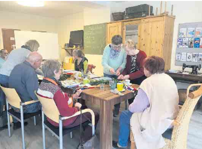
Engagiert und herzlich: Ehrenamtliche Betreuerinnen und Betreuer gestalten liebevoll die Nachmittage im Café Insel.

Das Servicezentrum Café Insel des Caritasverbandes für das Kreisdekanat Euskirchen e.V. lädt alle Menschen mit altersbedingten Erkrankungen herzlich zu einem geselligen Probenachmittag ein. Das Angebot richtet sich an diejenigen, die nicht allein sein möchten, sowie an Familien, die für ihre Angehörigen eine wertvolle Entlastungszeit benötigen. Jeden Mittwoch und Donnerstag, von 15 bis 17 Uhr, öffnet das Café Insel seine Türen und bietet in angenehmer Atmosphäre ein abwechslungsreiches Programm. Qualifizierte ehrenamtliche Betreuerinnen und Betreuer begleiten die Nachmittage mit liebevoll gestalteten Aktivitäten wie Gedächtnistraining, Bastelangeboten, gemeinsamem Singen sowie