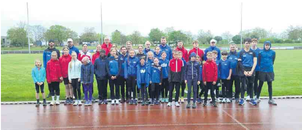
Leichtathleten der LGO Euskirchen und des CAS Schiffflange beim Training

In den Osterferien absolvierte die LGO Euskirchen ein erfolgreiches Trainingslager im Heinz-Flohe Stadion in Euskirchen. Rund 20 Athleten nutzten die Woche, um sich intensiv auf die bevorstehende Sommersaison vorzubereiten. Das Trainingsprogramm wurde durch abwechslungsreiche Freizeitaktivitäten wie ein Hockey-Turnier, einen Schwimmbadbesuch sowie einen Ausflug ins Jump House Köln ergänzt. Ein weiterer Höhepunkt war die Vernetzung mit internationalen Leichtathletikvereinen, unter anderem mit dem CAS Schiffflange aus Luxemburg. Diese Begegnungen boten den Athleten wertvolle Einblicke und neue sportliche Impulse. In allen Trainingseinheiten zeigten die Teilnehmer großes En-