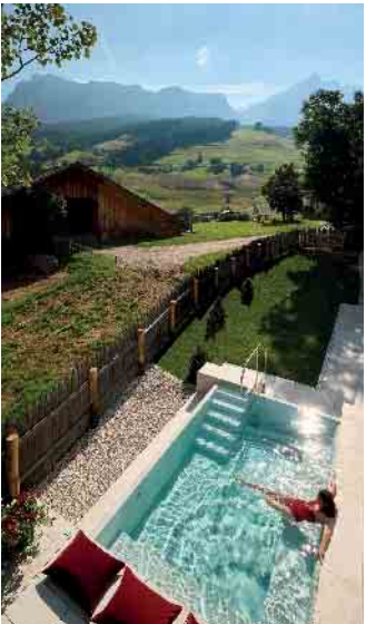
Relaxen im Spa