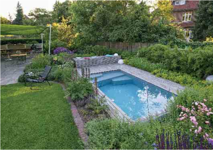
Kleine und feine Wasseroase

Für einen Pool braucht man viel Platz? Keinesfalls. Wasseroasen gibt es in unterschiedlichen Größen. Selbst auf einer Terrasse lässt sich ein Wohlfühltempel mit erfrischendem Nass kreieren. Denn es gibt Alternativen zum klassischen Schwimmbecken. Und Poolexperten haben das Credo verinnerlicht: ein Pool passt immer.