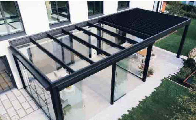
Das Lamellendach lässt sich mit einem Flachdach in nur einem Überdachungssystem kombinieren - und ist damit einzigartig.

Wetter- und sonnengeschützter Garten-Genuss