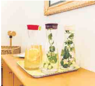
Stilles Wasser, Gemüse- und Fruchtsäfte gehören beim Fasten dazu.

Studie der Hans-Böckler-Stiftung deswegen häufig erschöpft. Eingeschränkte Bildschirmzeiten, Waldspaziergänge und analoge Hobbys können im Alltag helfen. Für einen richtigen Digital Detox braucht es mehr: ein paar Tage ohne Internet, Fernseher und Radio. Das ist beispielsweise im Samariter-Fastenzentrum im Münsterland möglich. „Bei uns geht es darum, wieder zu sich selbst zu kommen“, sagt Kisters. Der Verzicht helfe, jeden körperlichen und seelischen Ballast abzuwerfen und neue Kraft zu finden. (DJD)