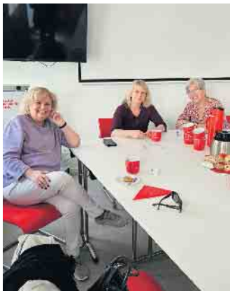
SPD öffnet die Tür: Bürgergespräch im Parteihaus in der Hochstraße 34 in Euskirchen.

Ende: Aus der Arbeit der Parteien SPD Euskirchen