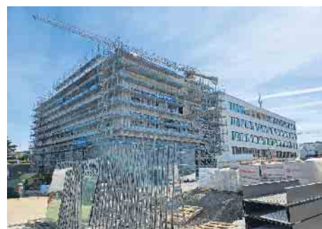
Das Gebäude besteht aus zwei Baukörpern mit unterschiedlichem Bauzustand.

heinschränkungen vorgesehen. Auch die Besprechungsräume orientieren sich an modernen Anforderungen. Sie bieten zu-