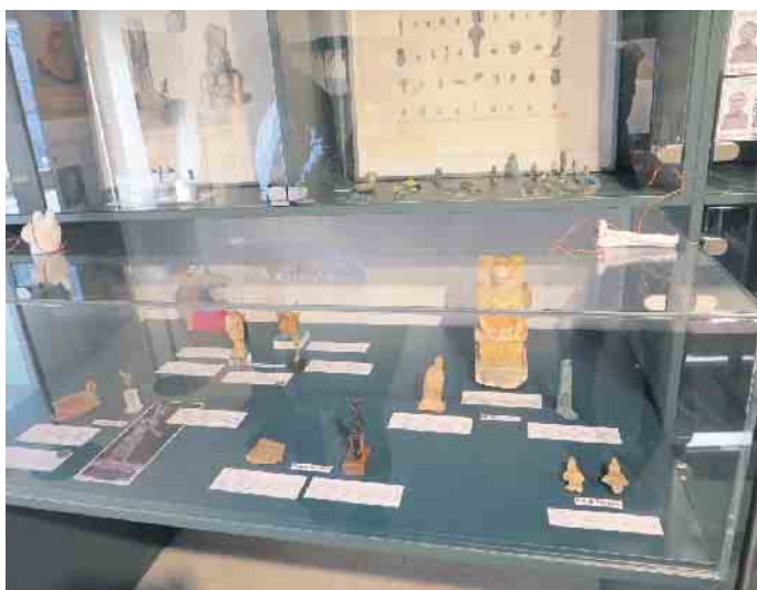
Eingangsbereich des neuen Museums

Seit Oktober ist das Ägyptische Museum der Universität Bonn nun am neuen Standort in der Poststraße 26 (P26) in Bonn. Die Eröffnungsausstellung „Eine Zeitreise am Nil - Ägypten in Bonn“ ist unbedingt einen Besuch wert. Mit rund 1.000 Exponaten bietet sie ein kulturhistorisches Panorama mit einigen Highlights, die in keinem anderen Museum außerhalb Ägyptens zu sehen sind. Nun folgt die erste Sonderausstellung im P26. Der Titel lautet: