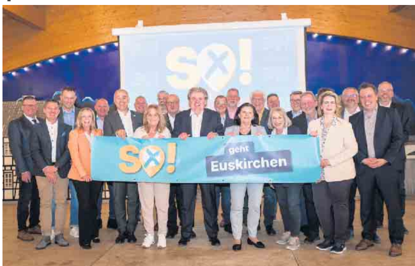
Die 22 Kandidatinnen und Kandidaten des CDU Stadtverbandes Euskirchen freuen sich auf den Wahlkampf zur diesjährigen Kommunalwahl in Euskirchen.

Ende: Aus der Arbeit der Parteien CDU Euskirchen