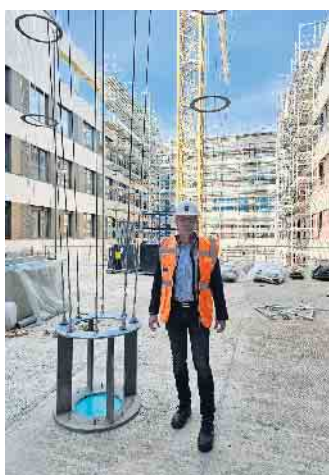
Rankhilfen für die Begrünung im Innenhof

Der Rathausneubau in Euskirchen schreitet voran. Die Bezugsfertigkeit ist für das Frühjahr 2026 geplant. Erster Kunde für städtisches Fernwärmenetz. Investitionskosten bleiben im Plan.