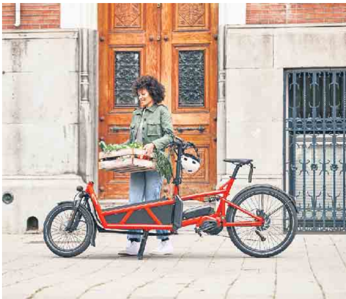
Lastenräder gehören in vielen Städten zum Alltagsbild. Mit elektrischer Unterstützung ermöglichen E-Cargobikes den bequemen Transport zum Beispiel von Wocheneinkäufen.

Wichtig ist gerade bei elektrischen Lastenrädern ein leistungsstarker Akku, um angesichts des Eigengewichts und der transportierten Lasten eine hohe Reichweite zu ermöglichen. Praktisch ist zudem die Navigationsfunktion. Das vernetzte Display navigiert entspannt zum nächsten interessanten Ort, egal ob zu Ausflugszielen oder einem neuen angesagten Café. Praktisch sind dabei die Reichweiten-Hinweise, die automatisch berechnen, ob das Wunschziel mit elektrischer Unterstützung noch bequem erreicht werden kann. (djd)