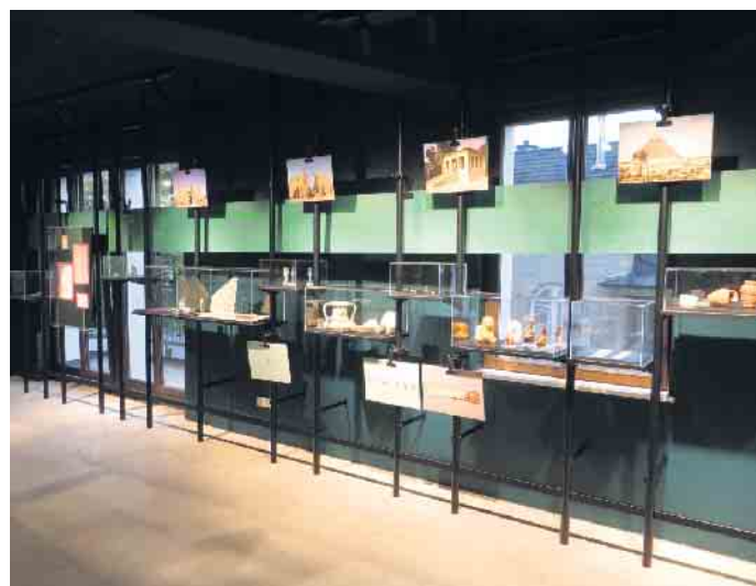
Objekte zur Herodot-Ausstellung

Schon der antike griechische Autor Herodot, der „Vater der Geschichtsschreibung“ (5. Jh. v. Chr.), war fasziniert von der ägyptischen Götterwelt und beschäftigte sich im zweiten Buch seiner „Historien“ ausführlich mit dem Land und