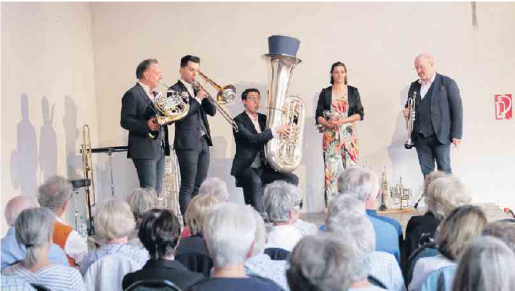
Harmonic Brass im letzten Jahr in Billig

Das diesjährige Programm heißt: „Big Trip“. Dazu wird folgendes veröffentlicht:Bitte anschnallen! Im neuen Konzertprogramm von Harmonic Brass wird schnell beschleunigt von Null auf Staunen sind es wenige Sekunden. Hauptrolle in diesem Programm spielt der Tourbus des Ensembles. Für die Zuhörer werden alle Türen geöffnet. Man wird mitgenommen auf eine sehr spezielle Reise und bekommt herrlich-komische Einblicke in dieses sympathische Quintett. Das alles mit der neuen, spektakulären Musikauswahl von Harmonic Brass mit Werken von Grieg, Jenkins, Ravel und Händel. Termin: Samstag, 24. Mai, 19.30 Uhr Karten im Vorverkauf 22 Euro über 0160-92203891, an der Abendkasse 24 Euro