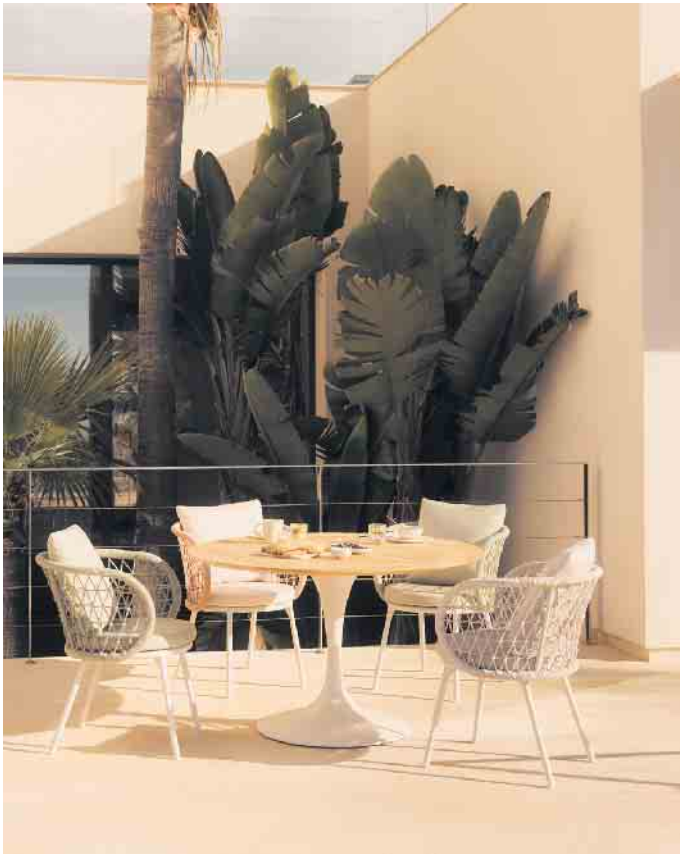
Sommerliches Flair: Der Säulentisch im Retrostil und die Aluminiumstühle mit den abgerundeten, kordelbespannten Lehnen bieten viel Komfort.

Runde Säulentische, bequem gepolsterte Stühle mit Kordelbespannung und individuell planbare Outdoorküchen prägen die neue Außensaison