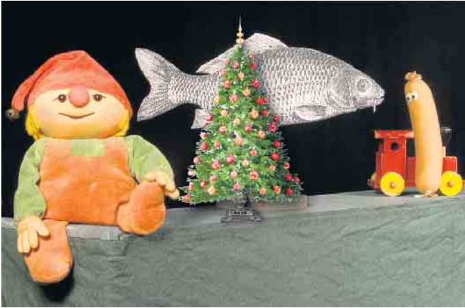
Goethe, Karpfen und Wurst.

Figurentheater, Schauspiel, Lieder und Gedichte für Kinder ab 4