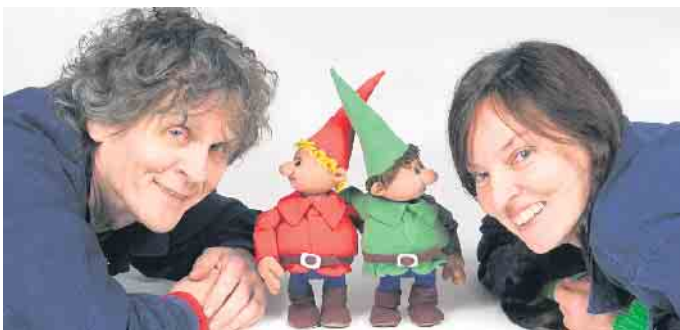
Himpelchen und Pimpelchen mit ihren beiden „Lehrlingen“.

„theater 1“ Licht ins Dunkel und das Publikum kann an diesen Erkenntnissen teilhaben. In einer Geschichte mit einfachen, klaren Bildern und zwei liebenswerten Puppen zeigen die beiden Akteure und Figurenspieler, dass Vorsicht und Rücksicht zwei ganz wichtige Elemente für das Miteinander sind. Tickets gibt es an der Tageskasse; Kartenzahlung ist nicht möglich. Es wird empfohlen, unter 02257-4414 oder unter kulturhaus@theater-1.de zu reservieren. Reservierungswünsche, die erst am Tag der Veranstaltung eingehen, können möglicherweise nicht mehr berücksichtigt werden.