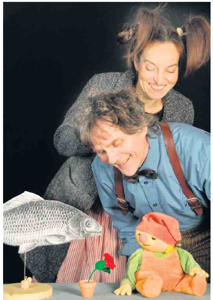
Der kleine Goethe ist sehr stolz auf seine Blume