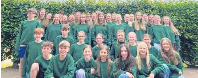
Trainingslager-Teilnehmer des TV Rheinbach.

Leichtathleten des TV Rheinbach in Verden