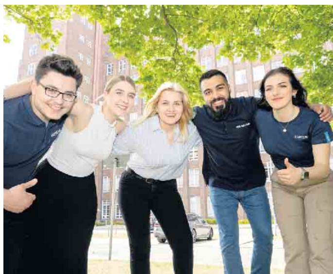
Junge Karrierestarter sollten ihr späteres Betätigungsfeld nach persönlichen Neigungen wählen.

Siemens etwa hat auf der Webseite ausbildung.siemens.com dazu diverse Erfolgsgeschichten bereitgestellt. Diese zeigen anhand verschiedener Fälle jeweils exemplarisch auf, welche Berufe überhaupt zu einer Wunschtätigkeit