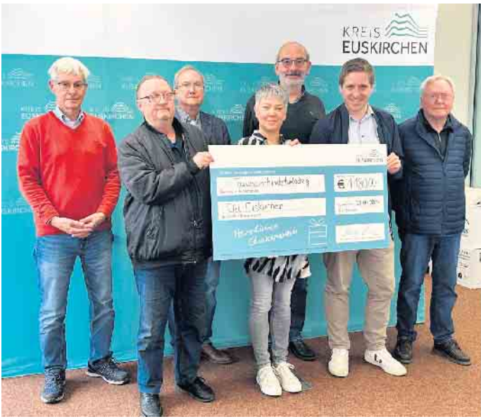
Über eine Spende von je 1.180 Euro durften sich die Tafeln aus Euskirchen, Zülpich, Weilerswist, Mechernich, Kall und Bad Münstereifel freuen.

te. „Es ist wichtig, dass die ehrenamtliche Arbeit der Tafeln unterstützt wird. Sie leisten einen großen Beitrag für bedürftige Menschen in unserer Gesellschaft.“ Die Vertreter der einzelnen Tafeln nutzten den Termin, um einen kurzen Einblick in die aktuelle Situation zu geben. Auch wenn sich die Lage je nach Tafel im Detail unterscheidet, so arbeiten sie doch alle am Limit. Aufgrund des Krieges in der Ukraine werden noch einmal viele zusätzliche Menschen versorgt, was sowohl personell wie auch materiell an Grenzen stößt. Viele Tafeln haben sogar schweren Herzens einen Aufnahmestopp verhängen müssen. Über die unerwartete Spende haben sie sich unisono sehr gefreut. Landrat Markus Ramers dankte ihnen für ihr Engagement. „Sie stellen sich Woche für Woche in den Dienst der bedürftigen Men-