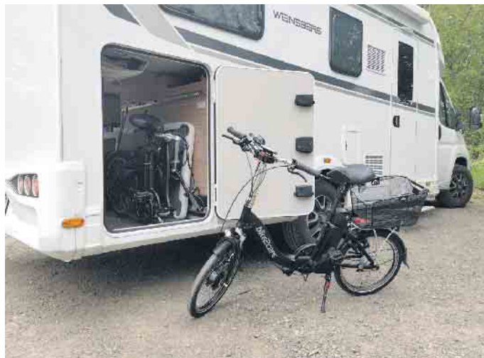
E-Falträder lassen sich in jedem Kofferraum und auch im Wohnmobil transportieren.

Moderne E-Falträder haben mit den Klapprädern aus den 70er- und 80er-Jahren wenig zu tun. Sie lassen sich zwar noch immer in der Mitte zu einer handlichen, leicht transportablen Größe zusammenklappen, nunmehr ist allerdings auch ein leistungsfähiger Elektromotor als Zusatzantrieb eingebaut. Solche E-Falträder lassen sich in jedem Wohnmobil und im Kofferraum der meisten Autos transportieren, ein spezieller Fahrradträger ist nicht nötig. Wichtig ist dabei auch das Gefühl der Sicherheit. Dafür sorgen der tiefe Einstieg der Räder