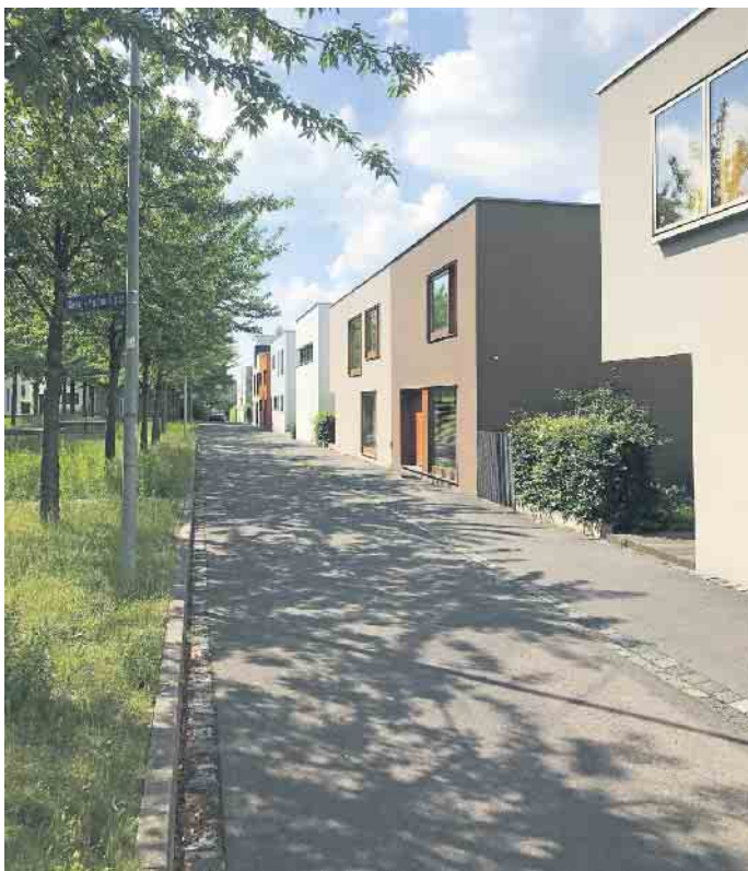
Die farbige Vielfalt von Putz bringt eine lebendige Atmosphäre in jede Wohnsiedlung.