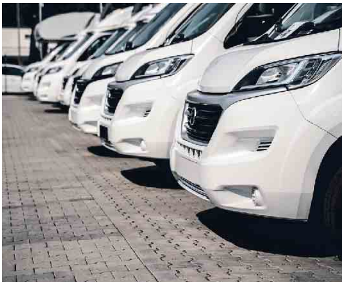
Wohnwagen sind aktuell sehr beliebt.

Wohnwagen und Reisemobile liegen in Deutschland voll im Trend. Auch die Miet-Nachfrage ist groß. Doch mit ein paar Tipps können Mietwillige ein Fahrzeug für ihren Traum-Urlaub finden. Der Caravaning-Boom sowie Engpässe in der Produktion führen auch zu einem knapperen Angebot auf dem Mietmarkt. Zudem kaufen viele Reisemobil- oder Wohnwagen-Fans die Fahrzeuge, die sie in der Miete ausprobiert haben.