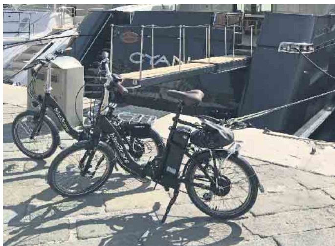
Ein deutliches Plus an bequemer Mobilität vor Ort gewinnt, wer ein kompaktes E-Faltrad am Urlaubsziel nutzen kann.

Auch in den deutschen Großstädten sind E-Falträder die perfekte Lösung für mobile Städter. Im Gegensatz zu Fahrrädern dürfen sie in Bussen und Bahnen überall mitgenommen werden, ein Extraticket ist ebenfalls nicht nötig. Zu Stoßzeiten sind öffentliche Verkehrsmittel ohnehin meist so voll, dass Fahrräder nur mit Mühe transportiert werden können, für das Faltrad findet man immer ein Plätzchen. Das gilt allerdings auch nur dann, wenn das Faltrad qualitativ hochwertig ist und entsprechend schnell und bequem klein gemacht werden kann. (djd)