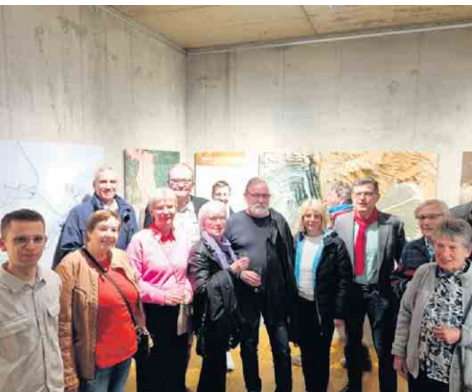
SPD-Vertreter bei der Eröffnung der sehenswerten Ausstellung „Human Footprints“.

Städte, deren Weltraumperspekti- ven zu sehen sind. Sie haben sich nicht verlesen! Ein Weltraumfoto unseres Heimatstädtchens kann mit einer 90 Jahre alten Luftauf- nahme verglichen werden. Man kann gut erkennen, wie sich die Euskirchener Kernstadt und die umliegenden Ortschaften verän- dert und ihre Einwohnerzahl dabei verdoppelt haben. Zahlreiche SPD-Vertreter*innen haben die Eröffnung der Ausstel- lung mit den einführenden Erläu- terungen von Dr. Markus Eiselt, Geschäftsführer der eo Vision aus Salzburg, die die Fotos der Aus- stellung erstellt haben, sehr ge- nosssen. Die Ausstellung ist noch bis zum 01.09.2024 zu sehen. www.spd-euskirchen.de Michael Höllmann