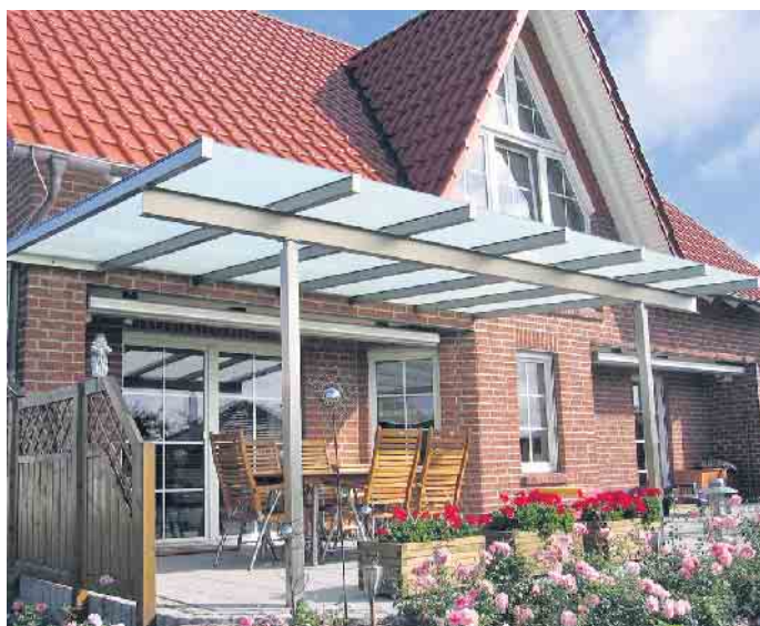
Terrassendächer sind vielseitig einsetzbar und bieten das besondere Etwas.

Verglasung des Wintergartens kann mit natürlich reinigendem Glas ausgeführt werden: Regen und Sonne übernehmen dann die Säuberung. „Ab und zu den Wasserteuch benutzen reicht schon und die Oberfläche erstrahlt in neuem Glanz“, erklärt Grönegräs abschließend. (BF/FS)