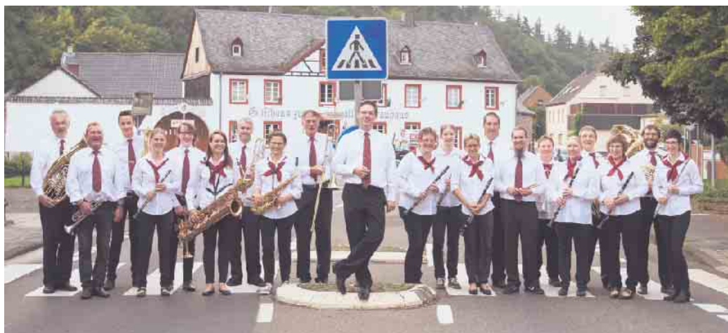
50 Jahre MV Kreuzweingarten-Rheder.

Auch wenn das Durchschnittsalter im Orchester des MV Kreuzweingarten-Rheder mit 47 Jahren durchaus prädestiniert wäre für derlei Anwendungen, stehen die Musikerinnen und Musiker mit beiden Beinen im Leben. Das Konzert, das am Sonntag, 21. April, in der Marienschule auf die Bühne gebracht werden soll, ist im ersten Teil eine Hommage an die Orchesterleiter und die vielen MitspielerInnen der vergangenen 50 Jahre. In der zweiten Hälfte präsentiert das Orchester seine Bandbreite mit Musikstilen verschiedener Komponisten und beweist auch hier, dass moderne Blasmusik anspruchsvoll, eingängig und mitreißend sein kann. Sie sind herzlich eingeladen am