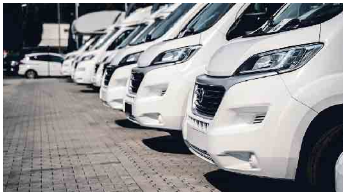
Wohnwagen sind aktuell sehr beliebt.

Wohnwagen und Reisemobile liegen in Deutschland voll im Trend. Auch die Miet-Nachfrage ist groß. Doch mit ein paar Tipps können Mietwillige ein Fahrzeug für ihren Traum-Urlaub finden.