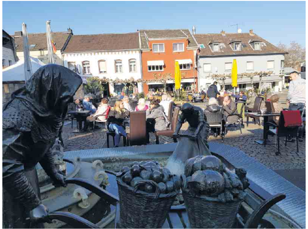
Alter Markt Euskirchen im April. SPD meint, auch in 2023 ohne Gebühren für die Aussengastronomie.

speisen ist für viele Menschen ein Stück Lebensqualität.