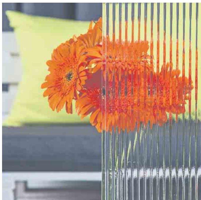
Auch Ornamentglas ist für Vögel sichtbar. Es hilft ihnen, Kollisionen zu vermeiden.

türlichen Todesursachen für Vögel. Gleichzeitig verbringen die Menschen hierzulande, je nach Beruf, bis zu 90 Prozent ihrer Zeit in Häusern. Wir benötigen daher Glas in der Architektur, damit wir genügend Tageslicht aufnehmen und gesund bleiben. Der sich daraus ergebende Konflikt zwischen Mensch und Tier lässt sich jetzt ein gutes Stück weit lösen: Denn Vogelschutzglas ermöglicht erstmals, architektonisch ansprechende Gebäude mit viel Glas zu schaffen, die durch intelligente technische Lösungen zudem energieeffizient sind.