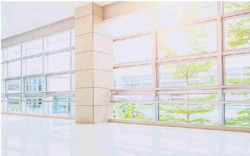
Vogelschutzglas mit Laserdruck. Auf der Oberfläche werden kleinste Punkte oder wahlweise auch Geometrien aufgebracht. Für den Menschen ist diese Veredelung kaum wahrnehmbar.

Bei Punktraster-Beschichtungen durch Siebdruck, Säureätzung oder Laser werden Muster auf die Scheibe aufgetragen, um es für Vögel sichtbar zu machen. Diese können sehr dezent als Muster gestaltet werden, oder aber Logos, komplexe Designs und Symbole enthalten. Ein neues Beschichtungsverfahren ergänzt das bisher eingesetzte Siebdruck-Verfahren. Die sichtbaren, metallischen Markierungen sind dabei ertastbar und in Mustern wie Punkten oder Linien zu er-