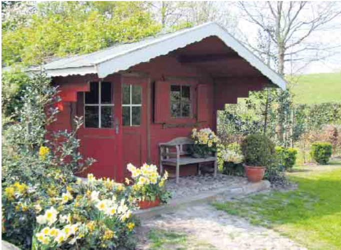
Wir genießen die stärkere Sonneneinstrahlung im Frühling und freuen uns an Austrieb und Blüte der Pflanzen.

Ob Stadtgarten oder ländliche Terrasse - wieder draußen zu sein, bedeutet Freiheit, Entspannung und Lebensfreude.