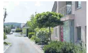
Einfach schön, einladend und für Hausbewohnende wie Passanten eine tägliche Freude.

gartengestaltungen auf sich wirken zu lassen“, empfiehlt Uschi App. Dabei soll deutlich werden, dass eine naturnahe Vorgartengestaltung nicht nur ästhetisch überzeugt, sondern auch einen wertvollen Beitrag zum Klima- und Artenschutz leistet. Pflanzenreiche Vorgärten mit Stauden, Sträuchern und Blühpflanzen bieten Lebensraum für Insekten und Vögel, verbessern das Mikroklima und reduzieren die Aufheizung an heißen Sommern. Zudem tragen sie zu einem attraktiven Ortsbild bei und steigern das Wohlbefinden der Anwohnerinnen und Anwohner. Im Gegensatz dazu erweisen sich Schottergärten als problematisch: Sie erhitzen sich stark, sind ökologisch wertlos und verursachen langfristig höhere Pflegekosten. Weitere Informationen zu den positiven Eigenschaften von lebendig gestalteten Vorgärten sowie Gestaltungstipps und eine Liste mit Garten- und Landschaftsbaubetrieben in der Nähe, die auch auf kleiner Fläche viel bewegen können, gibt es auf www.mein-traumgarten.de/Vorgarten . BGL