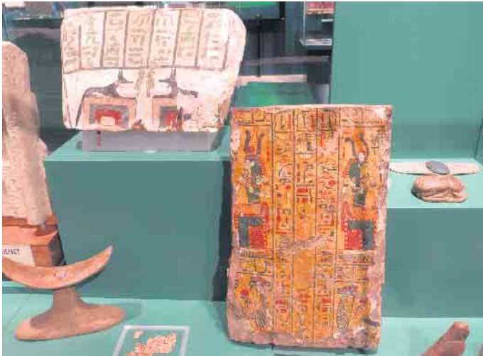
Tafeln mit Hieroglyphen Schrift

14 Workshop-Termine für Kinder ab sieben Jahren im März und April vom Förderverein des Ägyptischen Museums der Uni Bonn