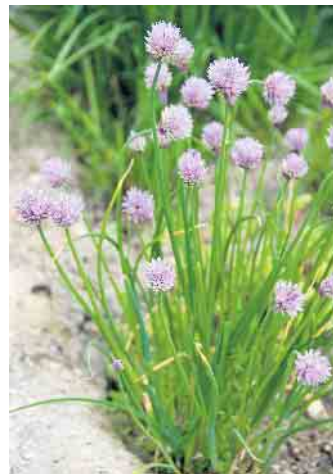
Der Schnittlauch aus dem eigenen Garten ist Schmuck ... und leckere Salatbeigabe.