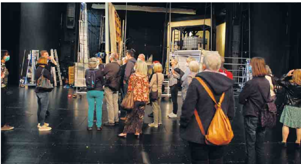
Impressionen vom Theaterspaziergang 2022

Theaterspaziergang anlässlich des Welttheatertags