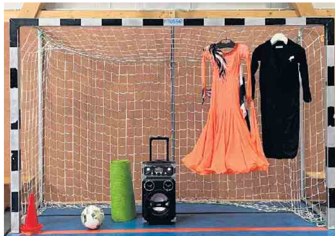
Sich sportlich neu erfinden.