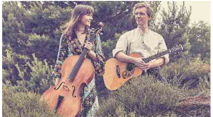
Das Heart Strings Duet kommt wieder nach Bad Münstereifel.