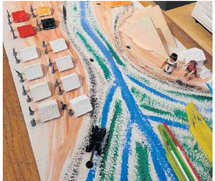
Flussverlauf des Nils

telt werden, wie er im Museum zu sehen ist. Auch kann man sehr alten Schmuck ansehen und anfassen. Ebenso ist ein Holzkästchen in eine Schmuckkassette zu verwandeln.