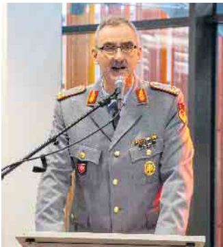
Brigadegeneral Webert lud zum Neujahrsempfang.

Ende: Aus der Arbeit der Parteien SPD Euskirchen