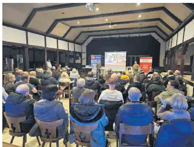
Volles Haus bei der bn:t Infoveranstaltung in Stotzheim.

Der kontinuierlich steigende Datenverbrauch macht Glasfaser zur besten und modernsten Lösung, um den Anforderungen an Geschwindigkeit und Datenvolumen gerecht zu werden. Glasfaser bietet nicht nur extrem hohe Bandbreiten, sondern auch eine äußerst stabile und zuverlässige Verbindung - selbst bei starker Nutzung und hoher Auslastung. Anwendungen wie Streaming, Smart Home, Telemedizin oder das ge-