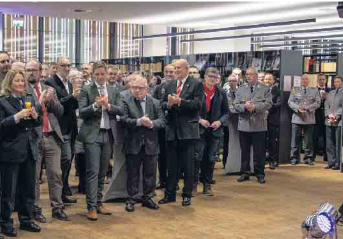
Gäste aus Politik und Verwaltung beim Neujahrsempfang der Bundeswehr am Standort Euskirchen.

Brigadegeneral Webert, höchster Offizier der Bundeswehr am Standort Euskirchen und Chef von ca. 1.600 Soldaten und zivilen Bediensteten, hatte zum Neujahrsempfang in die Gersdorff-Kaserne geladen.