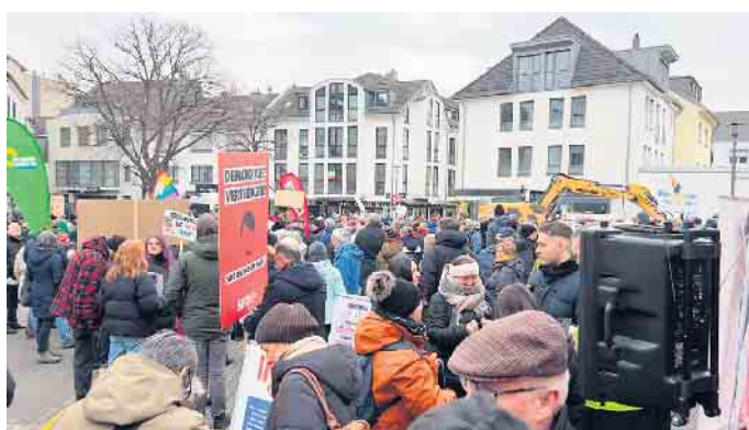
Über 600 Menschen versammelten sich auf dem Klosterplatz in Euskirchen zu einer Demonstration gegen Rechts.

Für einen besonderen Moment sorgte der Musiker Hannes Schöner aus Bad Münstereifel, der ge-