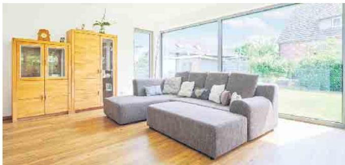
Aluminiumfenster sind bei großformatigen Panoramafenstern besonders beliebt.

Aluminiumrahmen werden wegen ihrer guten Statik sowie des robusten und doch leichten Materials besonders für große, moderne Fens-