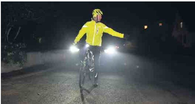
Reflektoren an der Kleidung sind in der dunklen Jahreszeit angesagt.

cken, Schuhen und Schulranzen. Spezielle Accessoires wie Armbänder, Mützen oder Schals mit Reflektoren können dabei helfen in der Dunkelheit die Sichtbarkeit zu erhöhen. Wer mit dem Rad zur Arbeit oder in die Schule fährt, sollte regelmäßig die Beleuchtung am Fahrrad überprüfen. Gesetzlich vorgeschrieben sind Vorder- und Rückleuchten sowie Front- und Rückreflektoren. Viele moderne Licht- und Dynamosysteme haben eine zusätzliche Standlichtfunktion integriert, die ebenfalls die Sicherheit im Dunkeln erhöht. Fahrräder und Pedelecs, die nicht serienmäßig mit einer Lichtanlage ausgerüstet sind, müssen mit Akkuleuchten ausgestattet werden. Wichtig: sie müssen für den Betrieb im Straßenverkehr zugelassen sein und dürfen andere Verkehrsteilnehmer nicht blenden.