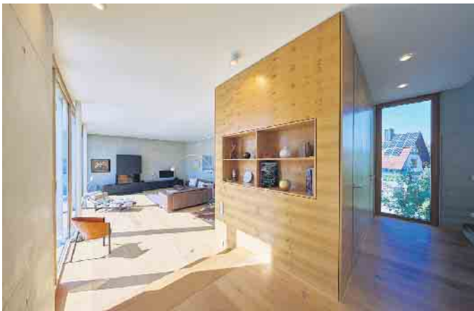
Hier entfaltet das Furnier der Asteiche seine außergewöhnliche Wirkung.

Wie faszinierende Furnierbilder entstehen