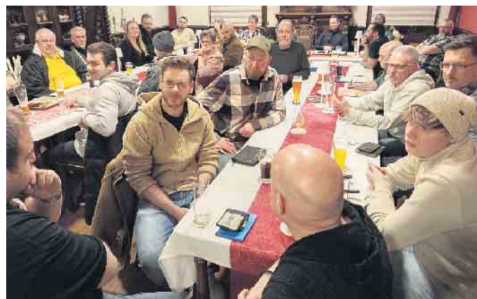
Teilnehmer der Jahreshauptversammlung