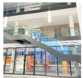
Das Foyer des neuen Rathauses mit dem Bürgerbüro im Erdgeschoss und den Fraktionsbüros als Anlaufstelle in der zweiten Etage.